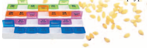
СХЕМА ПРИМЕРНО ТАКАЯ: