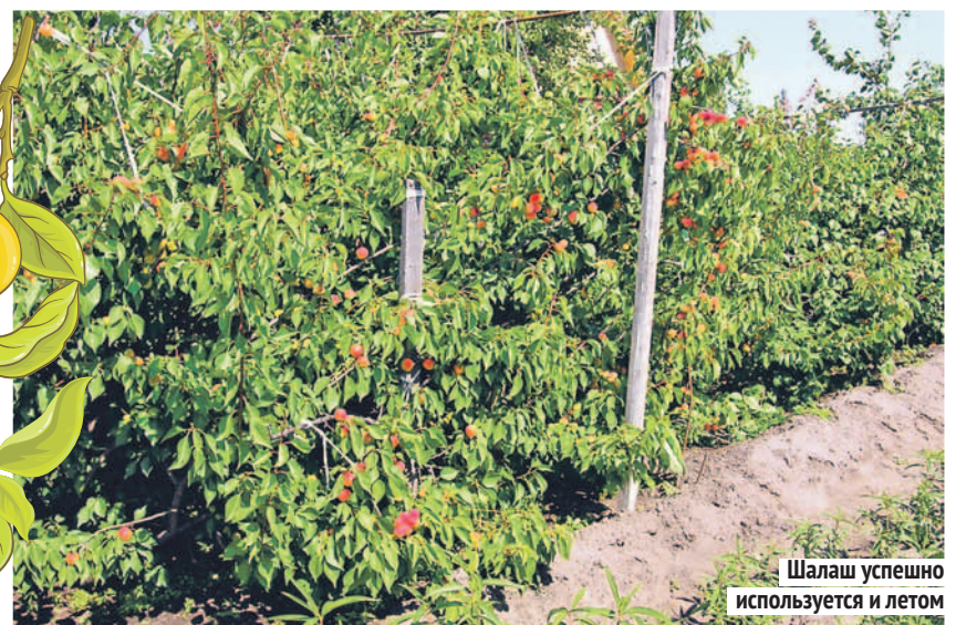
Шалаш успешно используется и летом