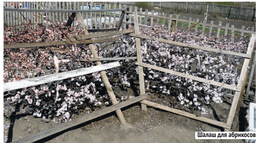
Шалаш для абрикосов