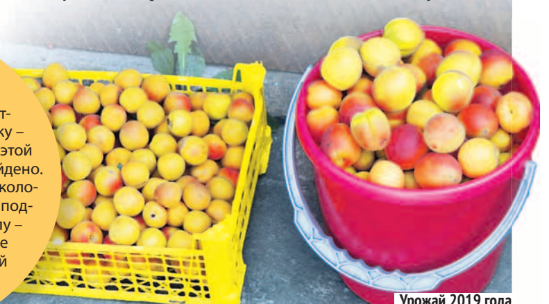
Урожай 2019 года

Из подкормок Кидясовы отдают предпочтение коровяку – для питания растений лучше этой «конфетки» пока ничего не найдено. Плоды вырастают не только экологичными, но и сладкими. Для подкормки используют еще золу – подкармливают до и после цветения. И приствольный круг сразу мульчируют перегноем