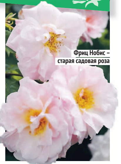
Фриц Нобис – старая садовая роза

3 Новые шрабы – это самая многочисленная группа, так как оригиналы роз всех стран и континентов занимаются выведением все новых и новых сортов кустарниковых разновидностей.