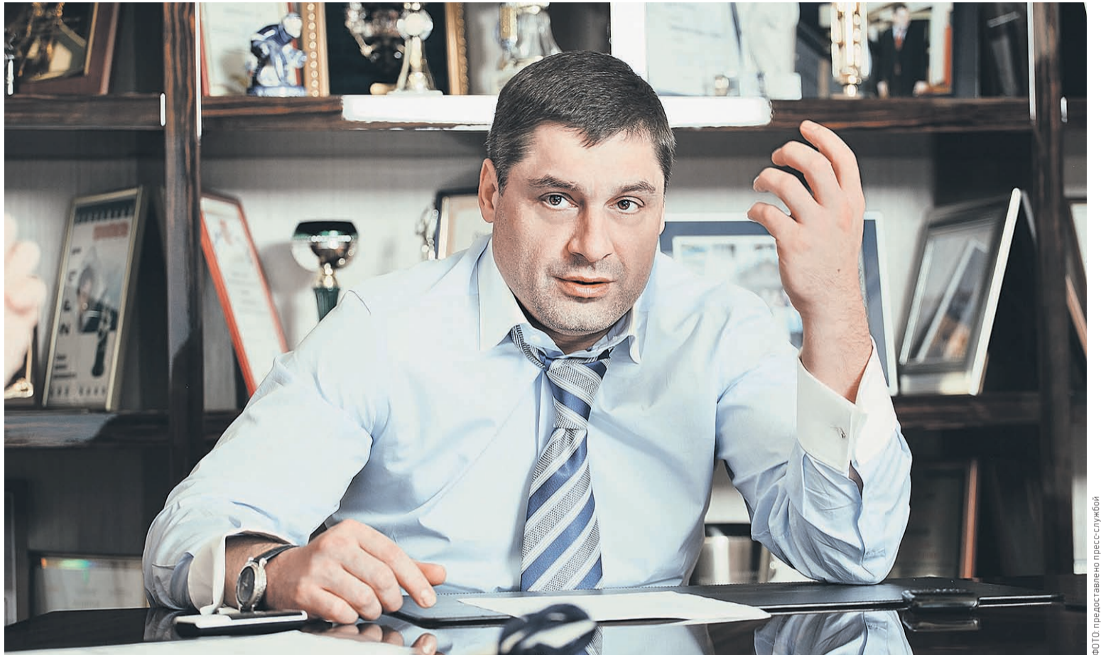
Группа БИН объединит все свои негосударственные пенсионные фонды в один и назовет его «Сафмар» — в честь бабушки и дедушки Микаила Шишханова

Банки — не единственный финансовый актив группы БИН, у нее также есть четыре пенсионных фонда и еще один — пятый — в стадии приобретения. С учетом этого последнего (НПФ «Райффайзен») суммарные активы пенсионных фондов группы составляют 145,9 млрд руб., из которых 136,3 млрд руб. — пенсионные накопления. Про эти активы Шишханов говорит, что пока только намерен разработать стратегию для них: «Мы будем изучать опыт других стран и выберем стратегию для наших фондов».