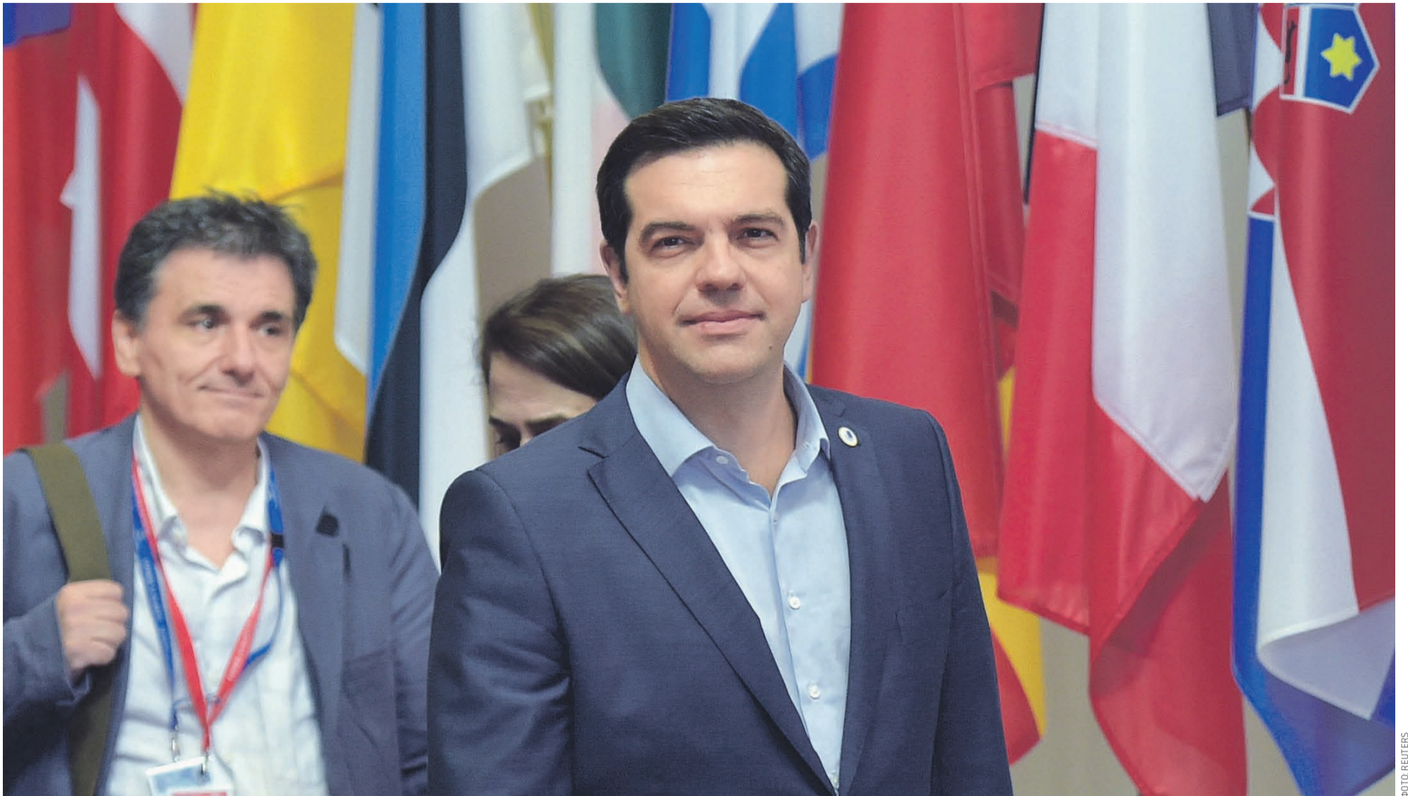
Премьер-министр Греции Алексис Ципрас пошел на значительные уступки кредиторам в обмен на трехлетнюю программу помощи в размере €82–86 млрд

О чем договорились Греция и Евросоюз: девять главных вопросов