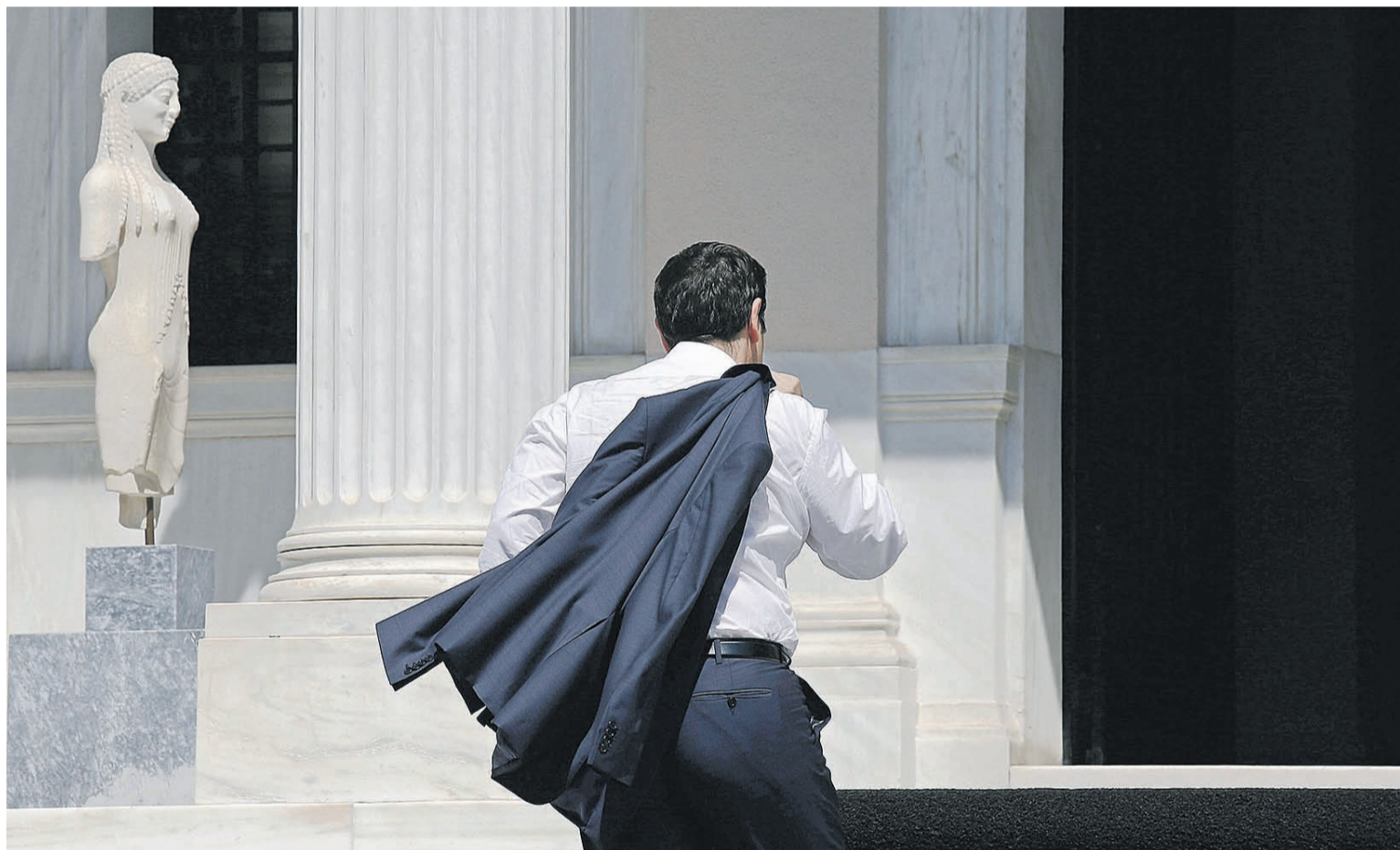
Премьер-министр Греции Алексис Ципрас не смог добиться даже частичного списания долга своей страны