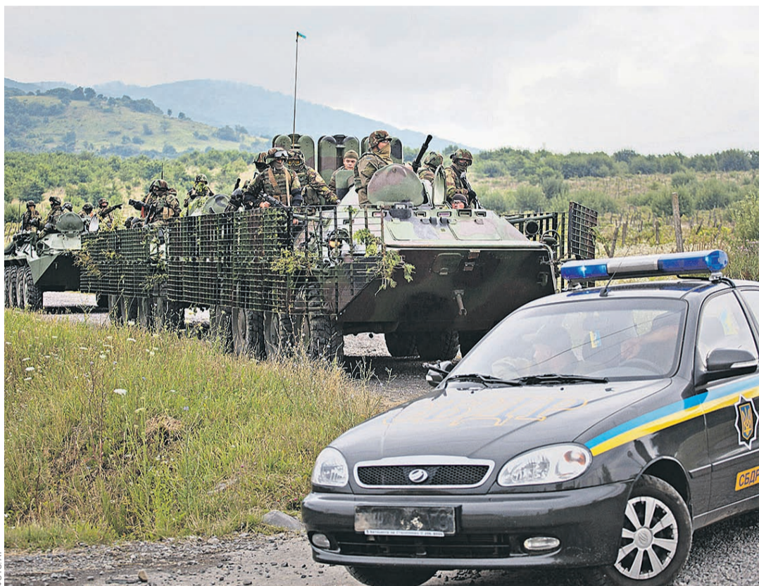
В понедельник в Мукачево украинские военные и полицейские продолжали поиски скрывающихся бойцов «Правого сектора»