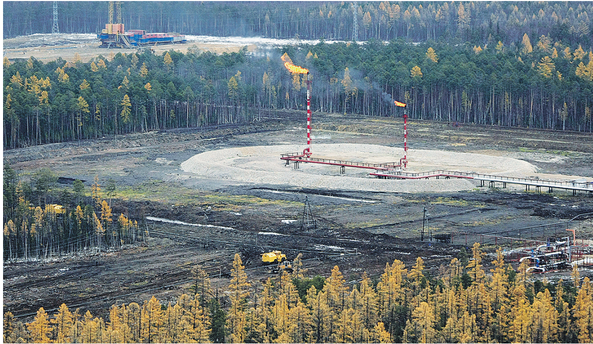
Мимо Борулахского участка проходит нефтепровод «Восточная Сибирь — Тихий океан», по которому нефть направляется в Китай и другие азиатские страны