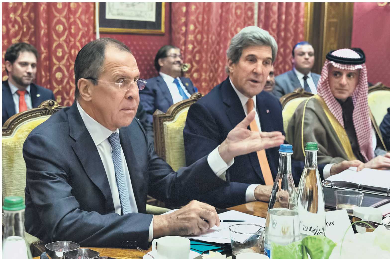
Заседание в Лозанне должно было стать попыткой спасти перемирие в Сирии, о котором глава МИДа Сергей Лавров (слева) и госсекретарь США Джон Керри с трудом договорились в начале осени

БЛИЖНИЙ ВОСТОК Что обсудят дипломаты после встречи по Сирии в Лозанне