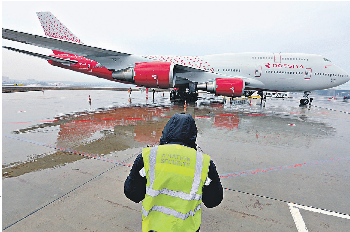
По данным ФАС, авиакомпания «Россия» занимает третье место среди авиаперевозчиков в России с долей рынка 9,8%. За январь—август 2016 года она перевезла 5,12 млн человек