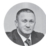
Герман Елянюшкин Правительство Московской области