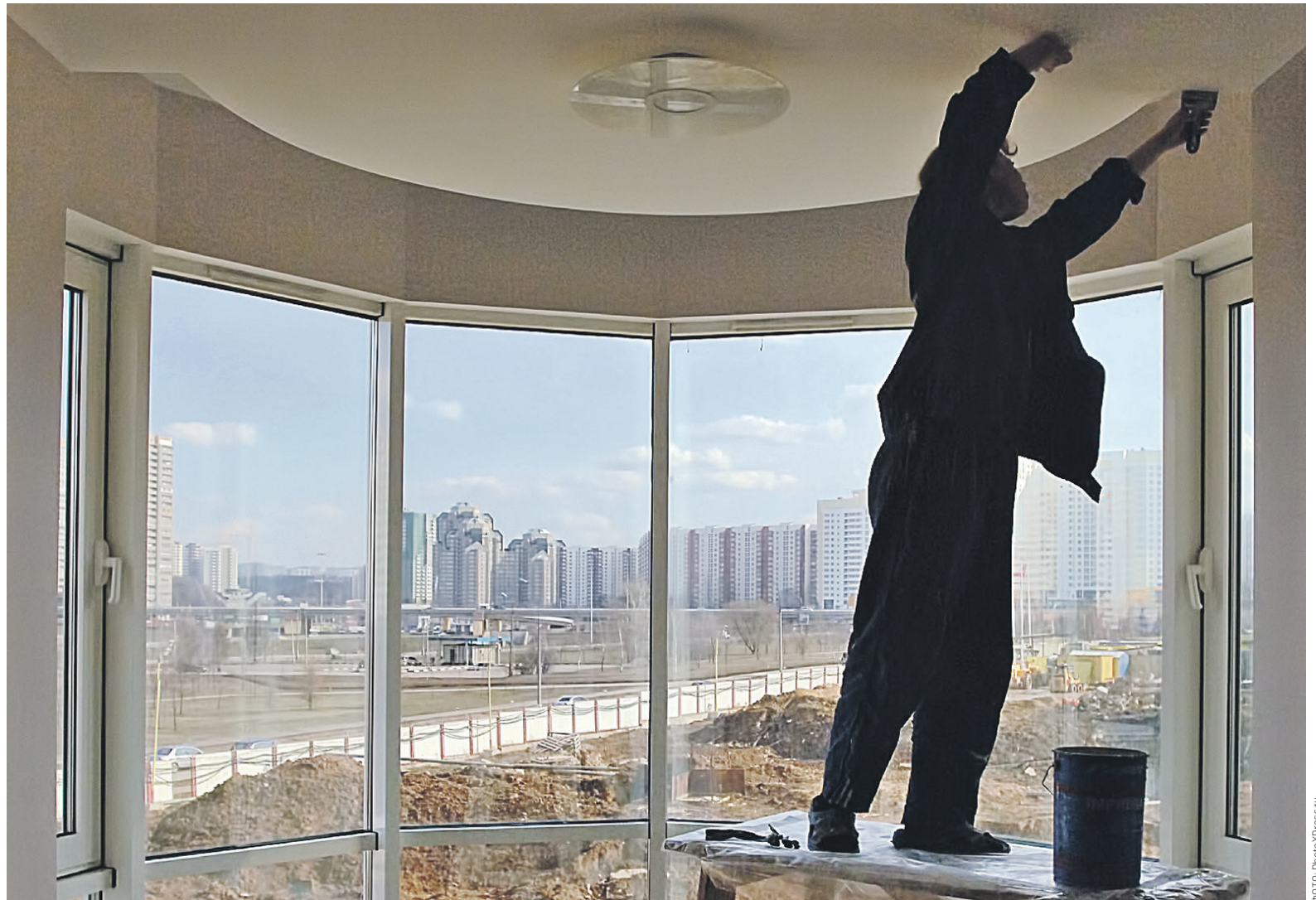
Среди предложений в разделе «Домашний оператор» на сайте МГТС — мытье люстр, химчистка дивана, снятие штор, генеральная уборка и другие услуги

Основанная в 1882 году МГТС изначально специализировалась на телефонии и долгое время являлась монополистом столичного рынка. В 1990-х годах у компании появились конкуренты на рынке фиксированной телефонии, к 2000-м годам абоненты стали отказываться от услуг подобных операторов, предпочитая пользоваться мобильной связью. В итоге выручка МГТС от традиционного для нее направления начала снижаться. По итогам первого полугодия 2016 года этот показатель составил 8,665 млрд руб. (в сегментах физлиц, юрлиц и бюджетных организаций), что на 8% ниже, чем в том же периоде 2015-го.