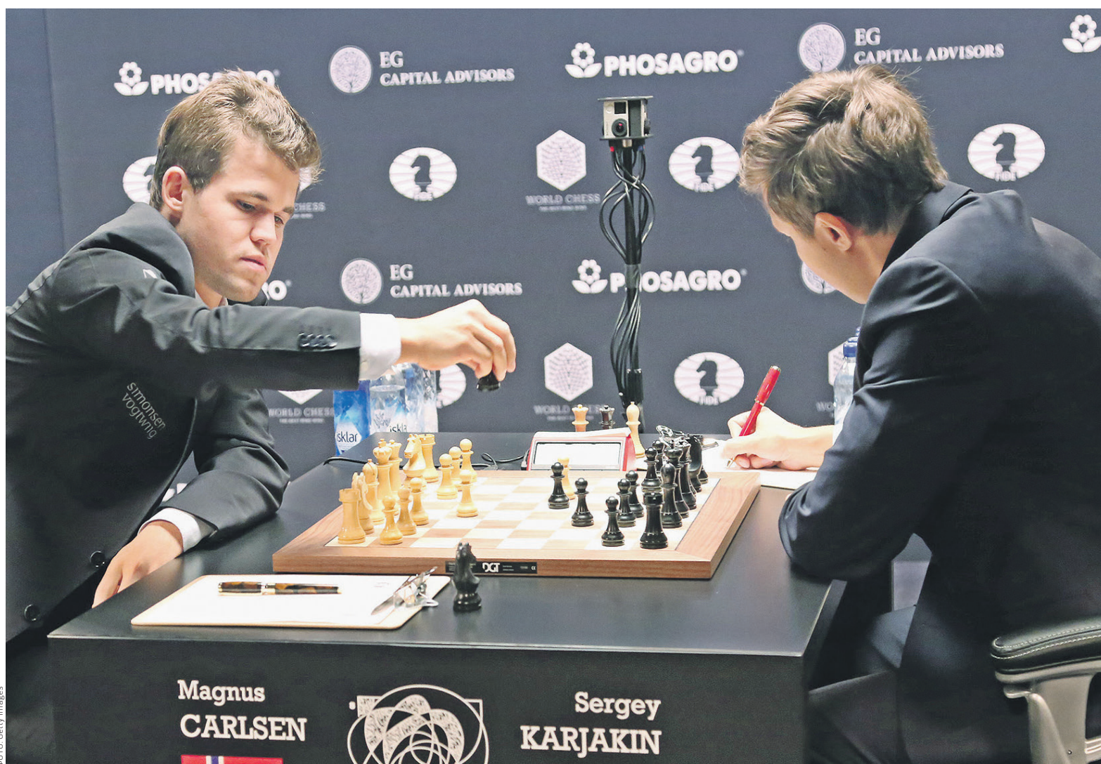
Организаторы решили максимально использовать потенциал зрительского интереса и превратили матч за шахматную корону между Карякиным и Карлсеном в настоящее интерактивное шоу

Место, в котором проходит матч, находится в районе South Street Seaport — на юге Нижнего Ист-Сайда, в одном из самых престижных районов города. В здании Fulton Market Building специально для встречи Карлсена и Карякина был организован не только зал, в котором разыгрываются партии, но также построены телевизион-