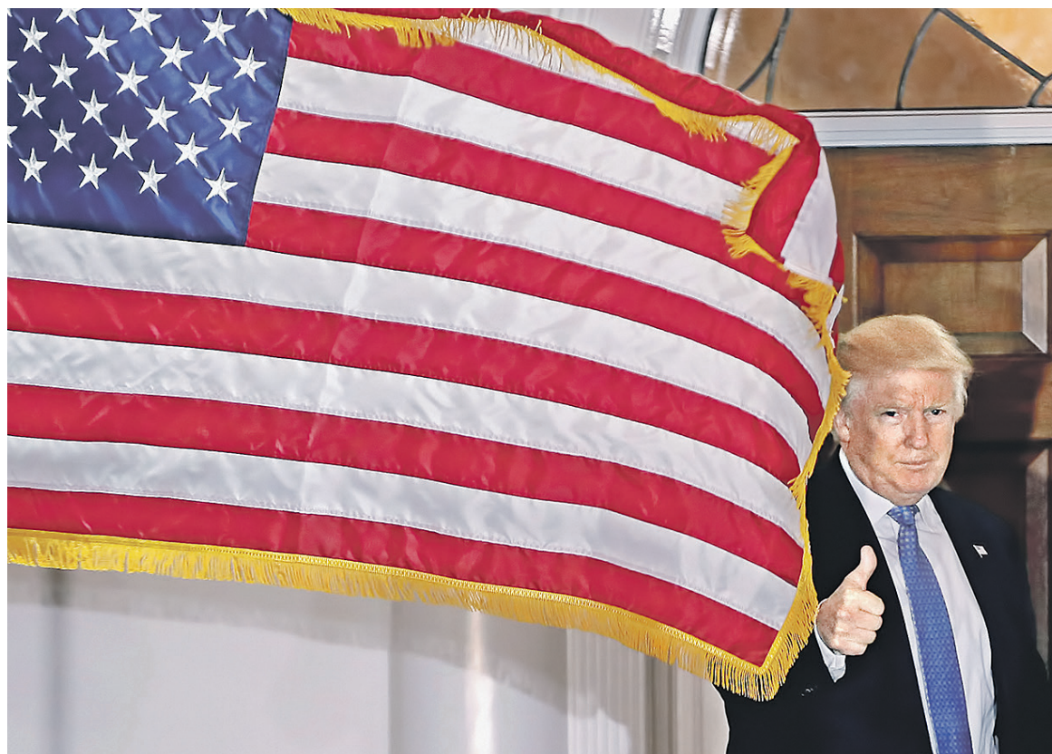
Администрация Трампа будет вести дела с государствами, многие из которых связаны с бизнес-интересами нового президента США и его семьи

Долги компаний Трампа составляют не менее $650 млн — вдвое больше, чем можно увидеть из предвыборных деклараций его штаба, и среди кредиторов есть иностранные банки, вклю-