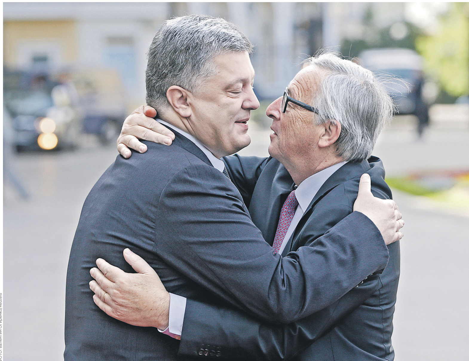
Жан-Клод Юнкер (справа) выразил Петру Порошенко обеспокоенность темпом борьбы с коррупцией на Украине. «Если вы не уничтожите коррупцию, инвесторы не придут на Украину», — заявил Юнкер

На итоговой пресс-конференции представители Евросо-