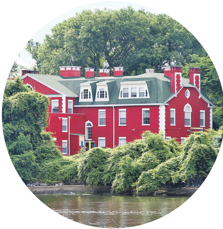
Российская дача в штате Мэриленд, расположенная в 100 км от Вашингтона

Согласно Венской конвенции, дипломатическая собственность того или иного государства в стране пребывания неприкосновенна. «Помещения представительств, предметы их обстановки и другое находящееся в них имущество, а также средства передвижения представительств пользуются иммунитетом от обыска, реквизиции, ареста и исполнительных действий», — говорится в ст. 22 Венской конвенции.