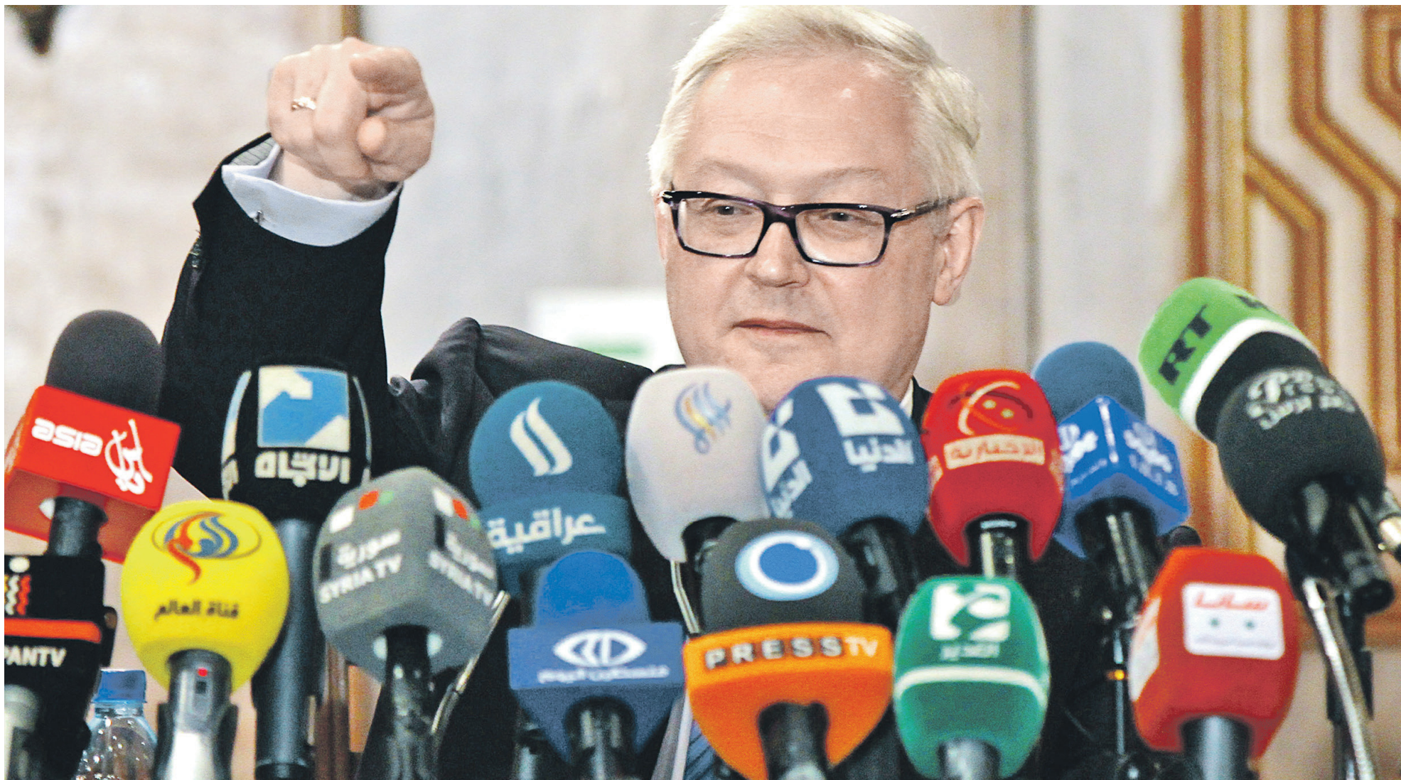
Сергей Рябков (на фото) после встречи с Томасом Шэнноном использовал слово «почти», чтобы описать результаты переговоров