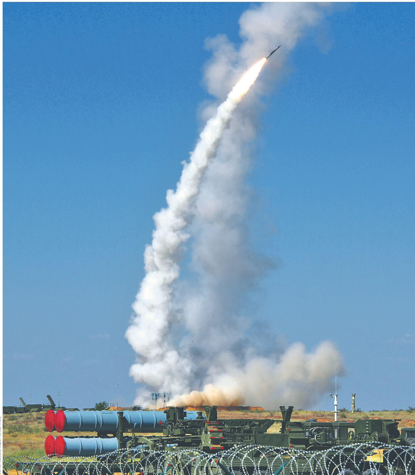
Российский ракетный комплекс С-300 (на фото) существенно укрепит боевые возможности сирийской ПВО, считают в Министерстве обороны

Обладая высокой помехозащищенностью и скорострельностью, комплекс существенно укрепит