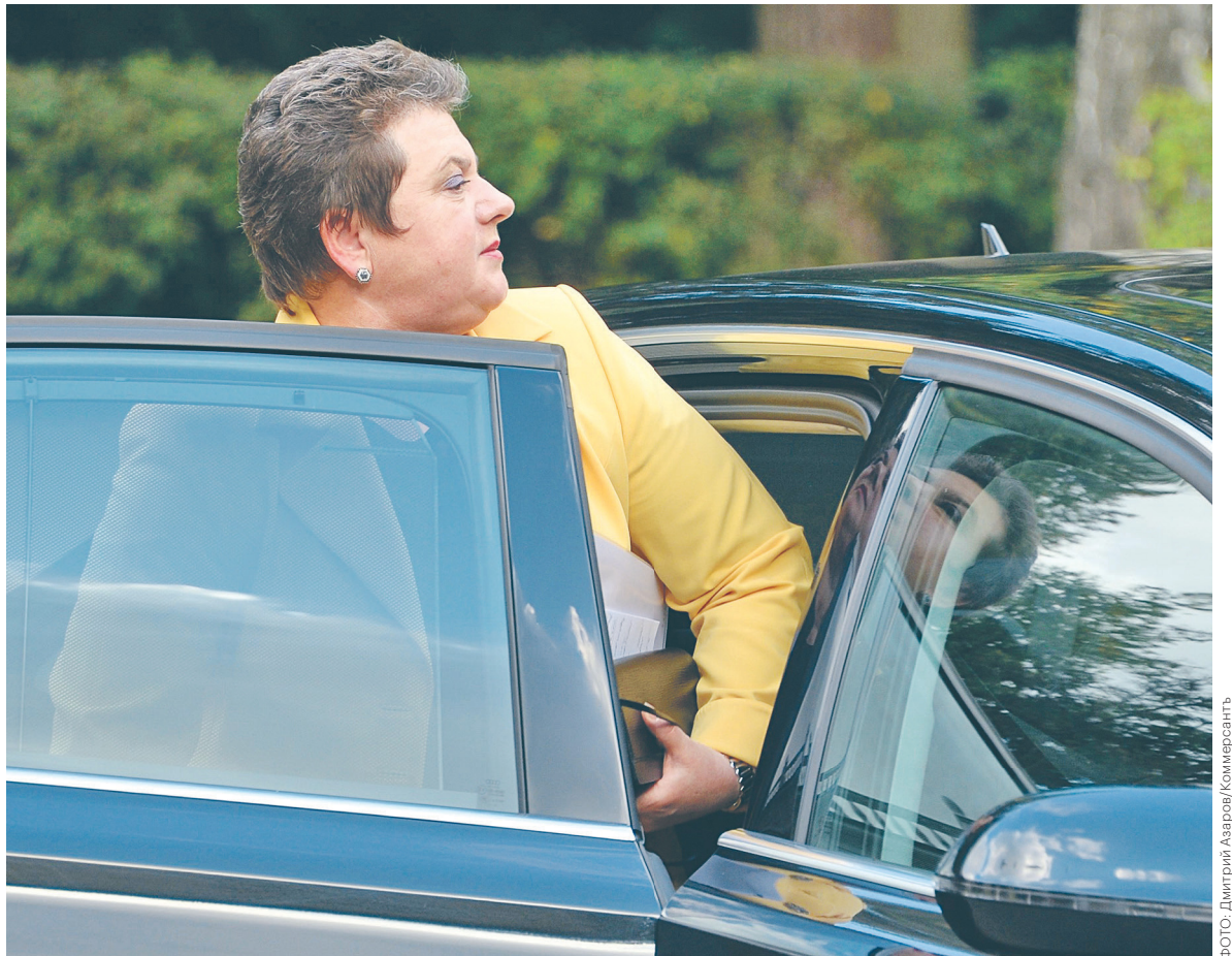
Манера общения экс-губернатора Светланы Орловой встретила во Владимирской области решительное неприятие

По итогам фокус-групп, которые проводились перед вторым туром, можно было сделать вывод о трех основных претензиях жителей к губернатору: «Она не сумела стать своей; ужасное экономическое состояние региона; поведение Орловой — своей манерой