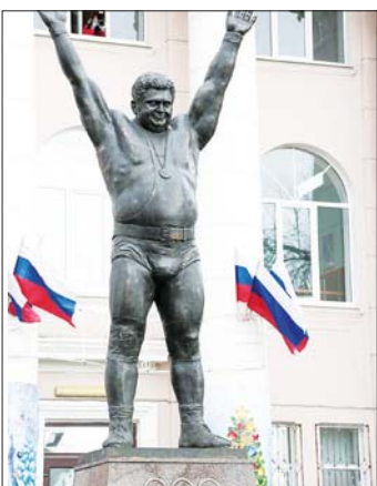
Памятник Василию Алексею — самому сильному человеку планеты.