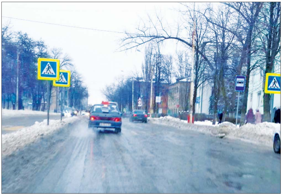
По улице Советской текут коммунальные реки.