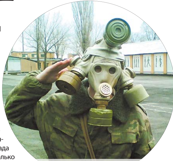
Психическую атаку выдерживали не все.