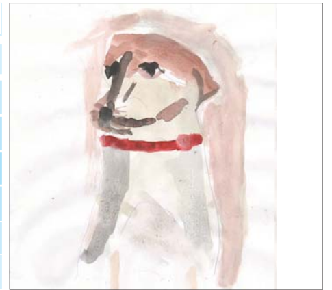
Рисунок Десятова Максима, 6 лет, д.сад 80.

Прогноз погоды в №9 «КВУ» будет представлять рисунок Колесник Маши, 4 года, д.сад 22.