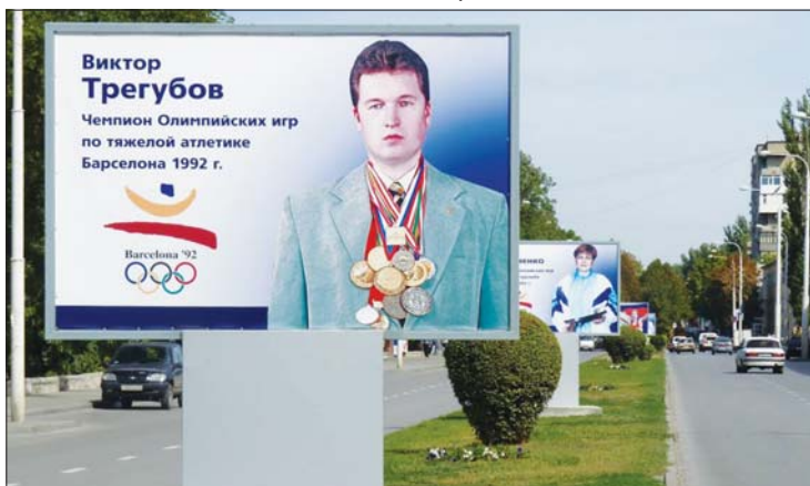
Аллея Олимпийских чемпионов находится в центре города.

Итак, ждем лета и пишем список интересных мест, достопримечательностей города Шахты, которые обязательны к посещению.