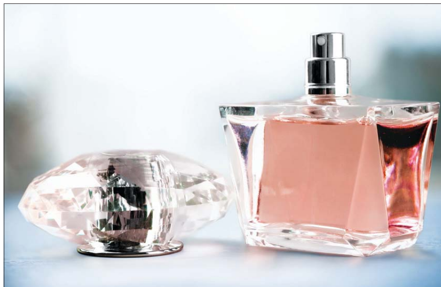
Выбор парфюма дело непростое во всех отношениях.

Наличие Знака Таможенного союза «ЕАС» означает, что косметика прошла оценку соответствия техрегламентам.