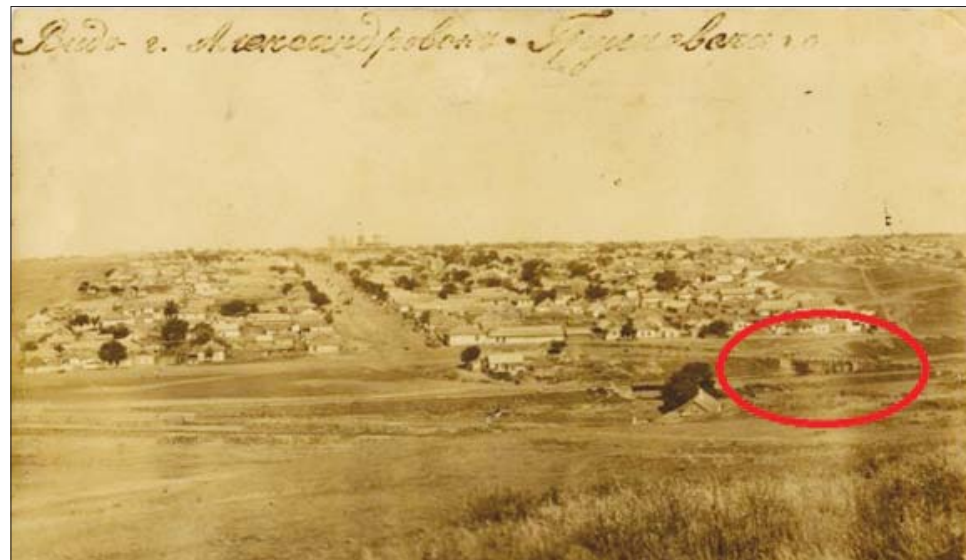
Мост через Грушевку на старинной открытке.

Интересно, что южные славяне считали грушу «святым деревом». Она почиталась у болгар, словаков и сербов. В Сербии груша, под которой молились, заменяла церковь. Ее сажали возле придорож-