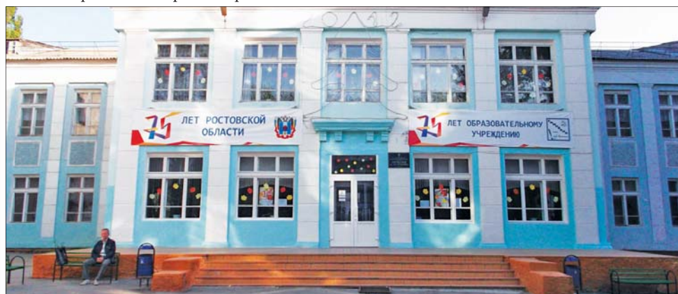
В гимназии № 2 отменили занятия из-за проверки электрохозяйства.