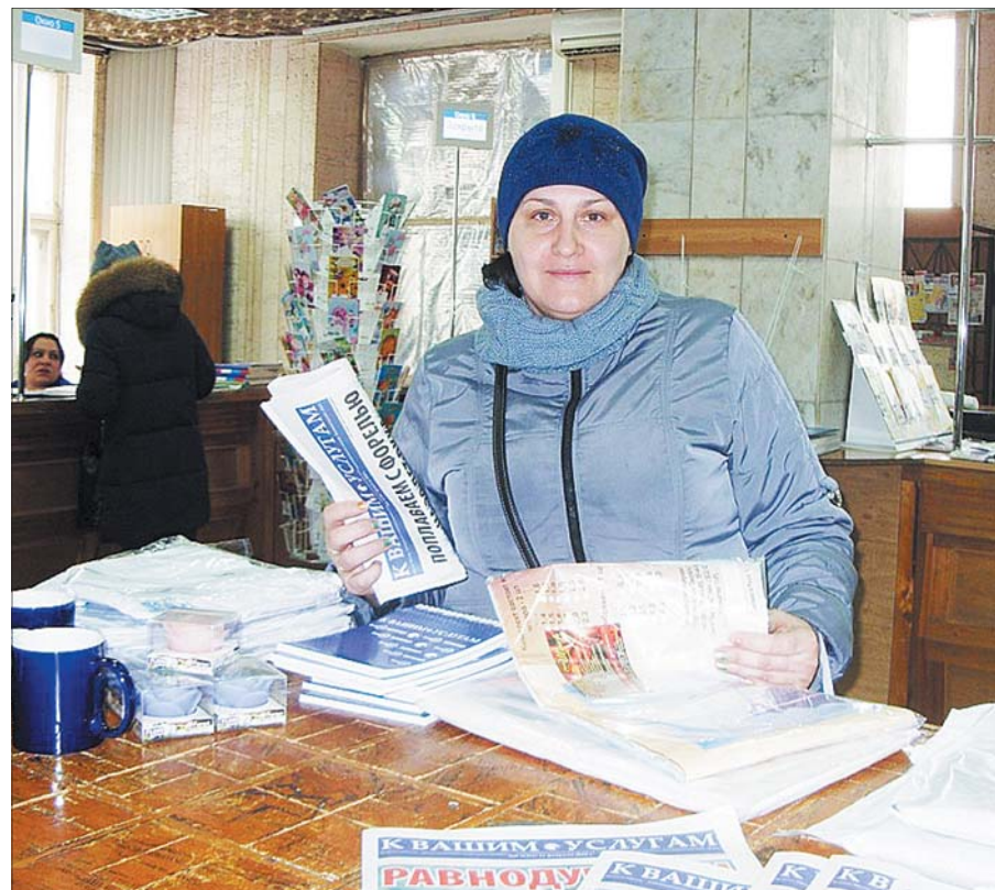
Наша газета порадовала своих подписчиков приятными подарками.