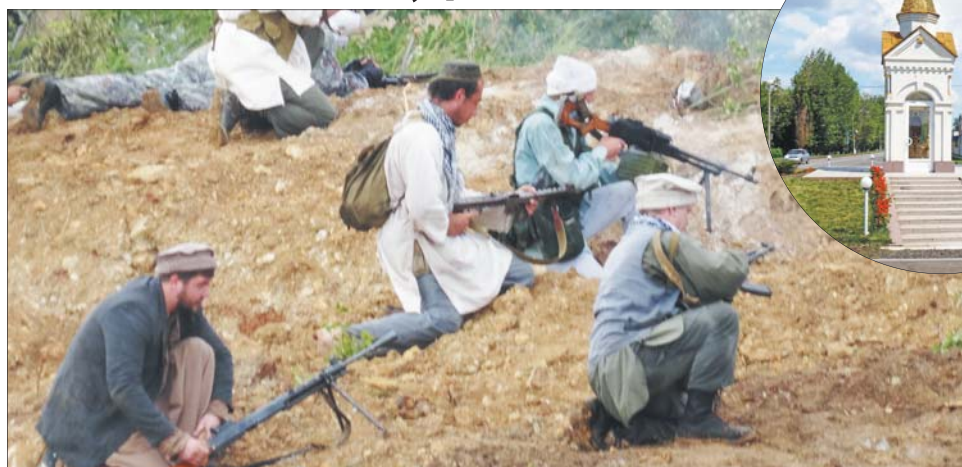
Реконструкция боя времен афганской войны.