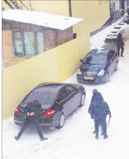
Руки за спину! Лицо на капот!

В центре города Шахты в результате спецоперации были задержаны опасные преступники.