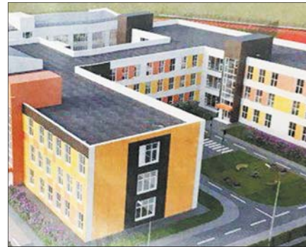
Так будущая школа выглядит на проекте.