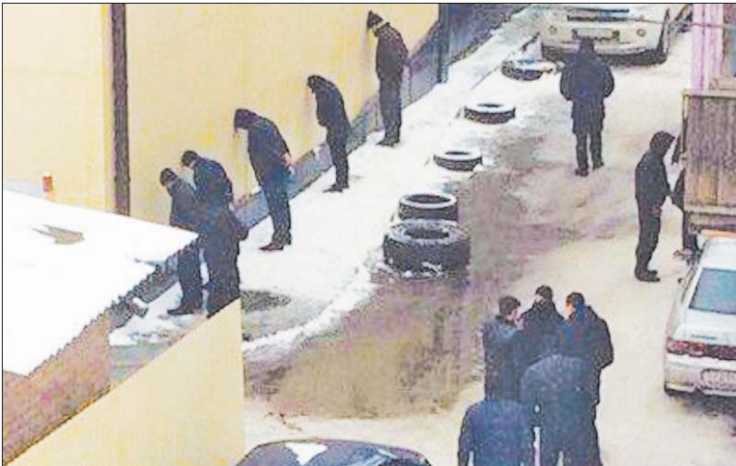
Задержание происходило во дворе офисных зданий по пр. Победа Революции.