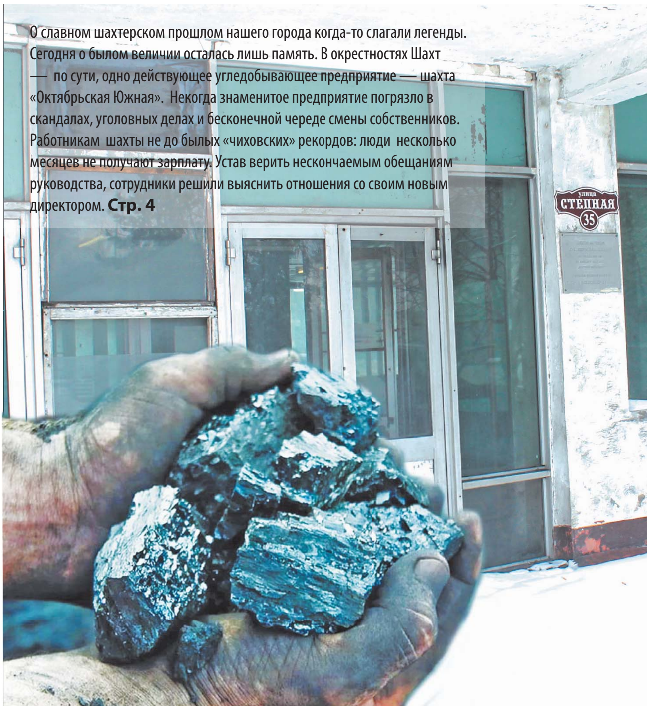
Коллаж Светланы Мокроусовой.

О славном шахтерском прошлом нашего города когда-то слагали легенды. Сегодня о былом величии осталась лишь память. В окрестностях Шахт — по сути, одно действующее угледобывающее предприятие — шахта «Октябрьская Южная». Некогда знаменитое предприятие погрязло в скандалах, уголовных делах и бесконечной череде смены собственников. Работникам шахты не до былых «чиховских» рекордов: люди несколько месяцев не получают зарплату. Устав верить нескончаемым обещаниям руководства, сотрудники решили выяснить отношения со своим новым директором. Стр. 4