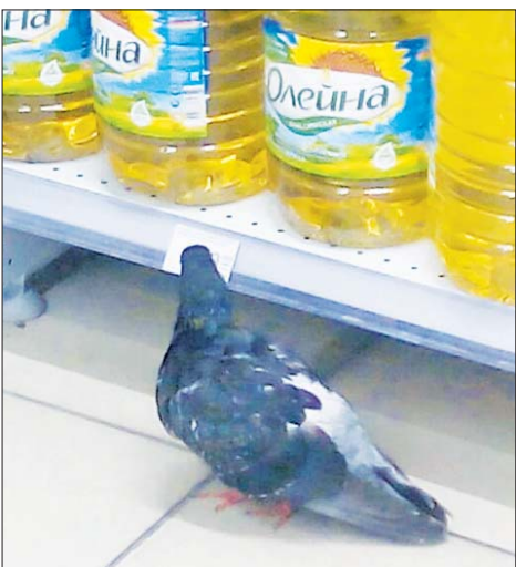
В магазине посёлка ХБК поселился живой голубь.

Голубь мирно курсировал между прилавками с продуктами и ничуть не смущался посетителей торговой лавки. Видимо, продавцы, жалеют птицу, и не выгоняют её на мороз.