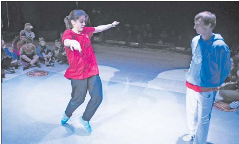
Участники региональных баттлов «King of the dance».