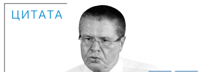
Вопрос об освобождении от налогообложения средств, получаемых банками в рамках докапитализации через облигации федерального займа, нужно решить в течение ближайшего времени

В пятницу Ассоциация российских банков (АРБ) получила письмо Минфина, разъясняющее порядок налогообложения при докапитализации банков через ОФЗ (есть в распоряжении „Ъ“).