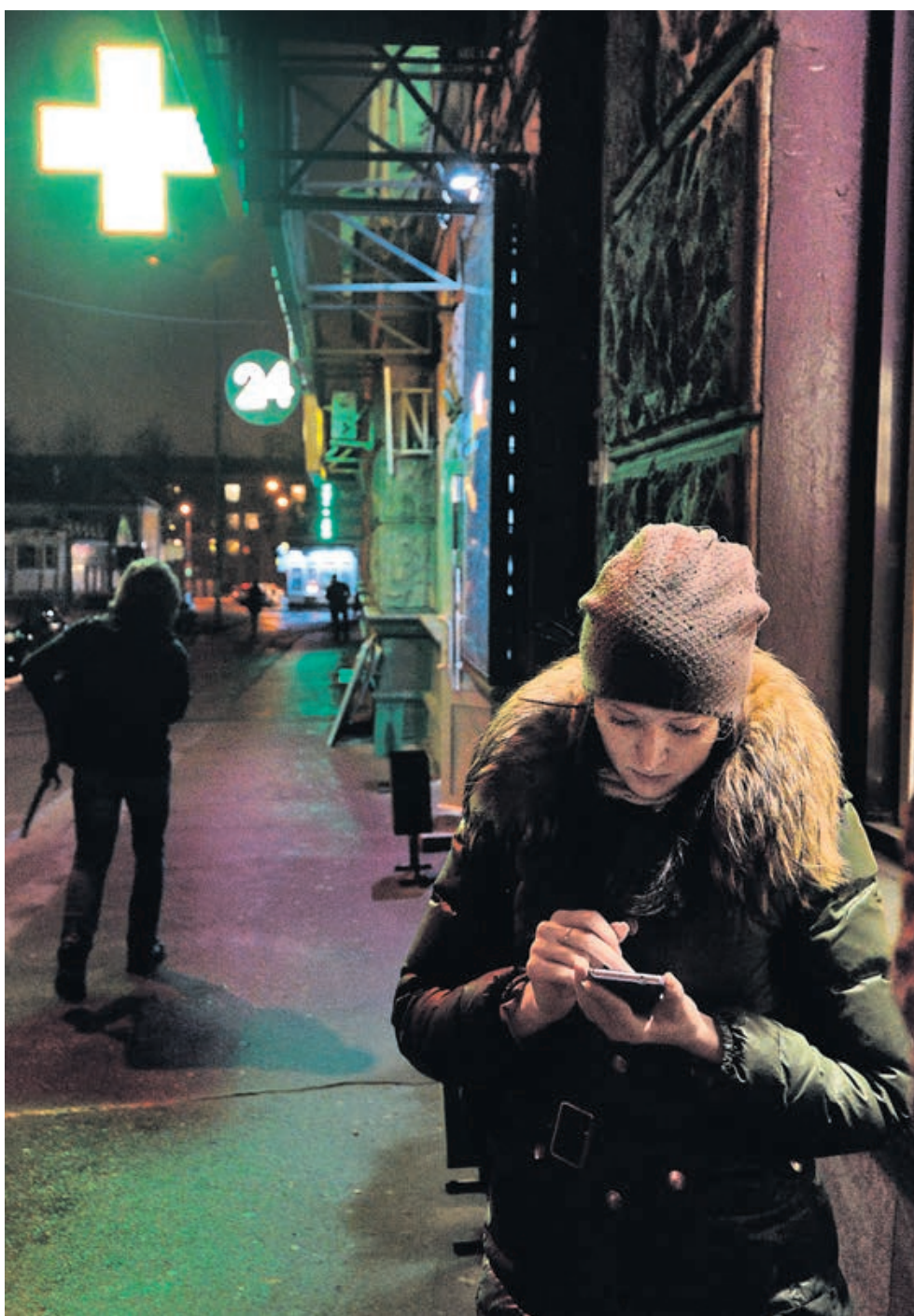
Магазины и аптеки, расположенные на первых этажах жилых домов, с 1 июля могут перестать работать по ночам.

Новые требования к СНИП «Здания жилые многоквартирные» были утверждены постановлением правительства РФ 26 декабря 2014 года. Согласно документу, с 1 июля 2015 года «в цокольном, первом и втором этажах жилого здания не допускается размещать все предприятия, а также магазины с режимом функционирования после 23 часов». Ранее эта норма СНИ-