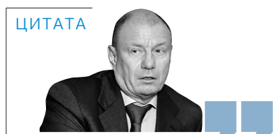
Выплата дивидендов с налоговой точки зрения более выгодна государству — Владимир Потанин, глава «Интерроса», гендиректор «Норильского никеля», 23 января

в компании. Свободный денежный поток Evraz в 2014 году составил $1,1 млрд, на конец года на счетах лежало свыше $1 млрд.