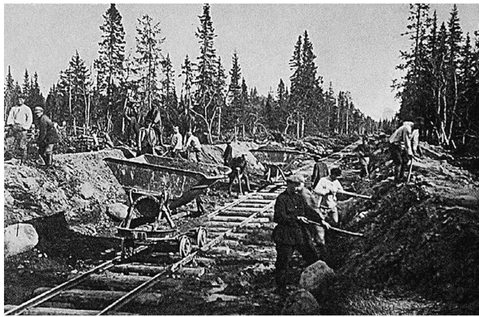
В СССР заключенных не спрашивали, где они хотят работать. Но стимулы трудиться у них тоже были

Вчера, выступая в рамках питерского экономического форума, глава Минэкономразвития Алексей Чекунков заметил, что смысл лишения свободы около полумиллиона человек в России «заключается в том, чтобы реабилитироваться». «Если у людей будет опция иметь работу, которую они добровольно будут считать интересной и выгодной для себя, в том числе с точки зрения оплаты, и это будет полезная деятельность для экономики, я думаю, что эта инициатива имеет право на жизнь», — отметил министр. Он допустил, что такую работу можно использовать для обработки миллионов гектаров некультивируемой земли. «Это тяжелый труд, нужно пни выкорчевывать, каналы рыть», — цитирует господина Чекункова «РИА Новости». — Вот один при-