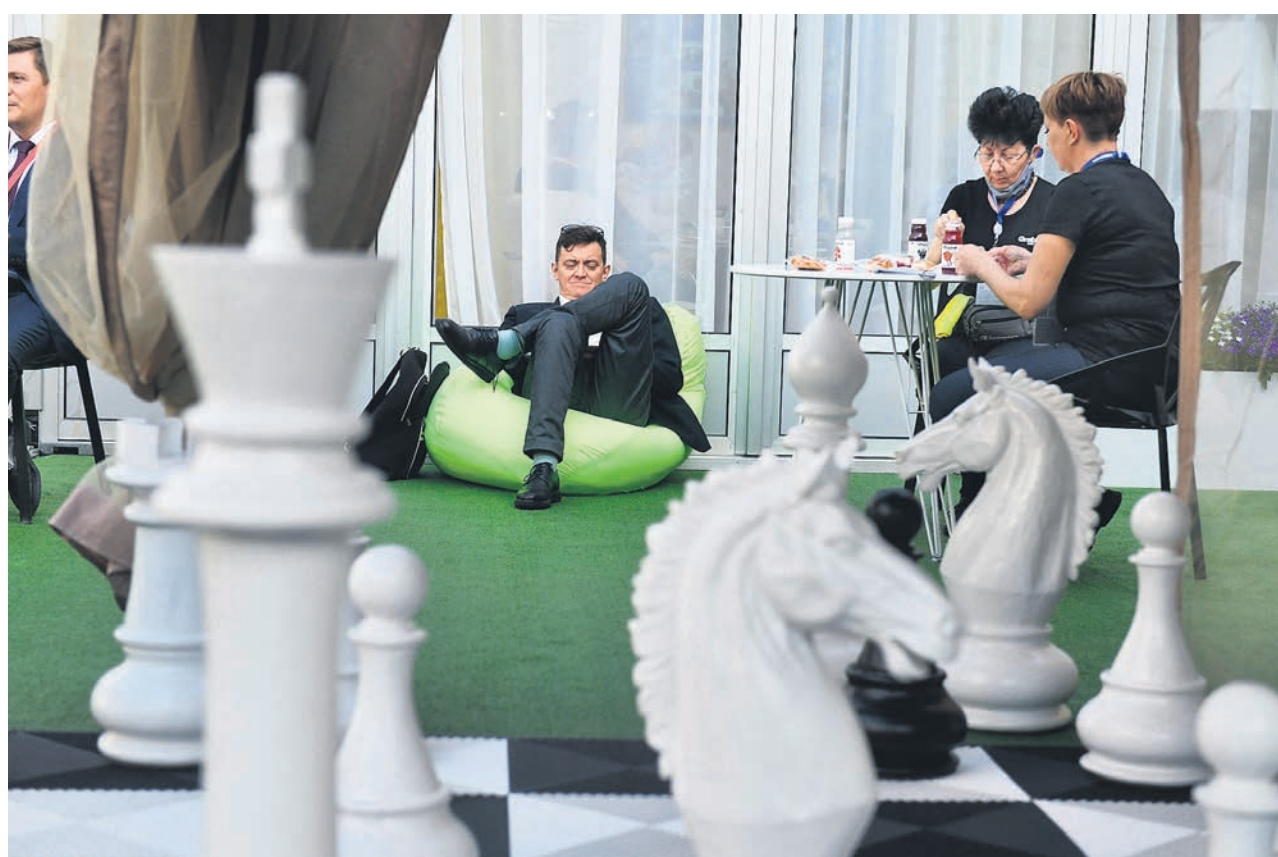
Зеленая повестка оказалась способна увлечь и бизнес, и госуправление основных экономик мира, теперь к ней примеривается и Россия.

Главный годовой экономический форум фонда «Росконгресс», ПМЭФ, официально открылся в Санкт-Петербурге вчера, хотя его деловая программа началась еще 2 июня (мероприятия продлятся до 5 июня). Традиционно первый официальный день начался с макроэкономических и правительственных дискуссий и подписания пакета крупных инвестсоглашений. Во второй день президент Владимир Путин (форум, напомним, имеет статус «президентского»), а хотя на нем работают представители Белого дома, председатель пра-