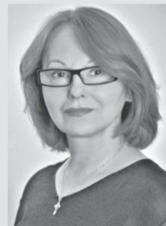
Михаил ФРОЛОВ/«КП» - Москва

родилась в 1960 г. в г. Запорожье; окончила филологический факультет Запорожского университета (специальность «русский язык и литература»); в журналистике с 1983 г., работала в молодежной газете заведующей отделом, обозревателем, в 1987 г. стала лауреатом премии «Золотое перо Украины»; работала в сочинских газетах; в 2001 г. стала собственным корреспондентом «Комсомольской правды» в Сочи; в 2003 г. приглашена на работу в Москву, в отдел внутренней и международной политики «КП»; с 2003 г. - в президентском, а затем и в правительственном журналистском пуле; в 2008 г. отмечена благодарностью Президента Российской Федерации В. В. Путина «За активную работу по развитию институтов гражданского общества в России».