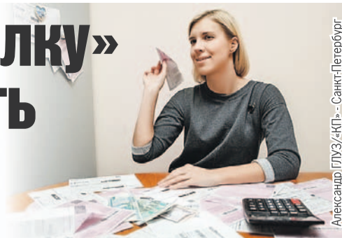
Александр ГЛУЗ/«КП» - Санкт-Петербург