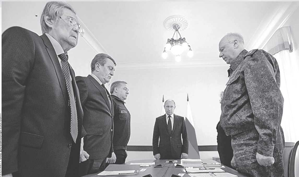
Последняя встреча губернатора Тулеева (на снимке крайний слева) с Владимиром Путиным состоялась 27 марта, когда президент прилетел в Кемерово после страшного пожара в торговом центре «Зимняя вишня». На встрече также присутствовали полпред президента в Сибирском федеральном округе Сергей Меняйло (второй слева), глава МЧС Владимир Пучков (третий слева) и председатель Следственного комитета Александр Бастрыкин (справа).

Но вот в 2016 году случился слом системы: в июле администрация Кемеровской области стала «работать» с собственником разреза «Инской», у которого две смены