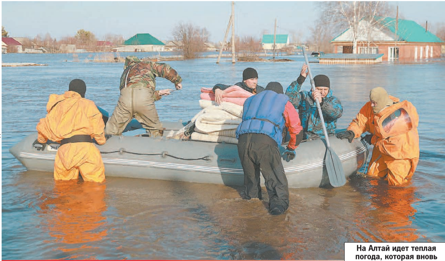
На Алтай идет теплая погода, которая вновь спровоцирует повышение уровня воды в реках.