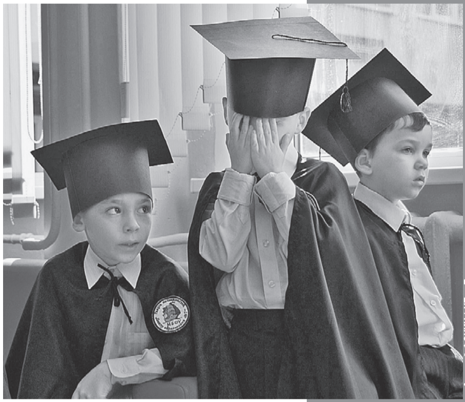
Может, это последнее фото, на котором школьники в ужасе от оценки.

А выглядит она, например, так (цитирую дословно): «Оценка: прочитала эпизод из рассказа «Лошадина фамилия». Достижения: чтение эмоциональное и выразительное. Смогла выбрать интерес-