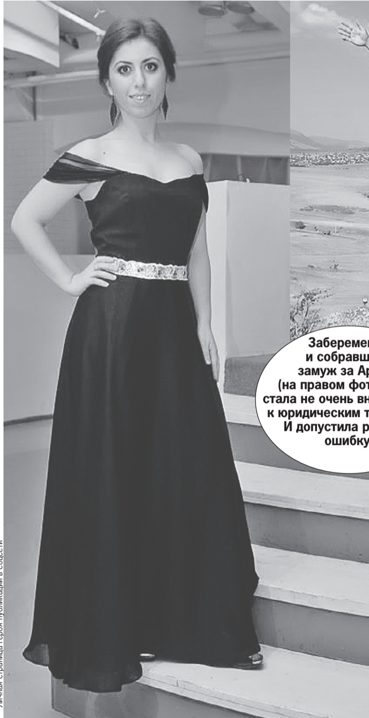
Личная страница героя публикации в соцсети