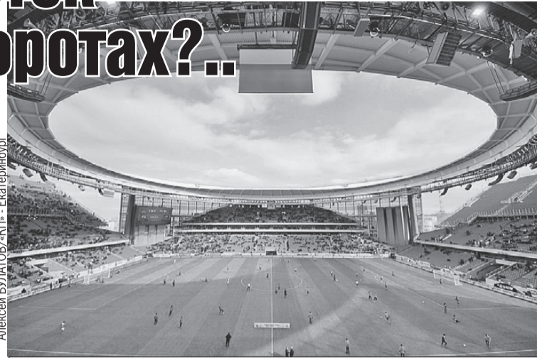
На ЧМ-2018 арена в Екатеринбурге будет вмещать 35 тысяч зрителей. А потом часть мест демонтируют.

До ЧМ-2018 в России еще должны успеть открыть полдюжины крутых стадионов. «Урал» провел первый матч на том, что построили в Екатеринбурге. ТВ-картинка с него просто отличная. Но проблемы, как рассказывают болельщики, тоже были: на арене не успели органи-