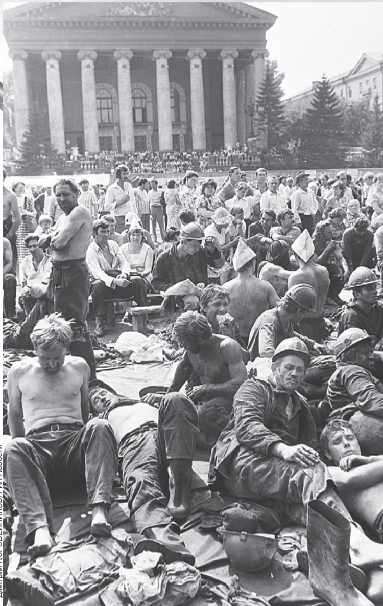
Когда Тулеев возглавил Кузбасс, бастующие шахтеры на центральной площади Кемерова были обычной картиной.

что эти фото - старые, годовой давности, когда сибирского казаха почти одолел сахарный диабет, а теперь Тулеев - сухонький и седой.)