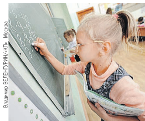
Владимир ВЕЛЕНТУРИН/«КП» - Москва

Подробности читайте на > страницах 3, 6-7.