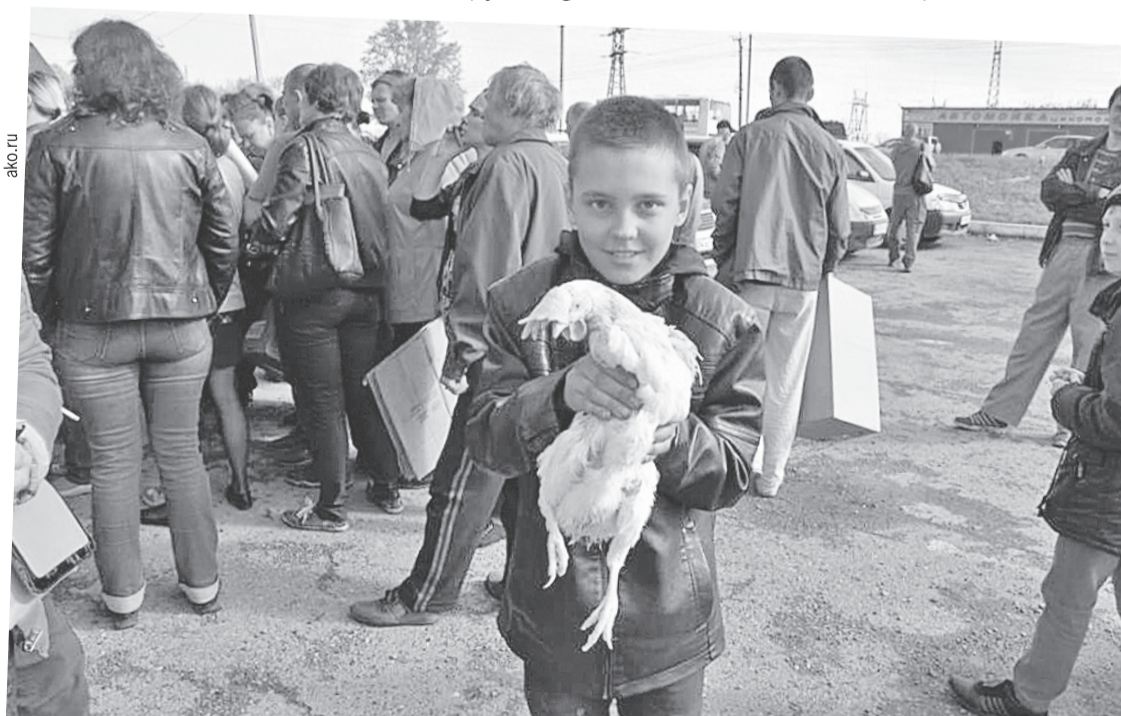
В город Юрга привезли кур для раздачи. Такие бесплатные «подарки от Тулеева» случались в населенных пунктах области чуть ли не каждый месяц.

...Пойду положу гвоздику на тумаскамейку в знак окончания эпохи Амангельды Тулеева.