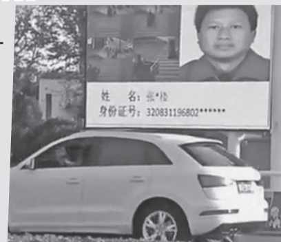
Перед автоматическими камерами наблюдения все равны. Нарушил - добро пожаловать на доску позора.

Да и «автонаказание за переход на красный свет» не новость: еще в 2017 году об этом китайском почине писали западные