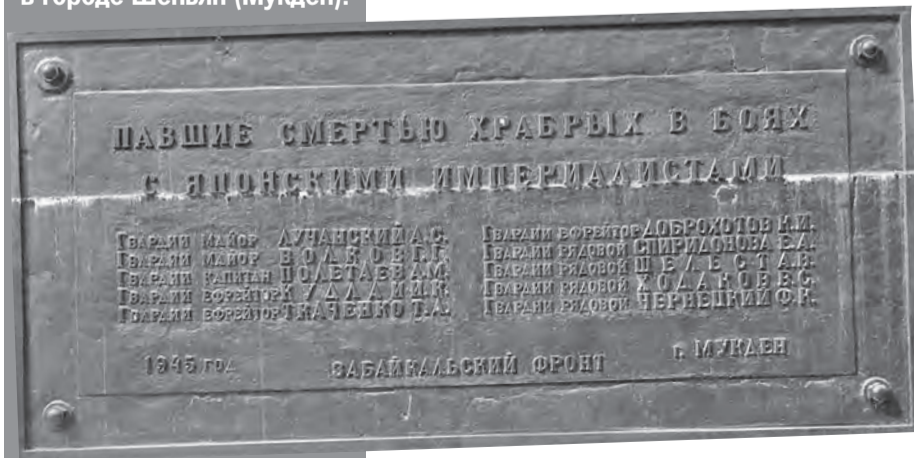
Эдвард ЧЕСНОКОВ/«КП» - Москва

Китай - одна из немногих стран экс-соцлагеря, где за нашими воинскими захоронениями до сих пор ухаживают. Это фото снято на мемориале в городе Шеньян (Мукден).