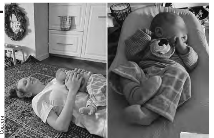
...прошло двадцать с лишним лет. Теперь Оля - взрослая девушка и счастливая мама малышки Любы.