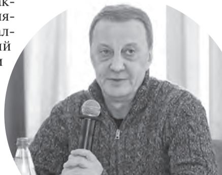
Мэр Вячеслав Франк предложил провести еще одну встречу, чтобы обсудить идеи более предметно.

- Я пробовала работать в Питере, Москве и в итоге вернулась в Барнаул. Для жизни это очень комфортный город. Здесь меньше тратишь времени на перемещения, ниже себестоимость проживания. Для меня видимая точка роста - превратить этот город в комфортный для проживания «удаленщиков», фрилансеров, авторов видеокурсов, онлайн-тренеров - инфоцыган по сути.