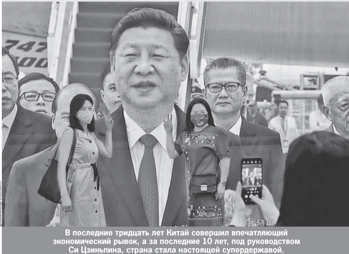
В последние тридцать лет Китай совершил впечатляющий экономический рывок, а за последние 10 лет, под руководством Си Цзиньпина, страна стала настоящей супердержавой.

когда сам был подростком, 20 лет назад, - рассказывает знакомый бизнесмен из Поднебесной. - Стал читать его биографию. И меня поразил один факт. В конце девяностых у экс-мэра Петербурга Анатолия Собчака (под его началом некогда работал Путин ) начались проблемы, он заболел. И Путин, рискуя карьерой, помог ему вылететь на лечение за границу. В нашей культуре такое ценится - верность слову, лояльность руководителю, даже если тот угодил в опалу.