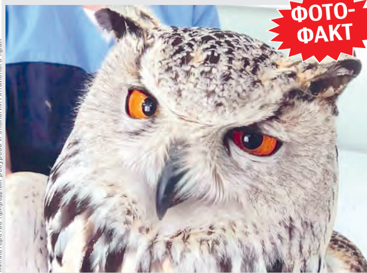
Министерство природных ресурсов и экологии Алтайского края

Сначала косолапые едят труху деревьев для активации пищеварительного тракта, а затем охотно ищут останки павших за зиму животных, прошлогодний кедровый орех и первую зелень.