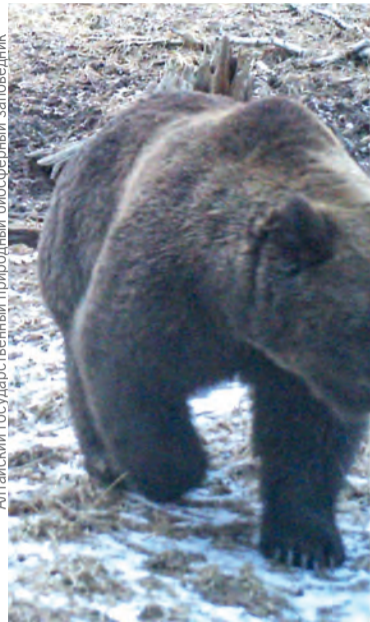
Алтайский государственный природный биосферный заповедник

ведь прошел перед камерой фоторегистратора 20 марта. В последующие годы фотоловушки фиксировали появления косолапых гораздо позже.