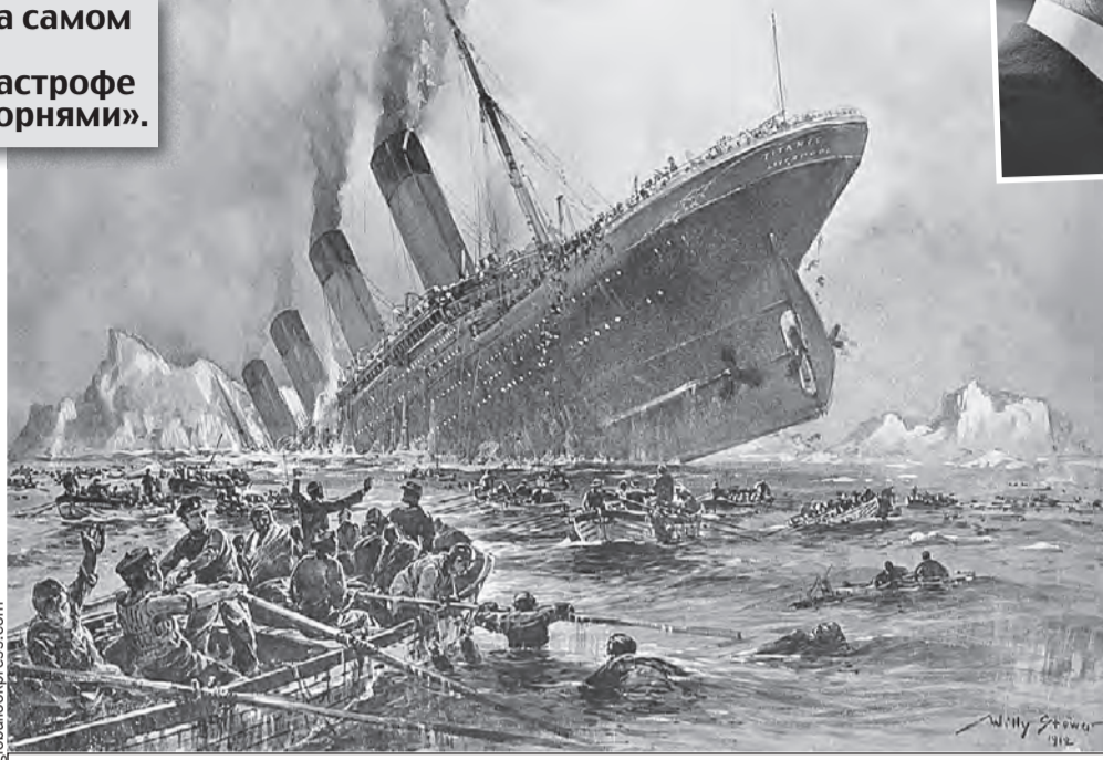
Лайнер затонул более ста лет назад, и это тоже умудрились повесить на русских.

- Я начал искать первоисточник. Оказалось, некий польский сайт 26 февраля написал, будто британский ученый нашел архивные до-