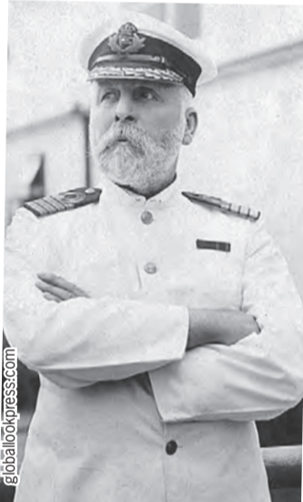
Капитан Эдвард Джон Смит, вероятно, сильно удивился бы открытию «британского ученого».

кументы, в которых говорится, что дед капитана Смита эмигрировал из Российской империи в 1812 году в Великобританию. Начнем с того, что это не британский ученый, а американский, - рассказал «КП» писатель-историк, исследователь «Титаника» Евгений Несмеянов. - Даже если предположить, что у капитана Смита кто-то из родственников эмигрировал из Российской империи, то он явно не был русским. Эмигрировали в то время меньшинства. Смит был британским капитаном, он учился в Великобритании, получил британскую подготовку, капитанский диплом ему был выдан в Англии. И он действовал, сообразуясь с навигационными практиками, принятыми в Великобритании. Поэтому это полностью британская история. Русскими корнями тут даже и не пахнет.