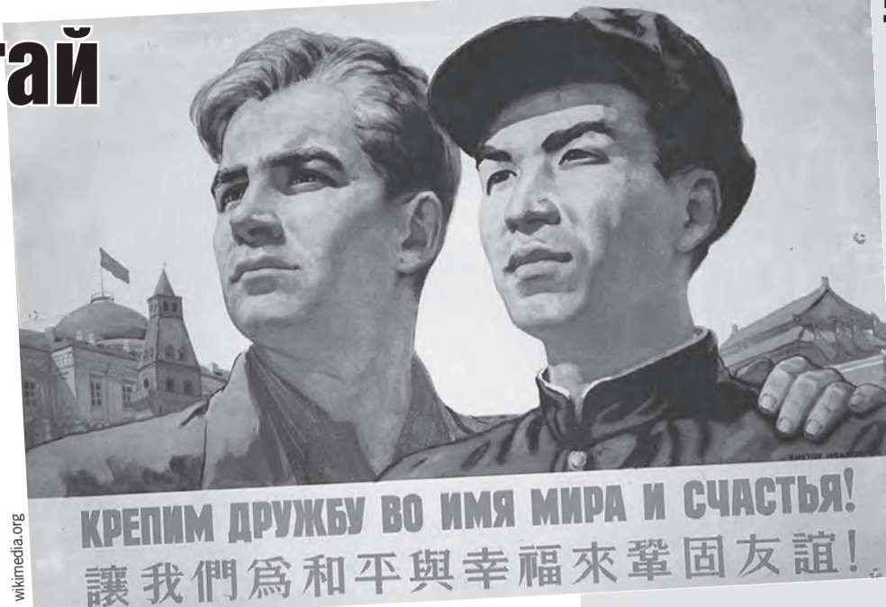
Плакат 50-х годов прошлого века становится актуальным и в наши дни.

Тон нынешнему визиту зададут статьи Путина и Си, которые опубликованы в «Российской газете» и «Жэньминь жибао». В них оценивается уровень отношений наших стран, ставятся задачи на ближайшую перспективу. Все три дня пребывания китайского гостя в Москве будут посвящены переговорам на различных уровнях. Начнутся они с личной беседы глав государств, которая, как ожидается, займет продолжительное время. Как сообщил помощник Президента РФ по международным вопросам Юрий Ушаков, серьезное внимание в ходе контактов планируется уделить вопросам энергетики и военно-технического сотрудничества. Состо-