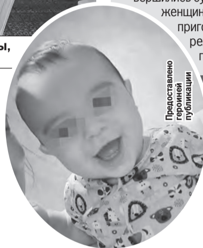
Представлено героиней публикации

Красноярские суды уже выносят первые решения по данному делу. К примеру, медсестру из Красноярского центра материнства и детства оштрафовали на 30 тысяч рублей. Как установили следователи, женщина вписала в три свидетельства о рождении гражданок КНР, а не истинных рожениц. Также завершили суды над некоторыми сурмамами. Трех женщинам дали условный срок, а еще одну приговорили к 3 годам колонии общего режима. Совладельцы фирмы до сих пор находятся под домашним арестом.