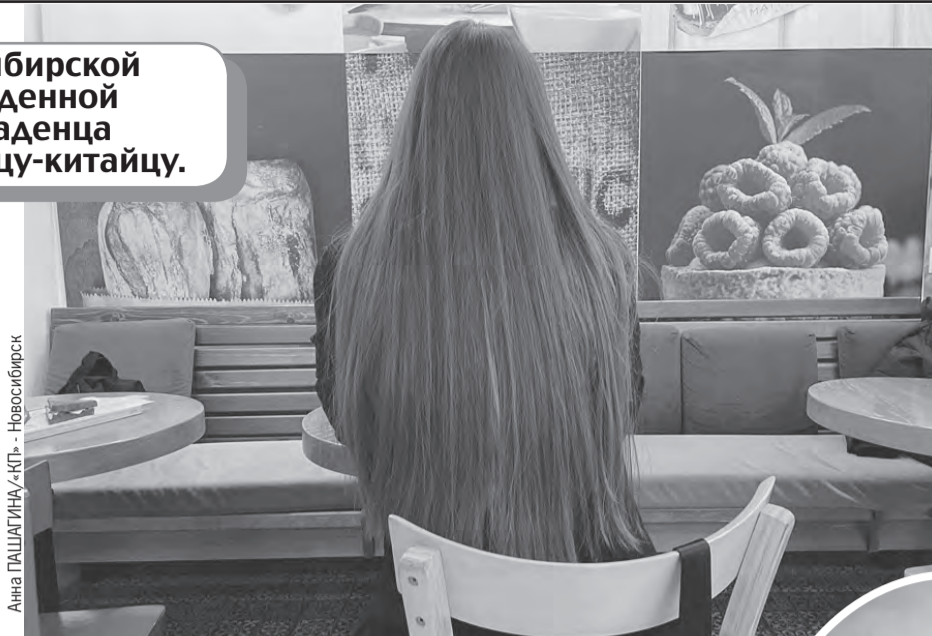
Мария думала, что рождает мальчика для бездетной пары, но потом узнала, что заказчик - одинокий китаец.