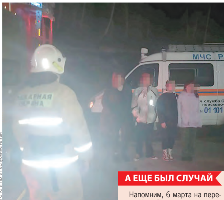
ГОЧС и ПБ в Республике Алтай

- Это не первый такой случай в нашем регионе, в прошлом го-