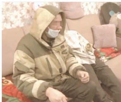
СУ СК РФ по Иркутской области

РАДИО КОМСОМОЛЬСКАЯ FM.KP.RU ПРАВДА Иркутск 91,5 FM | Братск 99,5 FM