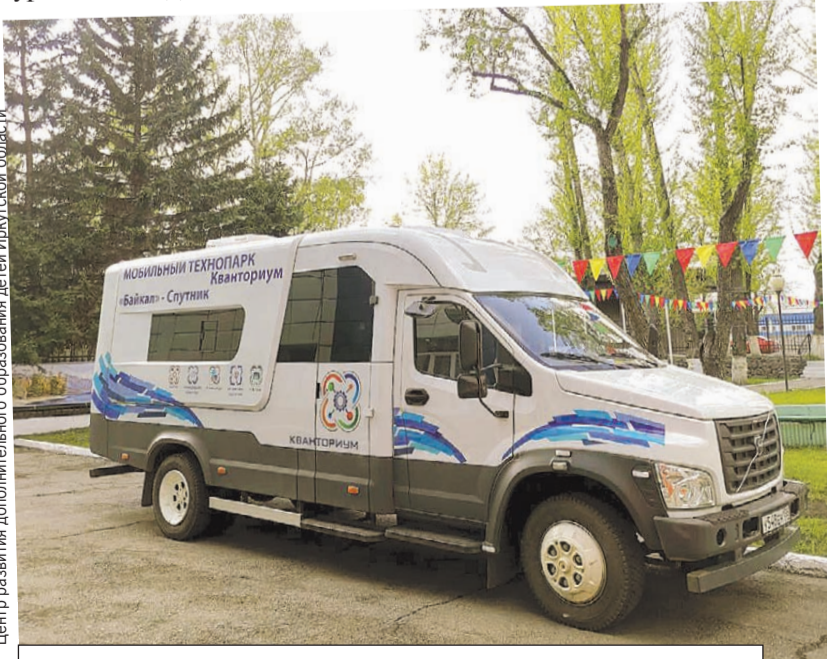
Мобильный «Кванториум» для ребятшек из отдаленных территорий.

Так, в прошлом году было организовано более 30 выездов в 10 муниципальных образований - Иркутский, Шелеховский, Эхирит-Булугатский, Усольевский, Слюдянский, Черемховский, Заларинский районы, а также в города Ангарск, Усолье-Сибирское, Черемхово - это порядка 200 занятий с полутора тысячами учащихся 5 - 11-х классов. В этом году «Кванториум Спутник» уже побывал в поселке Усть-Ордынском, селе Тугутуй, деревне Бутырки и других населенных пунктах Приангарья.