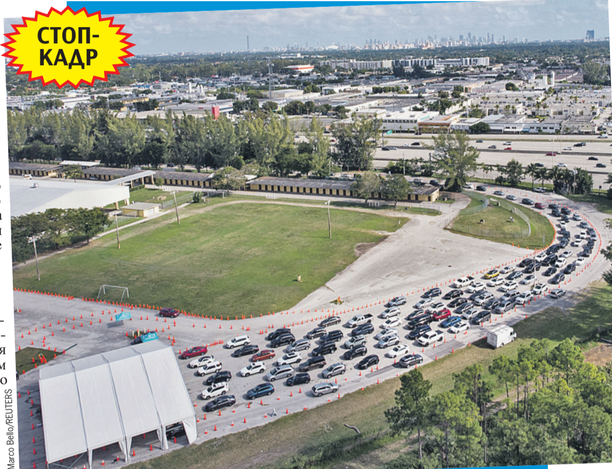
А вот так выглядит очередь на прохождение теста ПЦР по-американски. Посетители Тропического парка в Майами (штат Флорида) могут получить услугу, не выходя из машины.

Мы бы не пережили за ПЦР-тесты, но 18 января к нам должна была прилететь бабушка, которой в феврале стукнет 81, и очень не хотелось бы, чтобы она заразилась. И, ура! Тесты стали отрицательными накануне прилета родственников! Выздоровливаем!