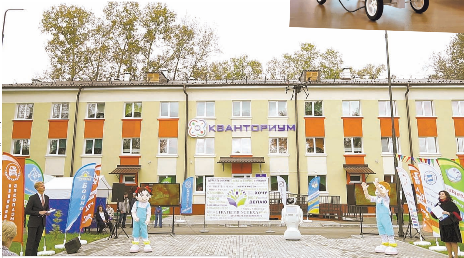
Познавательные современные пространства открываются в регионе.

Появление детских технопарков - это эра дополнительного образования нового уровня. Ни для кого не