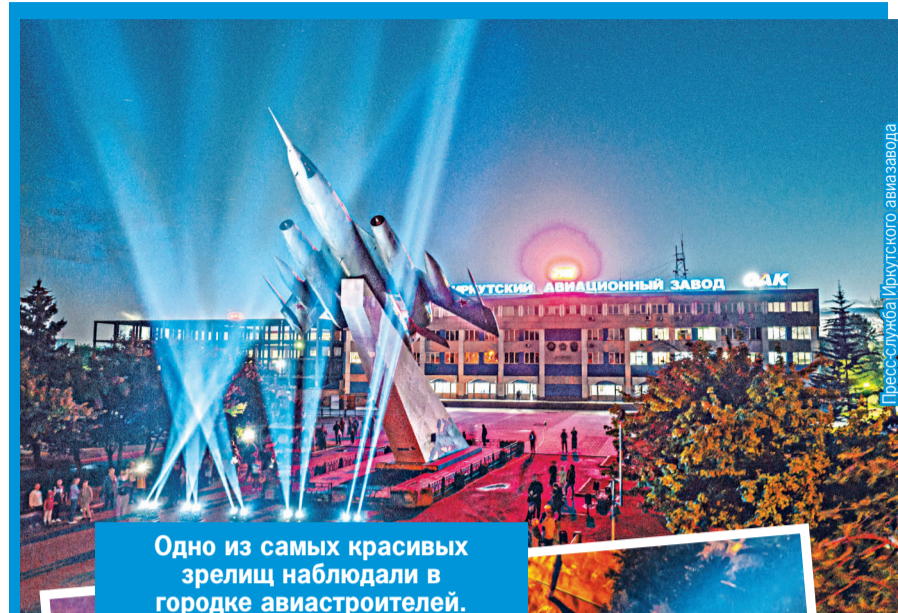
Одно из самых красивых зрелищ наблюдали в городке авиастроителей.