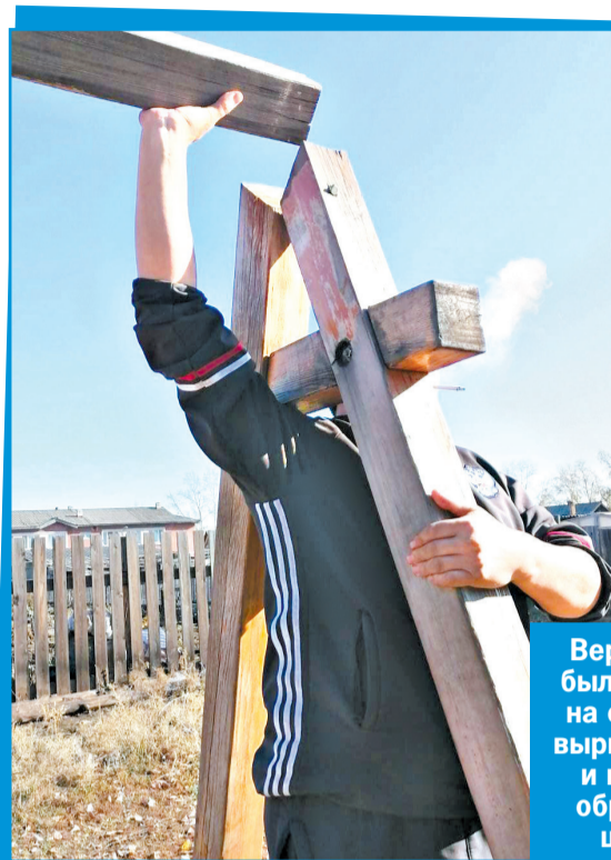
Верхняя планка была закреплена на саморезы, их вырвало с корнем и конструкция обрушилась на школьника.

К медикам Анна доставила ребенка сама: больница, на счастье, была в 5 минутах езды от злосчастной площадки. Школьника сразу поместили в реанимацию. Травмы, как объяснили врачи, оказались более чем серьезные... Мальчика без промедлений отправили