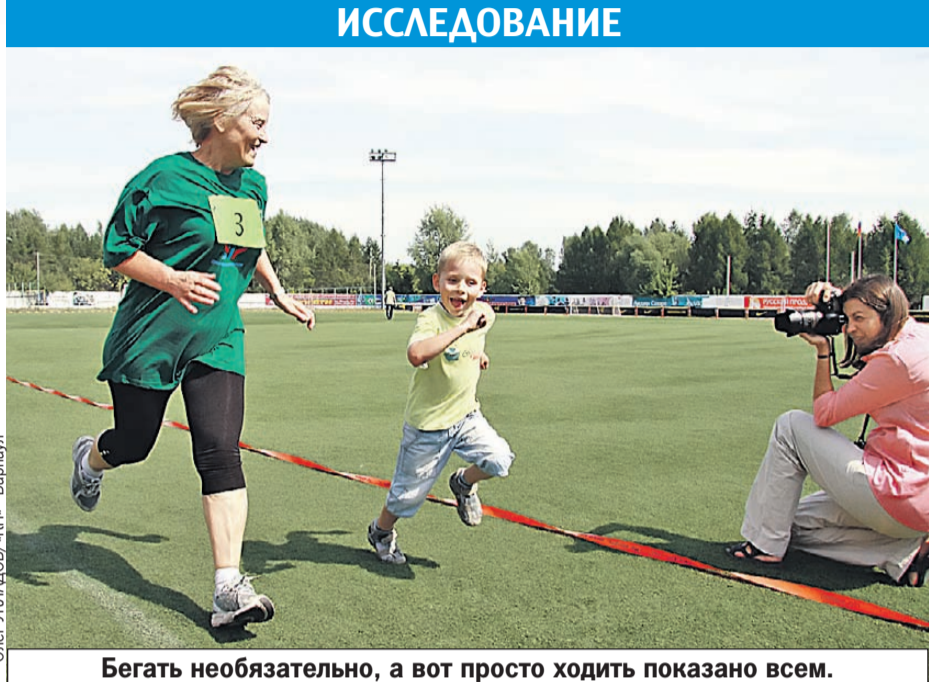
Бегать необязательно, а вот просто ходить показано всем.