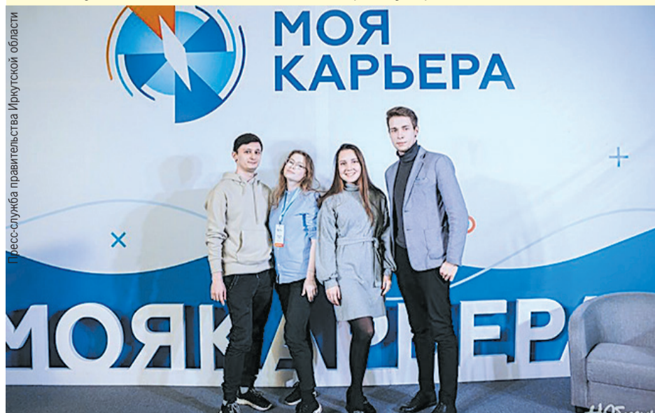
Мероприятие пройдет с 15 сентября по 30 ноября.

Узнать подробнее и подать заявку можно на сайте конкурса и в соцсетях.