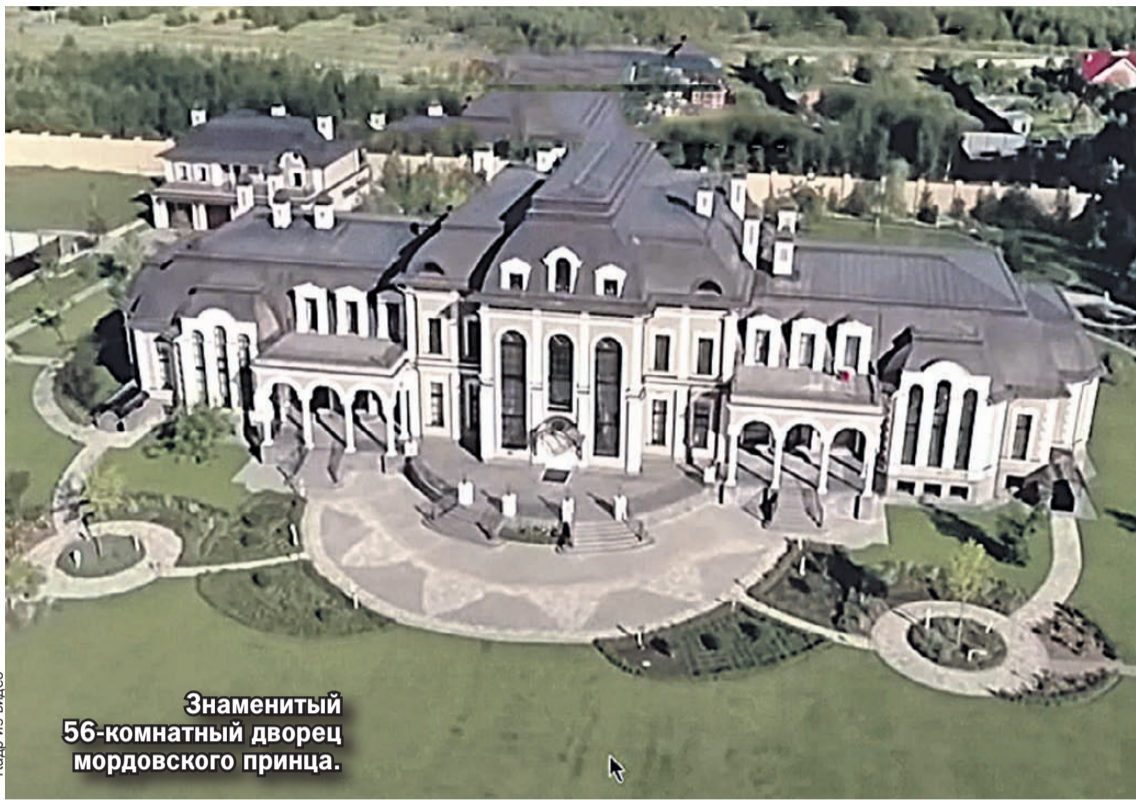
Знаменитый 56-комнатный дворец мордовского принца.