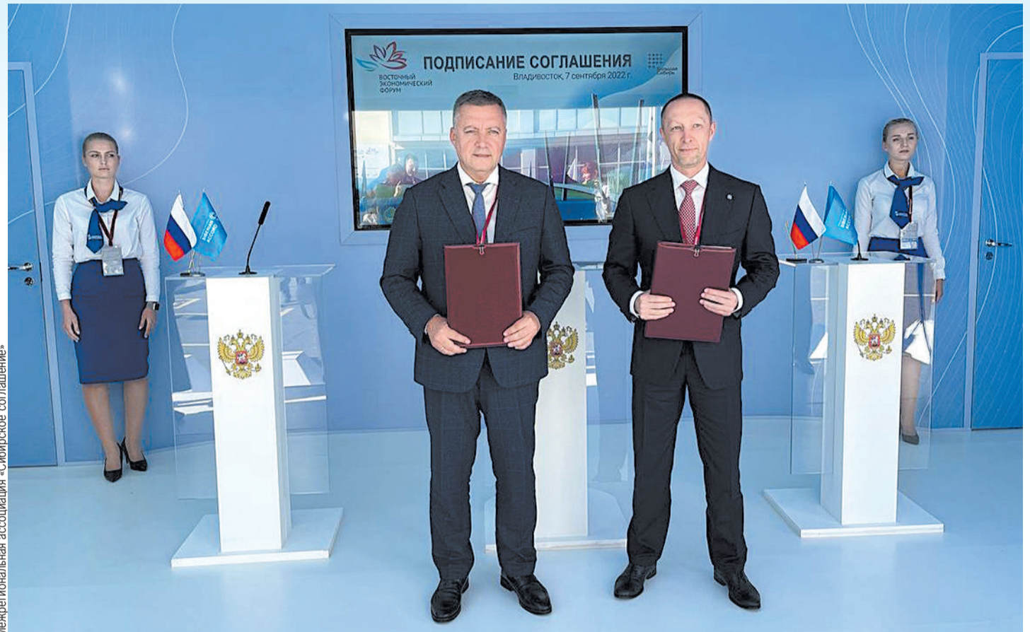
Губернатор Иркутской области Игорь Кобзев и президент Корпорации «Синергия» Вадим Лобов .

4. Промышленность: освоение золоторудного месторождения «Сухой Лог», строительство горно-обогатительного комбината на месторождении «Светловское», открытие производства гидроксида лития, строительство газоперерабатывающего завода и заво-