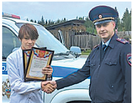
ГУ МВД по Иркутской области

РАДИО КОМСОМОЛЬСКАЯ ПРАВДА FM.KP.RU Иркутск 91,5 FM | Братск 99,5 FM «ТЕМА ДНЯ»