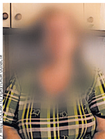
ГУ МВД России по Иркутской области

Женщина три месяца (!) отправляла деньги на «безопасный счет».