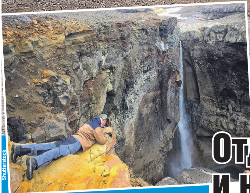
Здорово смотреть с края обрыва на дно Опасного каньона, в который с 80-метровой высоты падают воды реки Вулканная.

А там, на горизонте, - красавец вулкан Горелый. Звезда экскурсионных маршрутов по Камчатке.