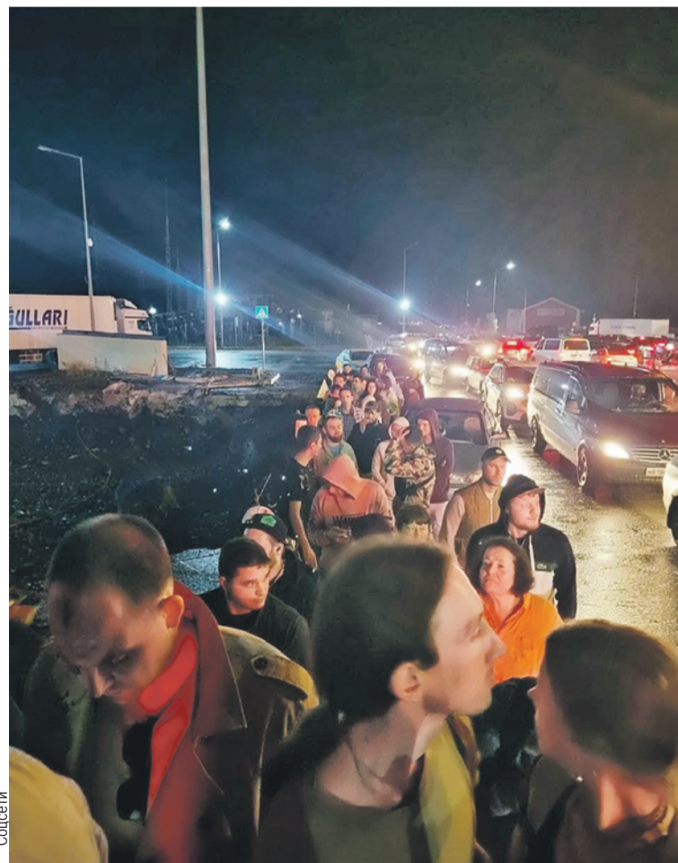
В очередях на границах с бывшими братскими республиками не все уверены в гостеприимстве соседей.

Бытовое раздражение (например, из-за русских беглецов аренда жилья подорожала и для простых казахов, грузин)? Или историческая память? Обиды прошлого (наши шуточки над мигрантами возвращаются к нам бумерангом)? Или вера в наше общее будущее? Посмотрим, куда повернет история.