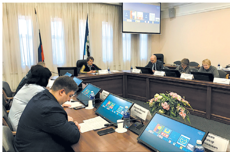
На заседании межведомственной комиссии обсудили итоги летней кампании.

В 36 муниципальных образованиях Иркутской области уже составлены планы по проведению малых или, так называемых, малозатратных форм отдыха. Это кружки, школьные и трудовые бригады, отряды мэров, работа на пришкольных участках, дворовый спорт, мероприятия городских и районных библиотек - в них будет задействовано около 7000 детей. Уточним, что средства на оздоровление ребятишек выделяются из областного бюджета.