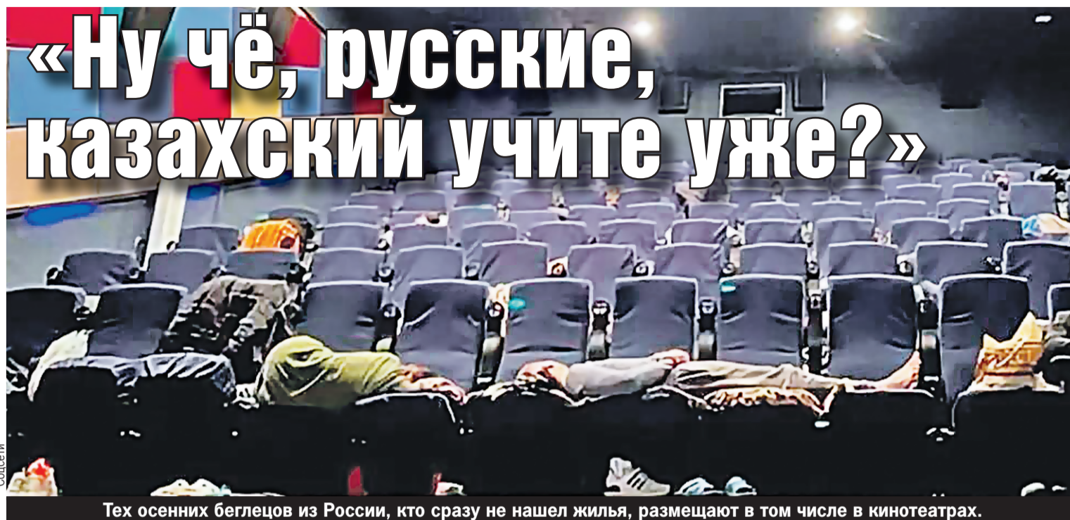
Тех осенних беглецов из России, кто сразу не нашел жилья, размещают в том числе в кинотеатрах.

Русских, рассыпанных по всему СНГ, называют «февральята» (эмигранты первой волны) и «сентябрята»