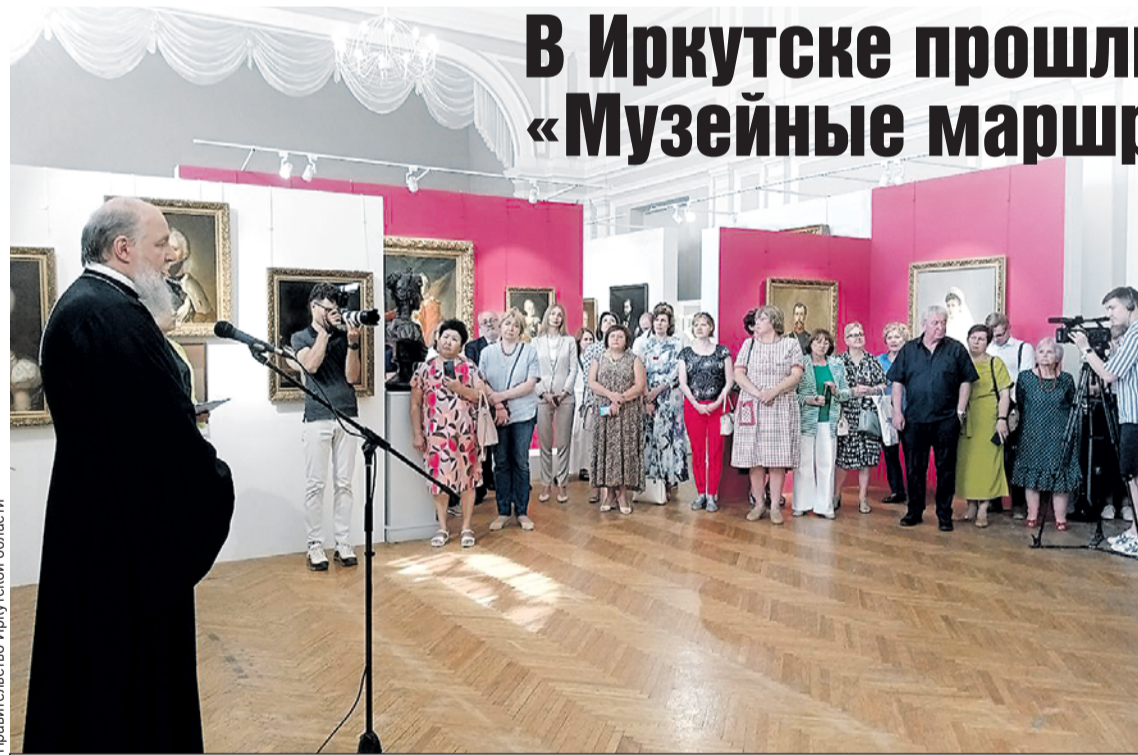
«Музейные маршруты России» проходят в 12 регионах страны.