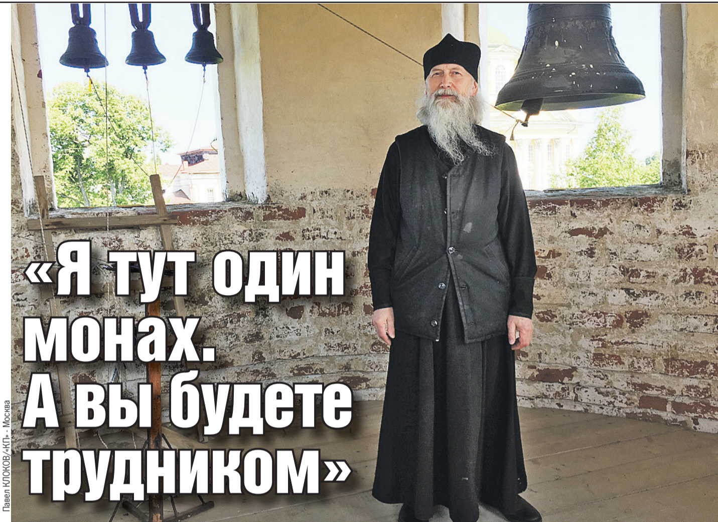
Павел КЛОКОВ/«КП» - Москва

Настоятель, немного склонив седую голову, заглянул мне в глаза. И улыбнулся. После чего вся эта моя суэта наносная как будто испарилась. Подобное чувство я буду испытывать еще не раз - особенно во время службы (когда ты стоишь, обуреваемый мрачными мыслями, и вдруг встречаешься взглядом с батюшкой, который просвечивает тебя как рентген, - душа, как будто после