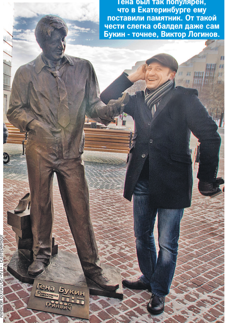
Алексей БУЛАТОВ/«КП» - Екатеринбург