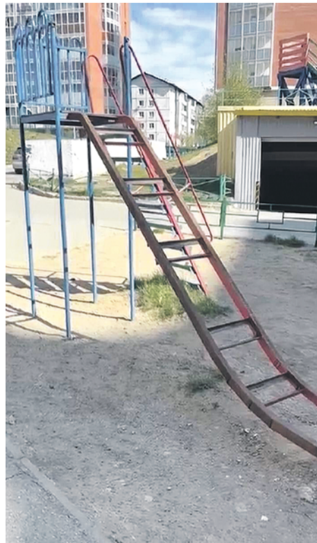
На заднем плане - зеленый забор, о который и ударились школьница.

- Проводится комплекс следственных мероприятий, направленных