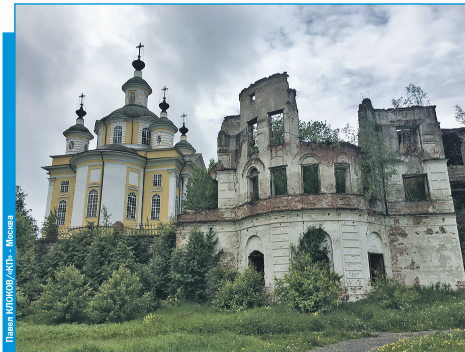
Павел КЛОКОВ/«КП» - Москва