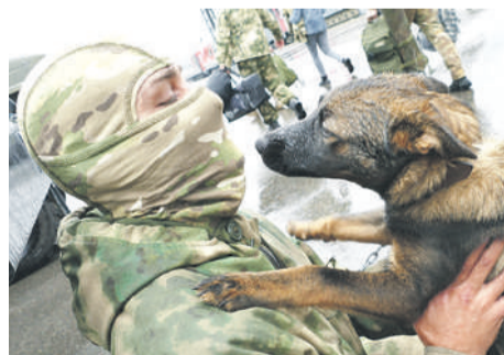
Управление Росгвардии по Иркутской области

Из командировки в зону специальной военной операции они вернулись домой в Приангарье не одни, а с собакой. Нашли ее там брошенной, испуганной, она жалобно скулила. На вид совсем щенок! Всего два месяца. Приютили, накормили, обогрели. Назвали Ленкой. Весь отряд полюбил маленькую «боевую подружку».