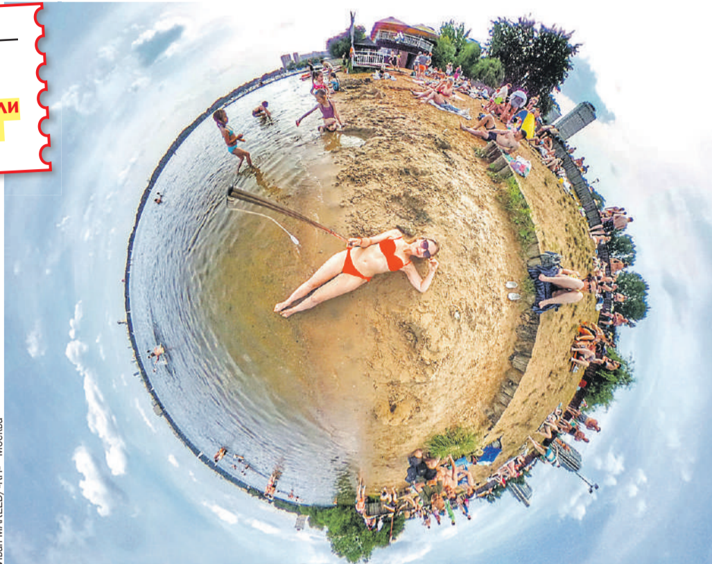
Что такое лето? Это море! Черное, Балтийское, Каспийское... и даже Японское!

- Ключевой для нас показатель - число туристических поездок. Он у нас вырос за май - август почти на 16%. И по сравнению с прошлым летом на 5 миллионов турпоездки люди совершили больше, - сообщил глава Минэкономразвития Максим Решетников (учитывают именно поездки, а не туристов - если вы летом слетали в Сочи на неделю и съездили на выходные в Плес, то попали в статистику дважды).