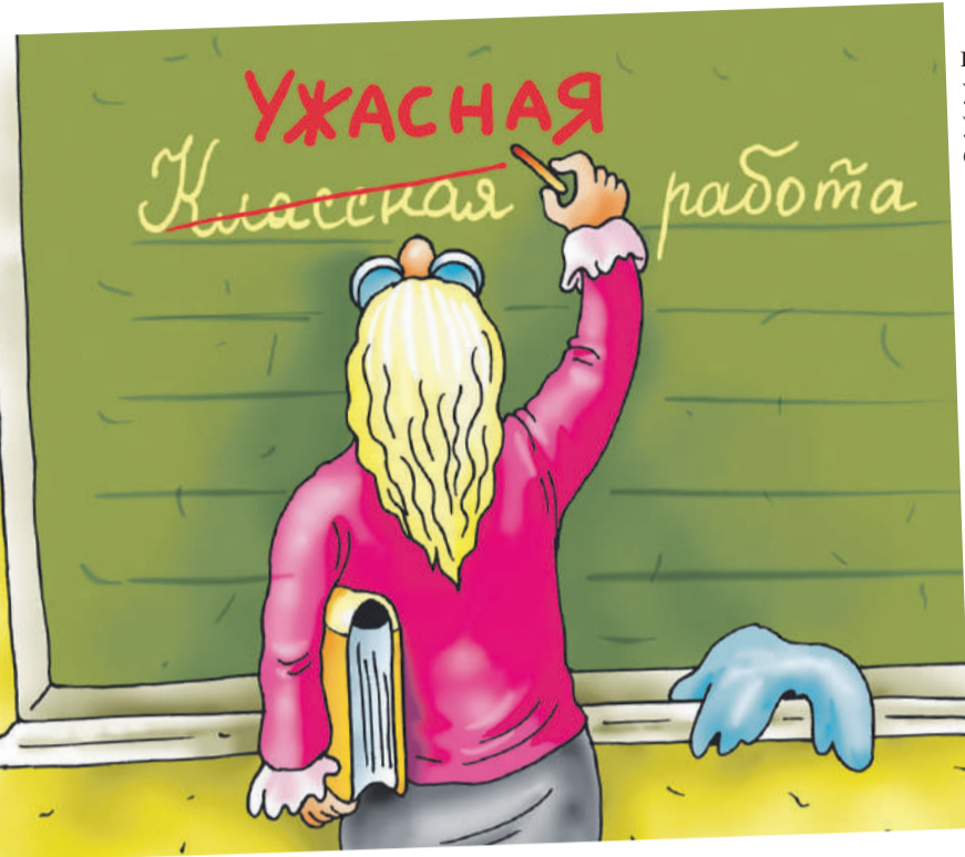
Катерина МАРТИНОВИЧ/«КП» - Москва

Пользуясь тем, что педагоги - люди ответственные, начальство нередко заставляет их работать сверхурочно: «Я учитель в селе. Нагрузка небольшая, и зарплата соответственно. Сейчас в райцентре