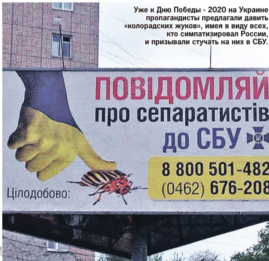
Уже к Дню Победы - 2020 на Украине пропагандисты предлагали давить «колорадских жуков», имея в виду всех, кто симпатизировал России, и призывали стучать на них в СБУ.

- Больше года. Случай уникальный, отпустили потому, что род-