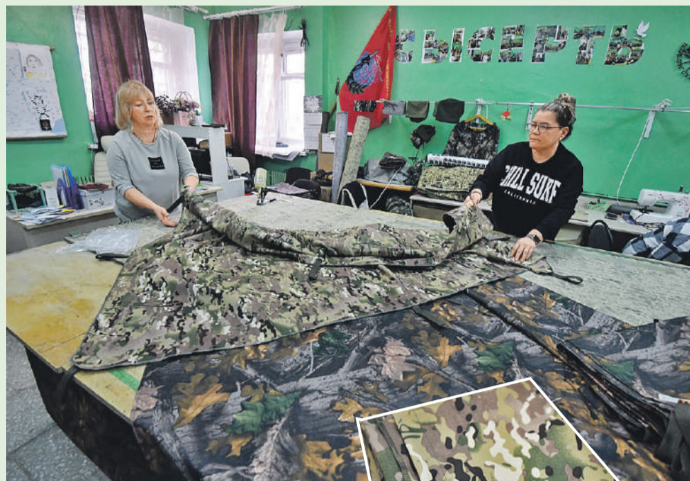
Алексей БУЛАТОВ/«КП» - Екатеринбург