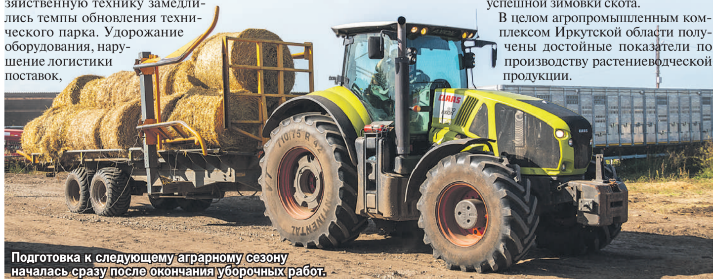
Подготовка к следующему аграрному сезону началась сразу после окончания уборочных работ.