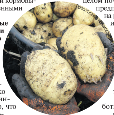
Пресс-служба правительства Иркутской области

- Иркутская область полностью, на 100% обеспечивает себя кормовым зерном, яйцами, пищевой солью. Достаточно у нас своего картофеля, мяса птицы, молока и молочных продуктов. Обеспечены мы и так называемым борщевым набором, в который входят капуста, морковь, свекла, лук.