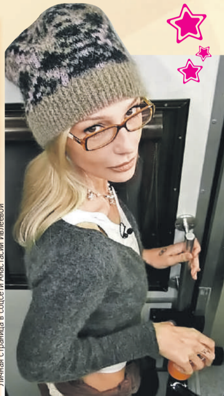
Личная страница в соцсети Анастасии Ивлеевой