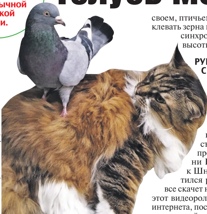
- Поехали, друг!