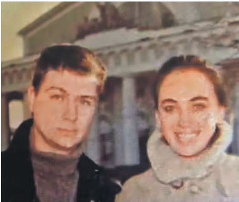
Личный архив Ларисы Гузеевой