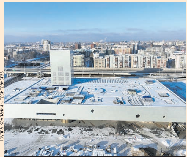
Группа компаний «Стройтрансгаз»

По ее словам, первую выставку планируется организовать летом этого года. Она получила название «Пять веков русского искусства» и представит широкий спектр искусства за несколько столетий: от иконописи до авангарда.