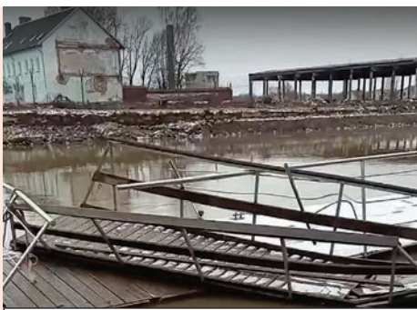
Конструкция после натиска льда. Но ее уже вернули на место.

- Стихия привела причальную инфраструктуру Гвардейска в негодность. Нужен полностью стационарный причал, и в замке Тапиау его планируется запустить к турсезону, - говорится в публикации.