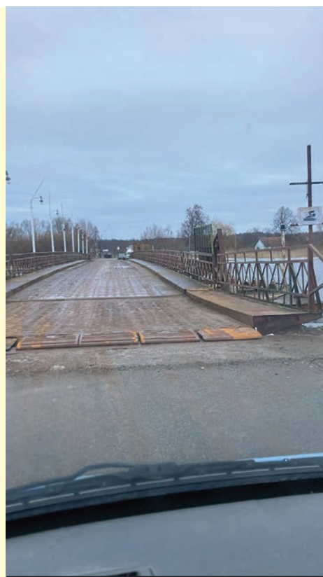
Движение для пешеходов и автомобилистов открыто.

- Сейчас идет разработка проектно-сметной документации, завершить которую планируется в сентябре этого года, - отметили в министерстве развития инфраструктуры.