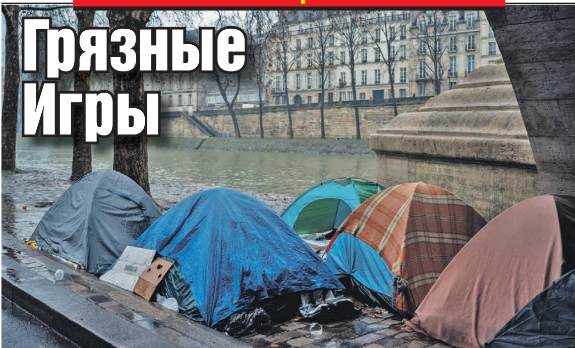
Зачистка лагерей для беженцев вокруг олимпийских объектов в Париже привела к тому, что сотни бездомных перебрались под мосты на Сене.