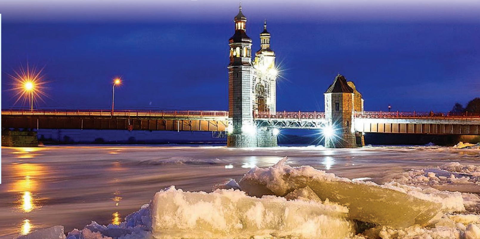
На самом мосту Королевы Луизы сегодня тихо, зато под ним - движение и шум.

В минувшие выходные телеграм-канал «Погода и метеоявления в Калининградской области» вел наблюдение за ледоходом на реке Неман на фоне моста Королевы Луизы. Авторы сообщества публиковали и фотографии, и видеоролики о движении льда. Мост красивый, ледоход - явление для наших широт редкое, а все вместе - очень зрелищно.