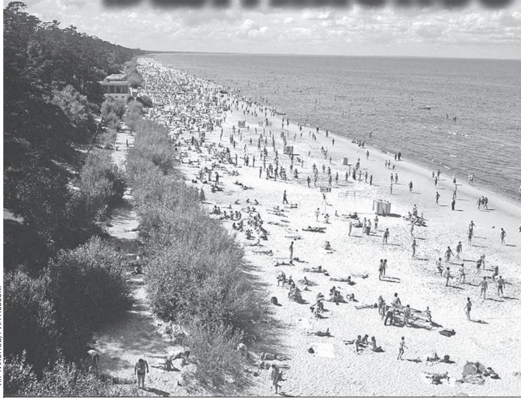
Прибалтийская «ривьера», кадр из восьмидесятых. Для советских людей отдых там был мечтой. Как же все изменилось...

Похоронив Рижский вагоностроительный завод, министерство путей сообщения Латвии купило электрички от «Шкоды»,