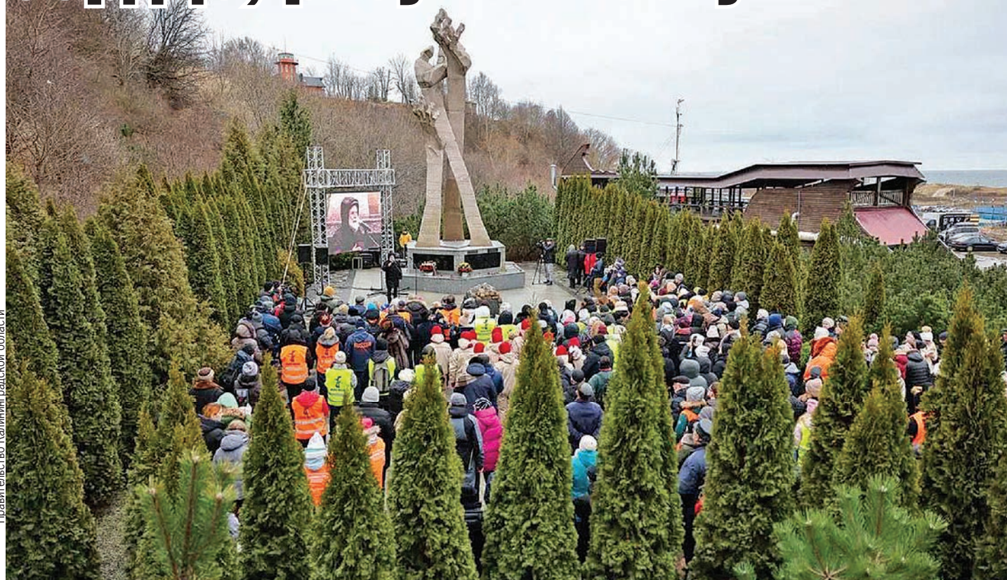
На митинге в Янтарном почтили память жертв страшных событий 31 января 1945 года.