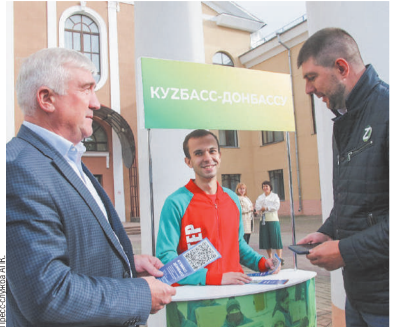
Волонтеры медиамарафона раздавали на улицах брошюры с информацией о способах перечисления средств на восстановление города.

Первый гуманитарный автопоезд отправился из Кузбасса уже 26 февраля. Две фуры с 40 тоннами груза прибыли в Ростовскую область 5 мар-