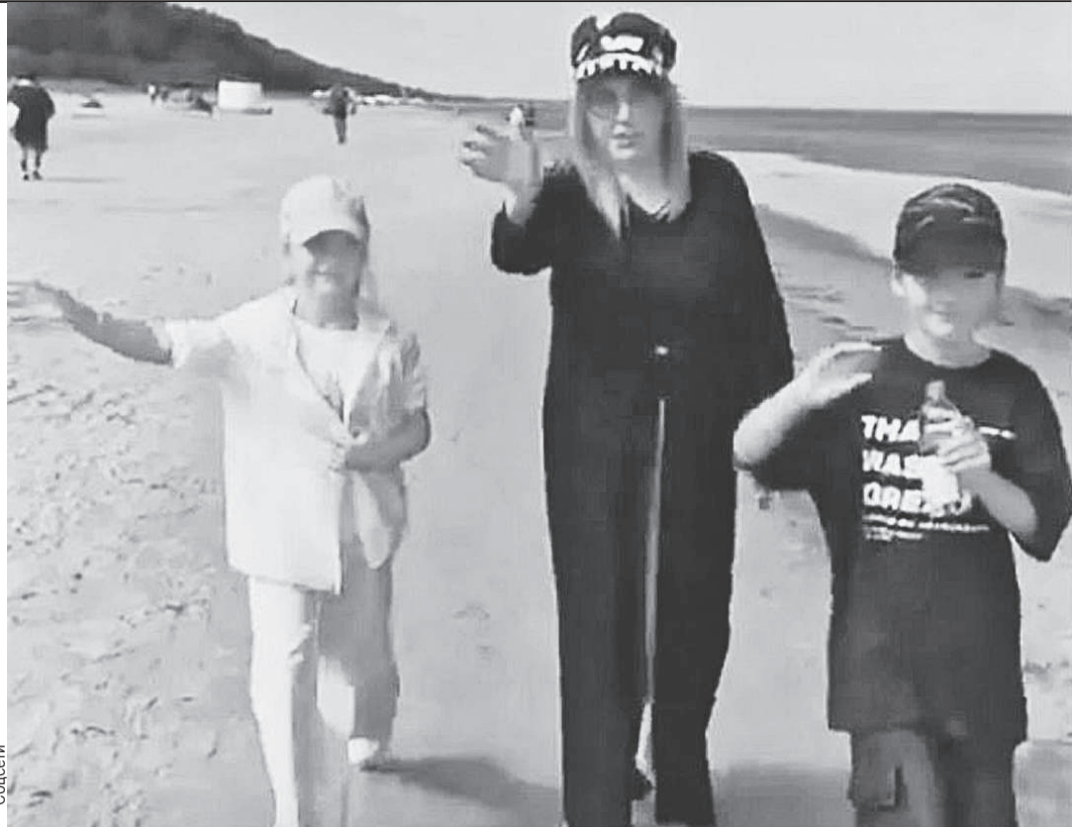
подруги Лаймы Вайкуле и мужа, Пугачева подчеркнуто аполитична.

Вот и композитор Раймонд Паулс сообщил журналистам о недавней беседе с Аллой Пугачевой, которая ему сказала, что скоро вернется с детьми в Москву. Этим летом публично рассуждал об эмиграции Примадонны и Григорий Лепс : «Пугачева - великая артистка. А может, человек просто отдыхает? От нее не было заявлений никаких в ту или иную сторону». В Израйле Алла Борисовна со своими друзьями Андреем Макаревичем и Борисом Гребенщиковым посетила форум «СловоНово», где собрались деятели, известные русофобской позицией. Однако в отличие от своих израильских друзей, латышской