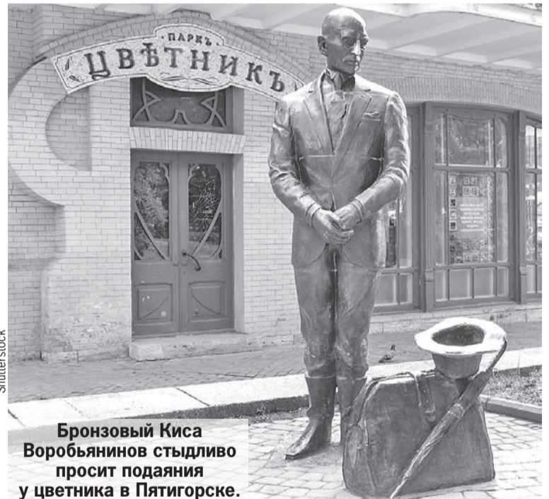
Бронзовый Киса Воробьянинов стыдливо просит подаяния у цветника в Пятигорске.

человек. Дети вцепились в поручни и старались не смотреть вниз, где деревья кончились и лежал снег.