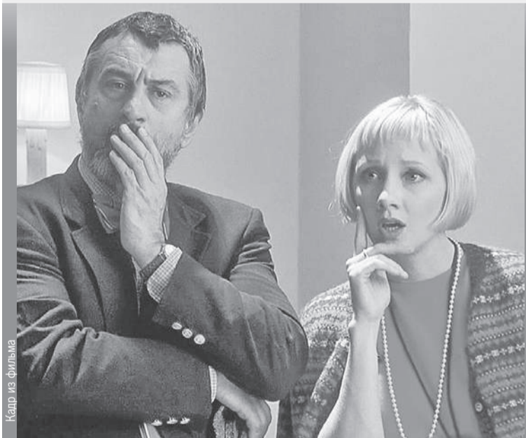
Энн Хеч снялась во многих известных фильмах (на фото она с Робертом Де Ниро в фильме «Хвост виляет собакой»). Ее жизнь трагически оборвалась после страшной аварии.