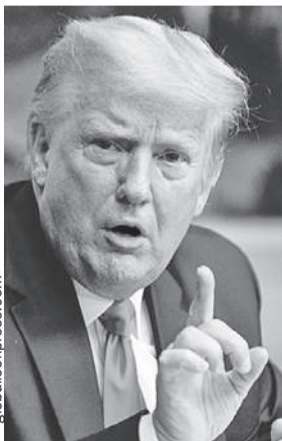
Возмущенный Трамп уже назвал обыск «охотой на ведьм».

Сейчас за океаном обвинения в шпионаже пытаются навесить на самого экс-президента США Дональда Трампа - только бы не допустить его до участия в выборах 2024 года. Потому что согласно соцопросам, Трамп вполне может одолеть не