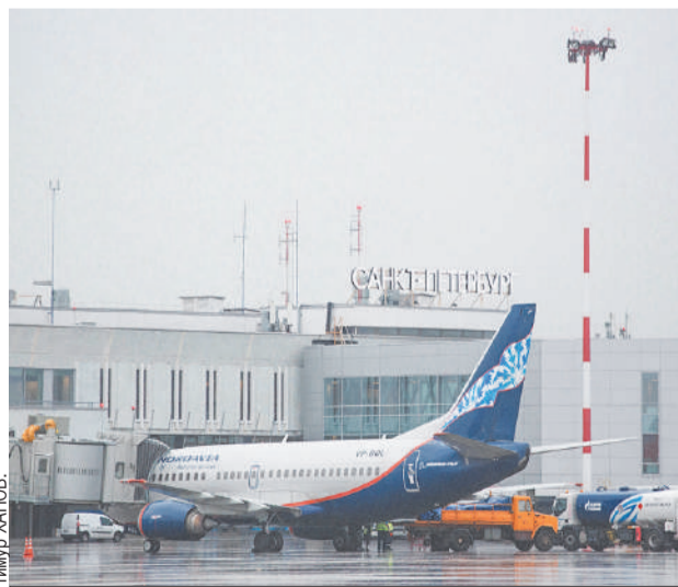
Перелет из Спиченкова в Пулково займет 4 часа 50 минут, обратно - на 25 минут меньше.

А вот жителям Кемерова благодаря открытию нового направления стало проще добраться до Омска. Прямые рейсы со 2 августа запустила компания «ЮТэйр». Пассажиры перевозят на самолетах АТР-72 вместимостью 70 человек. Рейсы выполняются дважды в неделю. Во вторник время прилета в Ке-