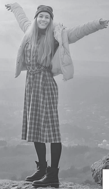
Незабываемый отпуск в незабываемых горах.

Подъем на второй уровень шкочет нервы. Нам предстояло достичь высоты 3035 метров не в закрытой кабинке, а в открытом кресле на шесть