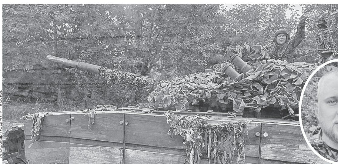
Александр КОЦ/КП - Москва

Как союзные силы взяли под контроль ключевой пункт под Донецком и пошли на вражеские укрепрайоны в Первомайском.