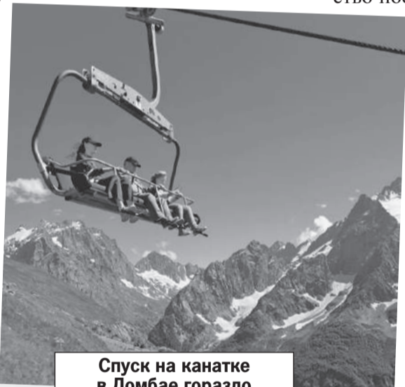
Спуск на канатке в Домбае гораздо страшнее, чем подъем.