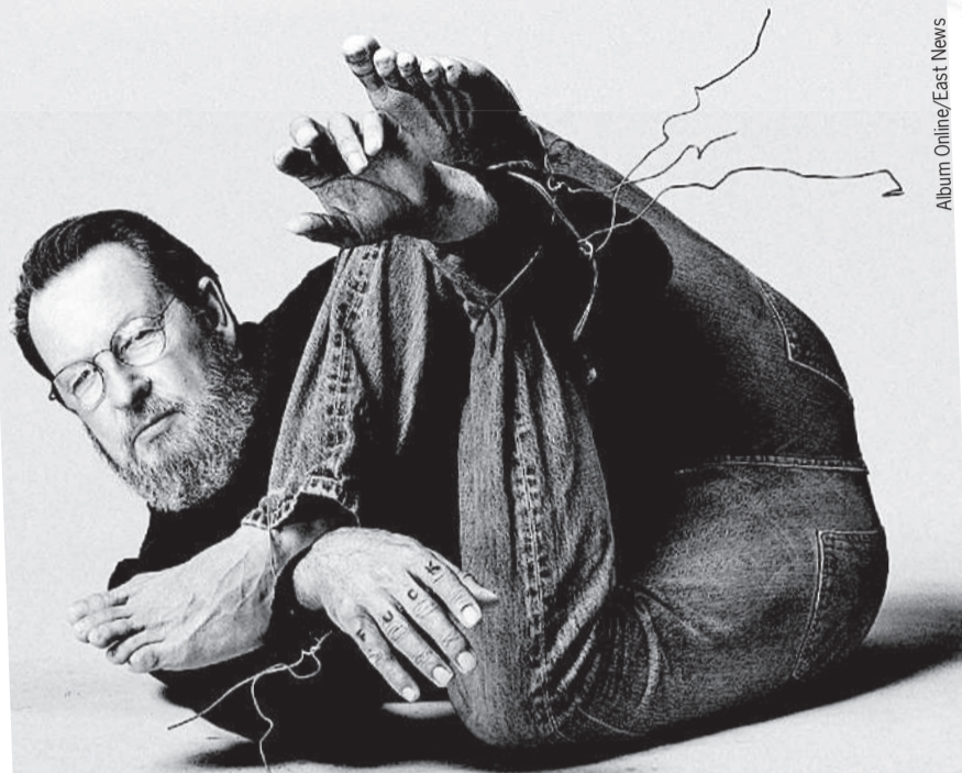
Собственное тело стало ловушкой для таланта великого режиссера.

У знаменитого 66-летнего датского кинорежиссера Ларса фон Триера диагностировали болезнь Паркинсона. От нее страдают около 8 млн человек. В России в год заболевают 20 тысяч. Что происходит с организмом человека при болезни Паркинсона и чем ему может помочь медицина?