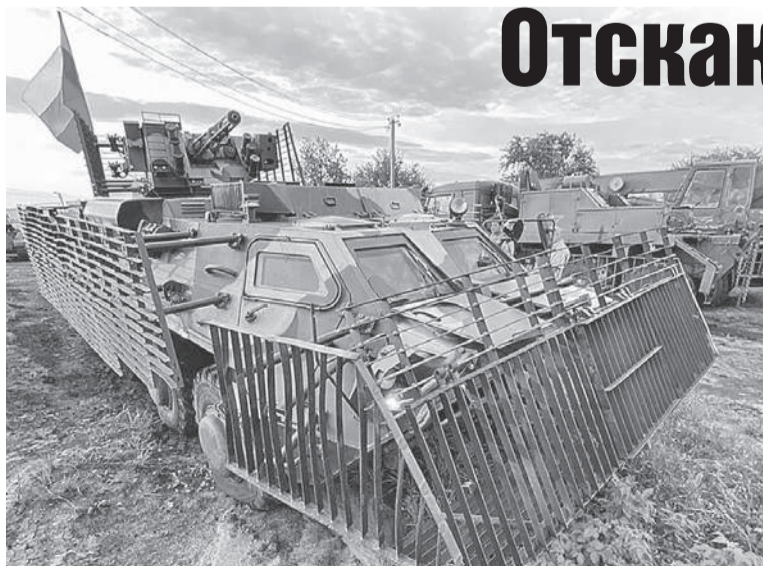
Дмитрий СТЕШИНУ/КП - Москва

Экипаж - 3 человека Десант - от 7 до 9 человек