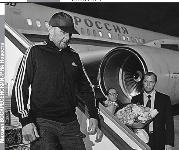
Вадима Красикова, вызволенного из ФРГ, называют ключевой фигурой обмена.

А еще известно, что Красиков молчал. Он не признал вину, не сотрудничал с немецким следствием, не просил о помиловании или снисхождении. А ведь его наверняка «кололи». Даже ломали, добиваясь признания в связях с российскими спецслуж-