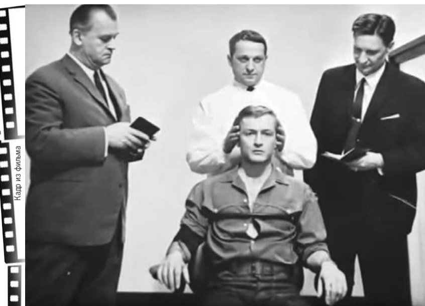
Кадр из знаменитого фильма «Ошибка резидента», где советскому разведчику (его сыграл Михаил Ножкин) на Западе устраивают психологическую проверку.