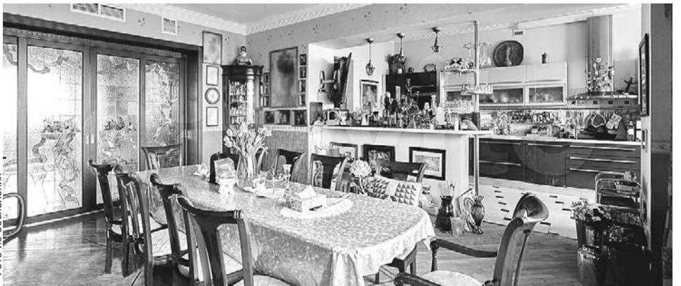
Недвижимость была выставлена на продажу в мае за 130 млн руб.