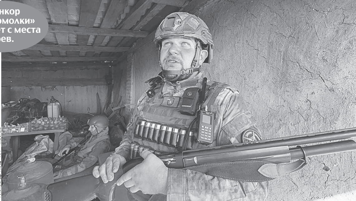
Вообще-то боец с позывным «Связист» отвечает в «Пятнашке» за связь. Но его огромное ружье - это еще и гроза всех вражеских дронов.

- Свою линию мы сейчас стабилизировали, наши парни никуда не сдвинутся, - уверяет «Близнец». - Вы же