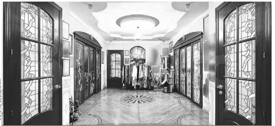
Общая площадь - 236 квадратных метров.