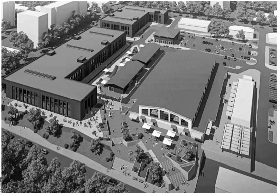
Таким Центральный рынок хотели сделать несколько лет назад. Сейчас вопрос ставится совершенно иначе.