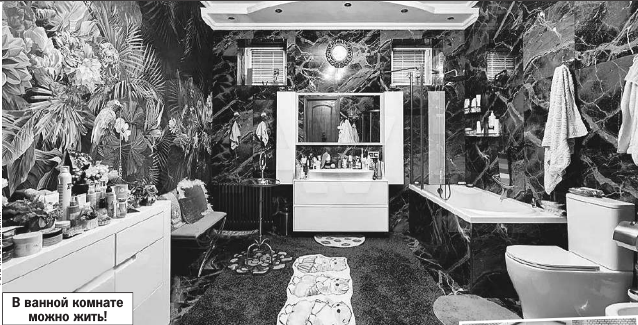
В ванной комнате можно жить!

Дельцы каким-то образом смогли достать старое видео, на котором, предположительно, Лариса Долина показывает паспорт, мол, это она. Вероятно, звезда дистанционно подтверждала свою личность для заказчика выступлений. Именно этот ролик аферисты использовали, когда брали задатки с желающих приобрести квартиру певицы. Дело в том, что по закону соб-