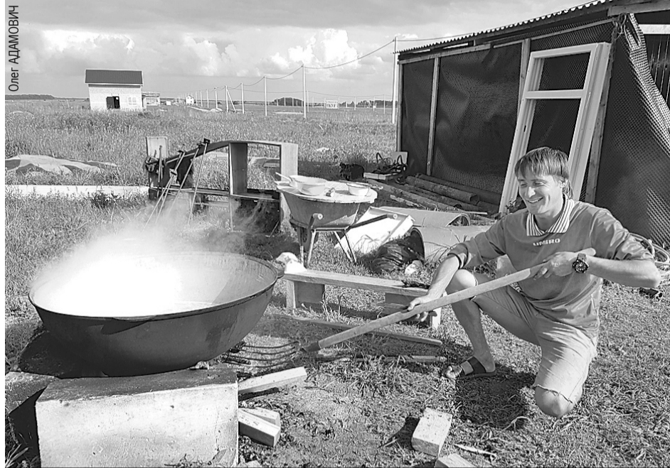
В деревне киргизов еду готовят сразу на всех. Шурпы из такого казана хватает минимум на день. Дежурство по кухне поручают самому незанятому человеку.

Сходство с Америкой на этом не заканчивается. Сейчас строящаяся община похожа на городок в прерии Дикого Запада. Поле, трава по пояс, грунтовка, ведущая от асфальта, и