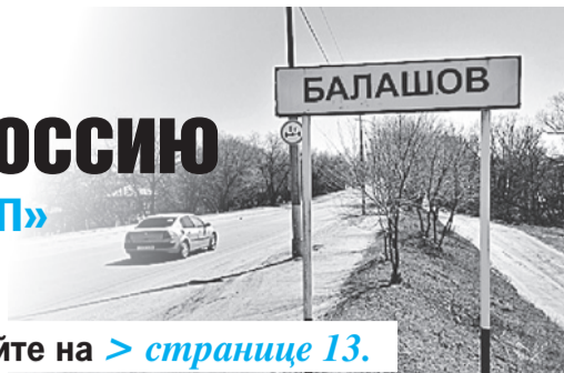
Виктор ГУСЕЙНОВ/«КП» - Москва