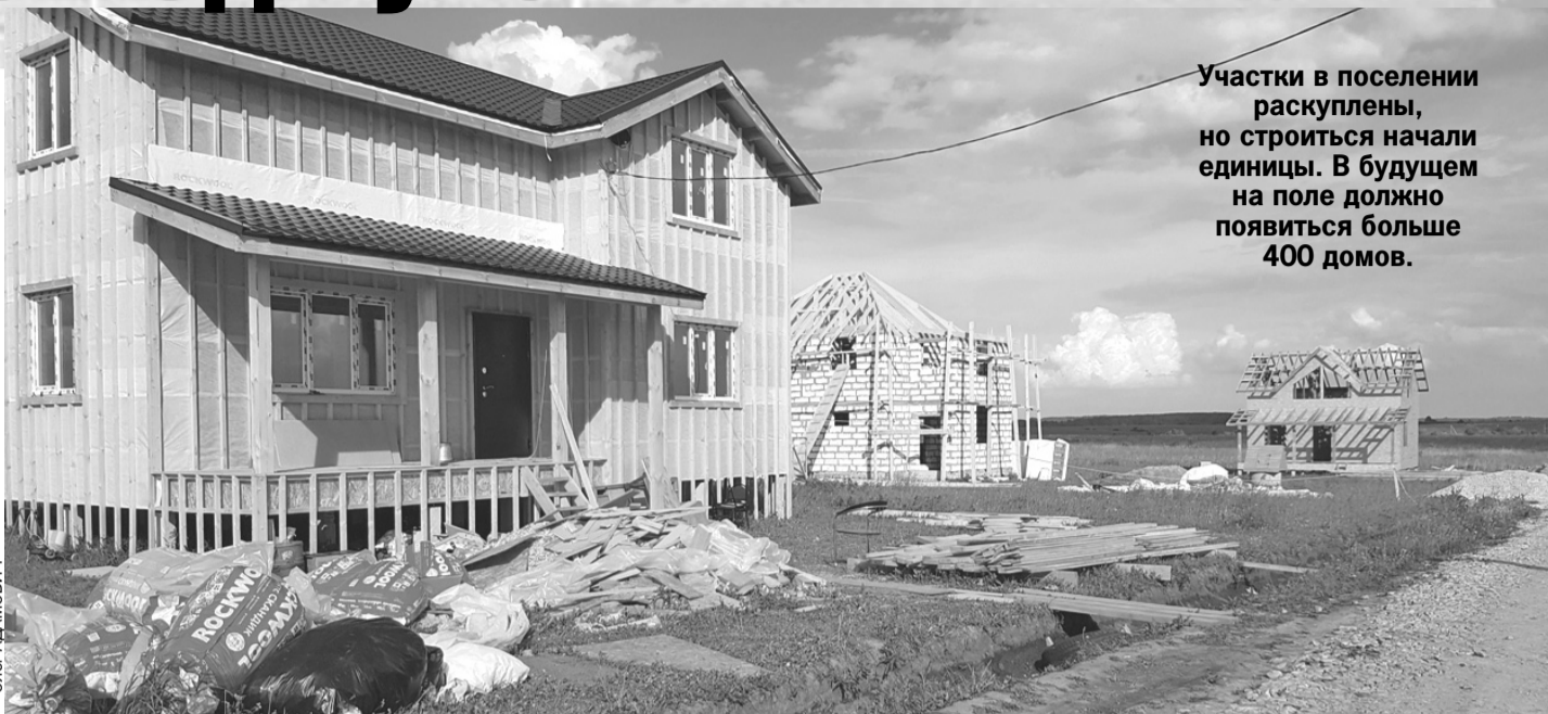
Участки в поселении раскуплены, но строиться начали единицы. В будущем на поле должно появиться больше 400 домов.

- Нет. Так там же пока чистое поле. Подготовил Олег АДАМОВИЧ.