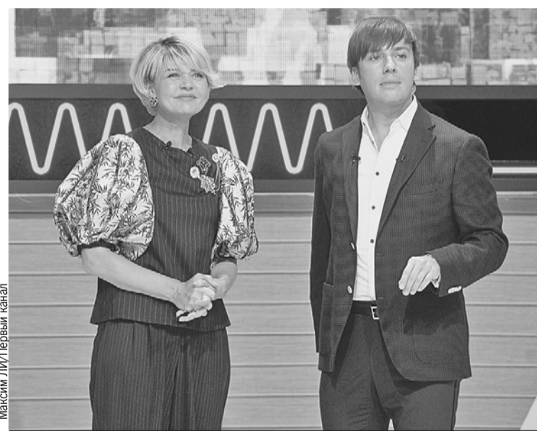
У Юлии Меньшовой и Максима Галкина великолепный тандем.