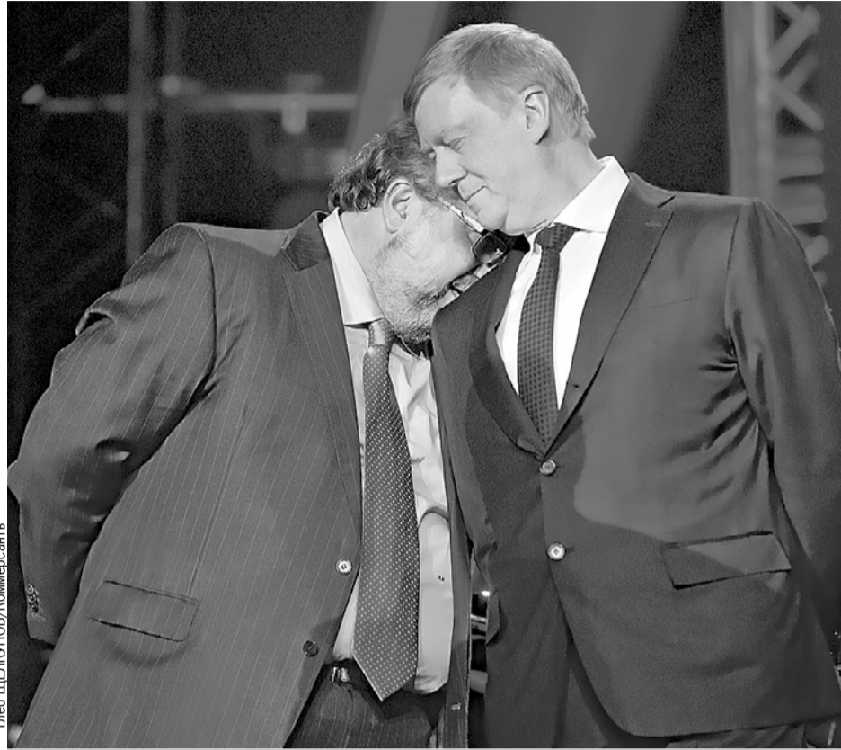
Как же хорошо, когда рядом есть надежное плечо!