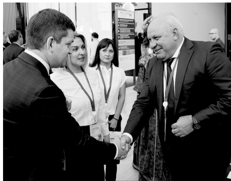
Теплые встречи в рамках ПМЭФ-2018.

Последние полтора года республика жила в режиме жесткой экономии. Но тут