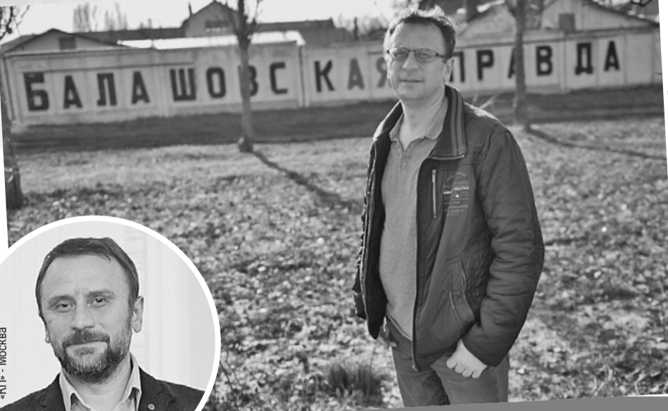
Виктор Гусейнов / «КП» - Москва