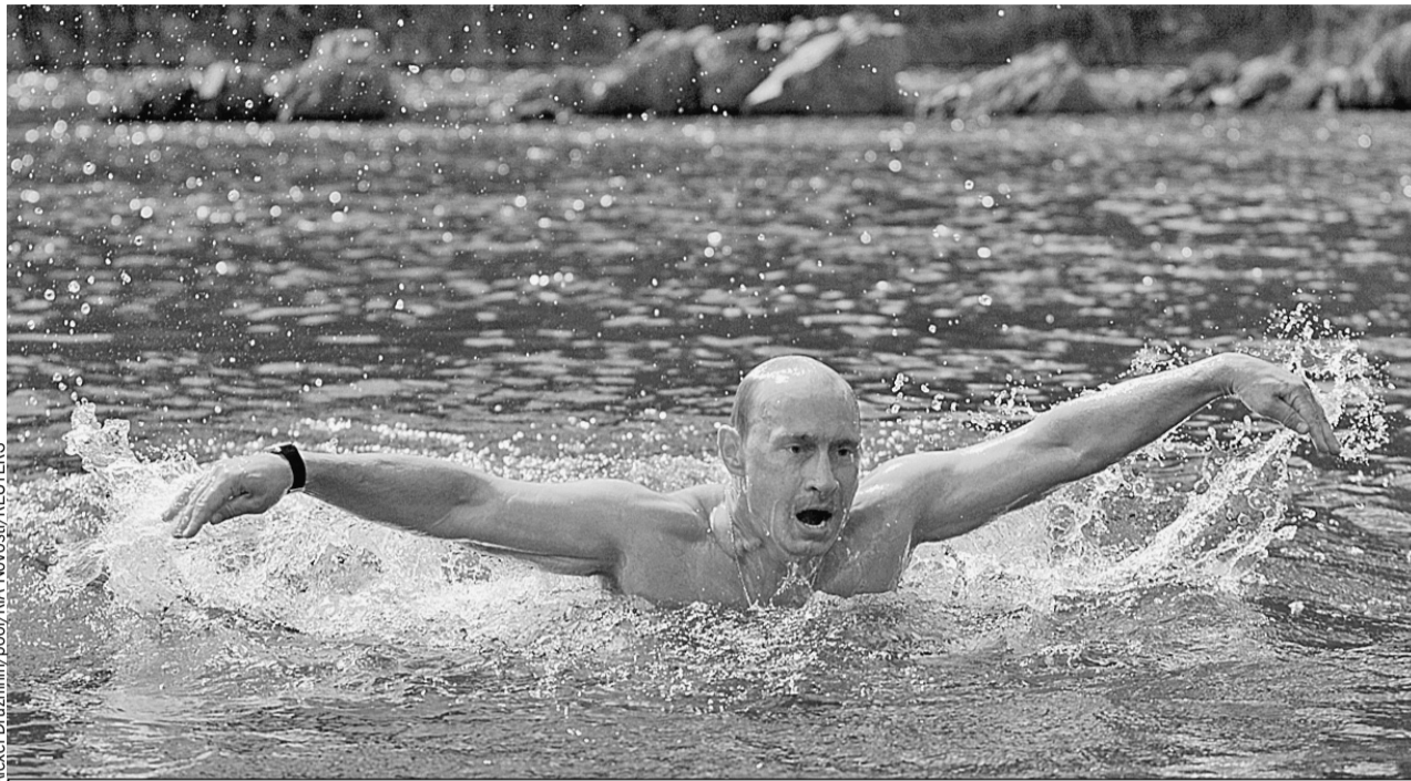
Кадры, на которых Владимир Путин во время отпуска демонстрирует прекрасную физическую форму, не дают покоя политикам и журналистам на Западе. Завидуют? (На фото - Путин во время заплыва по горной реке в Туве в 2009 году.)