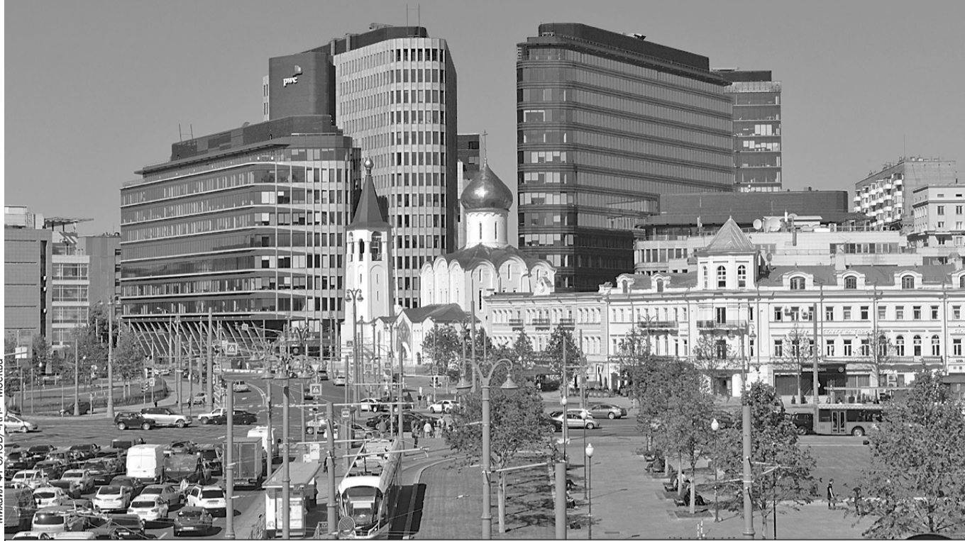
Престижный бизнес-центр в центре Москвы - одна из жемчужин в коллекции миллиардера.