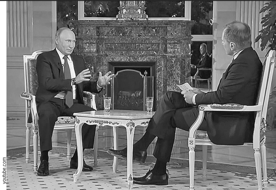
Разговор получился таким энергичным, что австрийский журналист пытался перебить Путина 11 раз (такая «модная» западная манера). И президенту приходилось даже переходить на немецкий, чтобы его остудить.

Мы не хотим, чтобы нам подсунили еще одного, второго, третьего или пятого Саакашвили, бывшего президента Грузии. Мы не