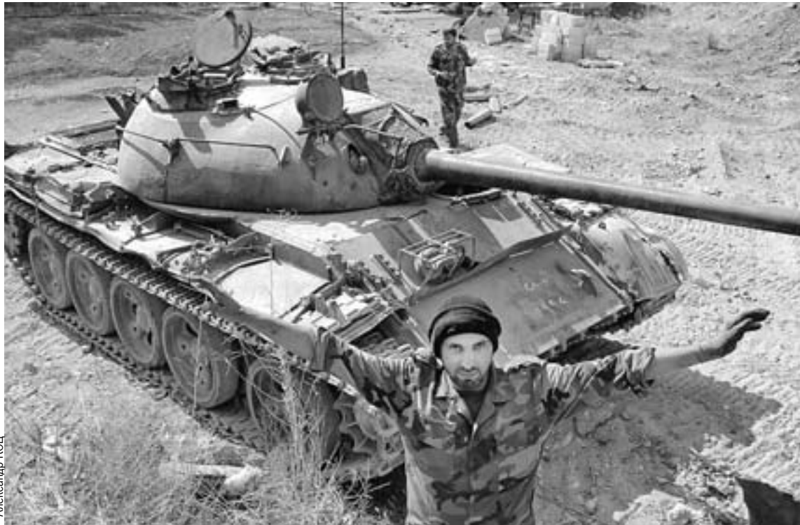
Танкисты правительственных сил ведут обстрел боевиков, метр за метром освобождая от них сирийскую землю.

До недавнего времени Ярмук между собой делили разные группировки, среди которых - и недобитки из ИГИЛ. Когда был решен вопрос с Восточной Гутой, боевики на юге столицы прекрасно понимали, что теперь примутся и за них. Большинство вняло аргументам российских переговорщиков и предпочло выехать на «зеленом экспрессе» в сторону Идлиба. Игилловцам же выезжать фактически некуда - желающих принять к себе этих отморожков нет даже среди таких террористических группировок, как «Джейш аль-Ислам» или «Фронт ан-Нусра». Поэтому упираться они будут до конца. Но на моих глазах сирий-