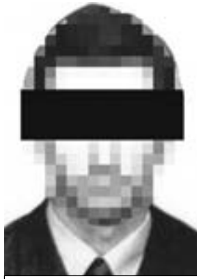
Вот он, агент-убийца Гордон. Говорите, ничего не видно? А вот британцам сразу все ясно стало.

Тот якобы действовал с пятью подопечными и вернулся в Россию.