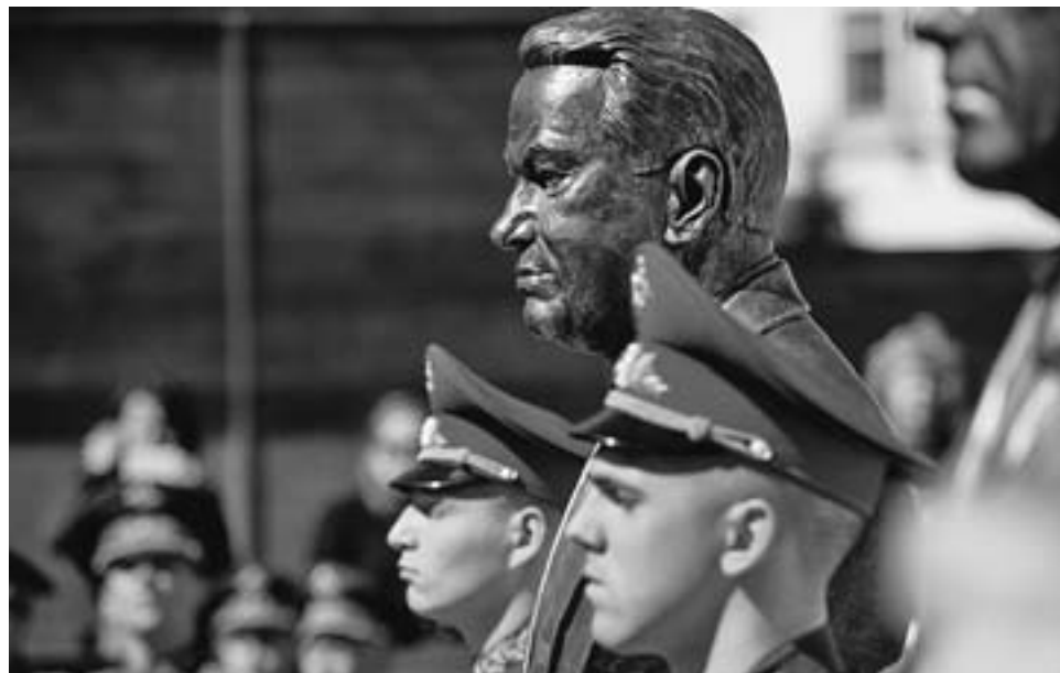
Бронзовый бюст Бориса Ельцина занял свое место по соседству с бюстом Михаила Горбачева. В жизни они были «политическими противниками», а в истории встали рядом.

вательная, а не политическая, это место не для полемики, а для размышлений.