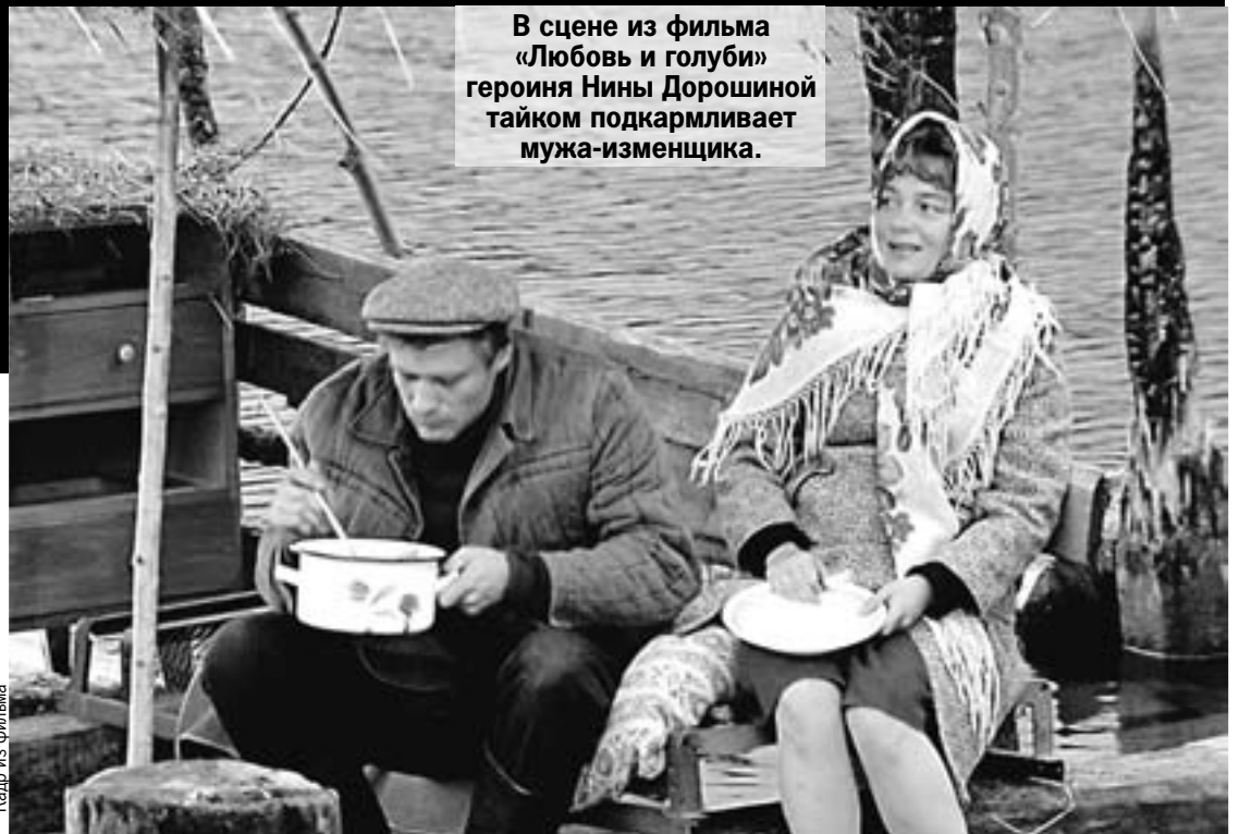
В сцене из фильма «Любовь и голуби» героиня Нины Дорошиной тайком подкармливает мужа-изменщика.

- У нее душа была добрейшая, ей хотелось всех осчастливить... Она любила театр, и там, на сцене, выражалось ее необыкновенное сердце, ее душа, ее обаяние. Ее любили люди, а завоевать любовь не так-то просто. Это уни-