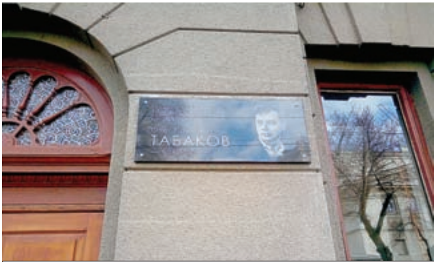
Памятная табличка размещена на здании Дворца творчества, где Олег Табаков начинал свой путь артиста.