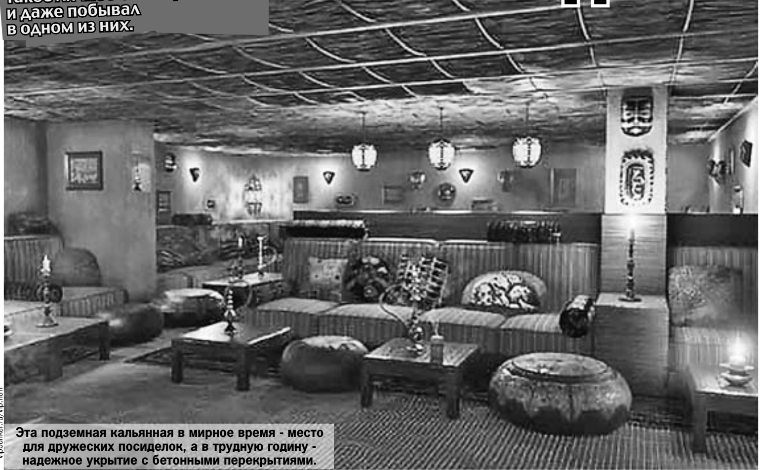
Эта подземная кальнянная в мирное время - место для дружеских посиделок, а в трудную годину - надежное укрытие с бетонными перекрытиями.

Спецкор «Комсомолки» попробовал заказать такое личное бомбоубежище и даже побывал в одном из них.