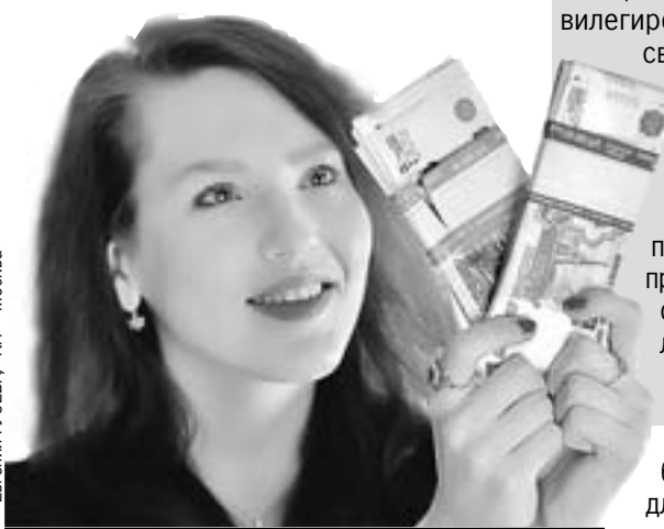
Аналитики советуют присмотреться к ценным бумагам банка.