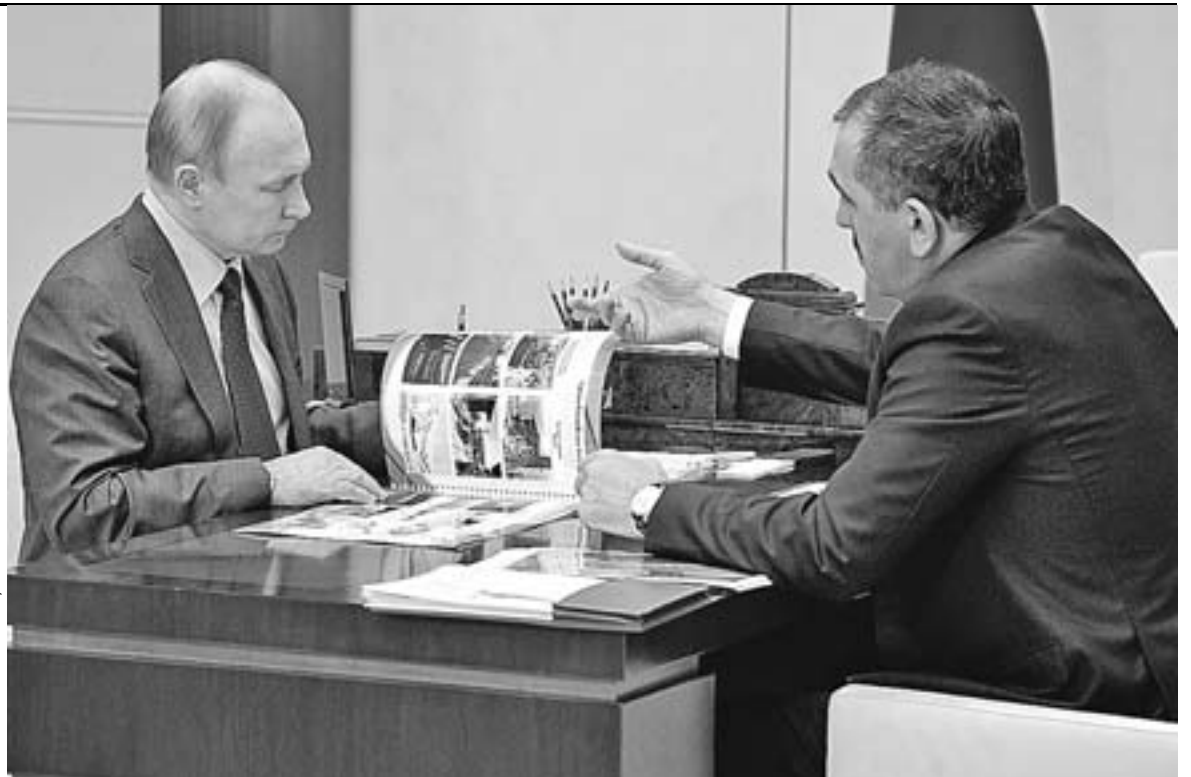
Юнус-Бек Евкуров пришел к президенту не с пустыми руками. Он принес фотоальбом построенных в Ингушетии школ, детсадов и перинатального центра.

- Весь общественный транспорт республики уже работает на газомоторном топливе, - сказал Евкуров. - Мы специально заказали на Нижегородском заводе переоборудование автобусов на газомоторное топли-