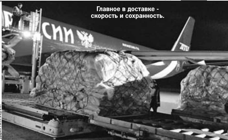
Главное в доставке - скорость и сохранность.

- Это очень важный элемент социального сервиса. В 2018 году мы решили не повышать тарифы, оставили их на уровне прошлого года. Примерно на 2,5 тысячи изданий предоставляем скидку - от 20 до 25%. Мы дружим с газетами и журналами и стараемся максимально гладко проводить подписную политику, даже неся при этом существенные затраты. За 2017 год мы из собственных средств выделили около 1,5 млрд. рублей на предоставление скидок для подписчиков и издателей.