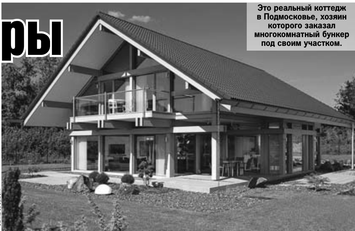
Это реальный коттедж в Подмосковье, хозяин которого заказал многокомнатный бункер под своим участком.

Как стало известно «КП», подобные бункеры есть почти в каждом элитном коттеджном поселке Подмосковья. Специалисты уверяют, что если вы видите группу домов стоимостью выше 1 миллиона долларов каждый, то, скорее всего, под одним из них есть замаскированный вход в защитный бункер. А самое дешевое защитное подземелье «на случай ядерной войны» сегодня предлагают построить за 900 тысяч рублей.