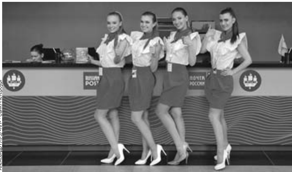
Александр ГЛУЗ/«КП» - Санкт-Петербург

В ближайшее время восприятие ведомства населением кардинально изменится.