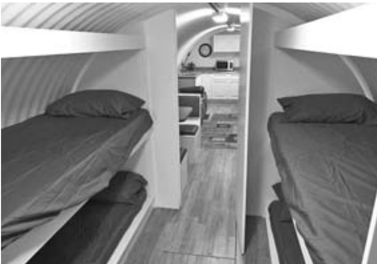
Этот вариант типа купе - бюджетный, сделанный в металлической трубе диаметром метра 3 - 4, вкопанной в землю на глубине метра-двух, с минимумом удобств.

атаки: ударную волну, облучение, радиоактивную пыль. А в мирное время мы поможем оформить его под кинозал, винный погреб, кальнянную, тренажерный зал или сейф.