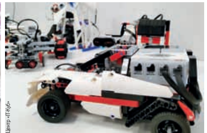
Занятия в интерактивном формате делают образование увлекательным.