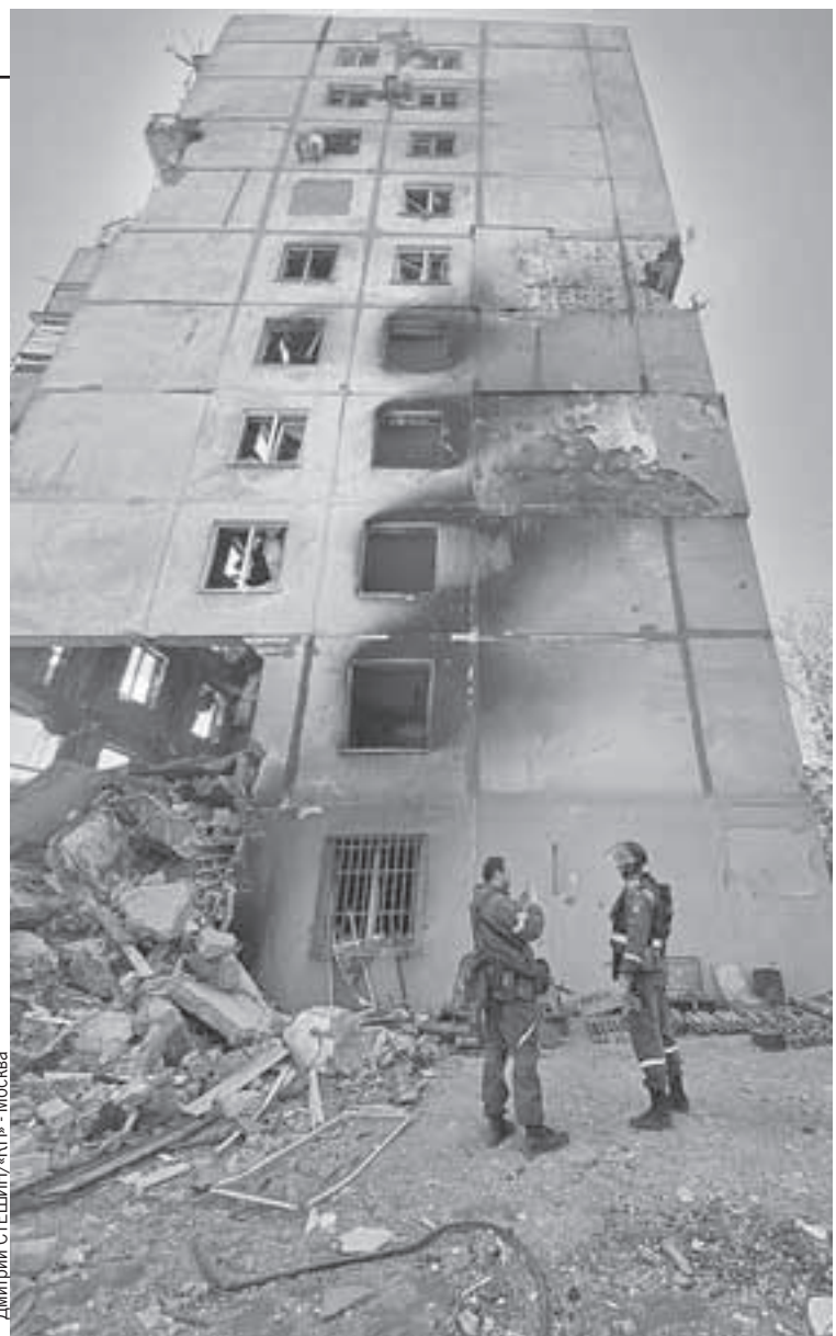
Некоторые девятиэтажки на «Восточном», попавшие под обстрелы, можно восстановить.

Стоим с саперами под стеной дома, на земле выложена, как они говорят, «икебана». Это найденные в развалинах и домах боеприпасы. Остатки оружейных складов ВСУ и нацбатов. Просто залетевшие в дома и несработавшие снаряды и мины. Самая стандартная просьба местных: «Помогите! У нас на лестнице, возле мусоропровода, лежит снаряд». Стандартный ответ: «Не трогайте, скоро приедем».