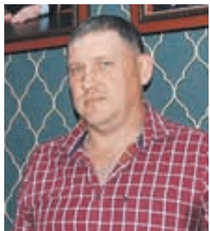
ГУ МВД России по Кемеровской области

Родителей в момент происшествия дома не было. За девочкой следила старшая 12-летняя сестра, пока их мама была на даче. По ее словам, все ручки пластиковых окон были скручены и убраны, но четырехлетняя малышка сама достала и прикрутила ручку, откры-