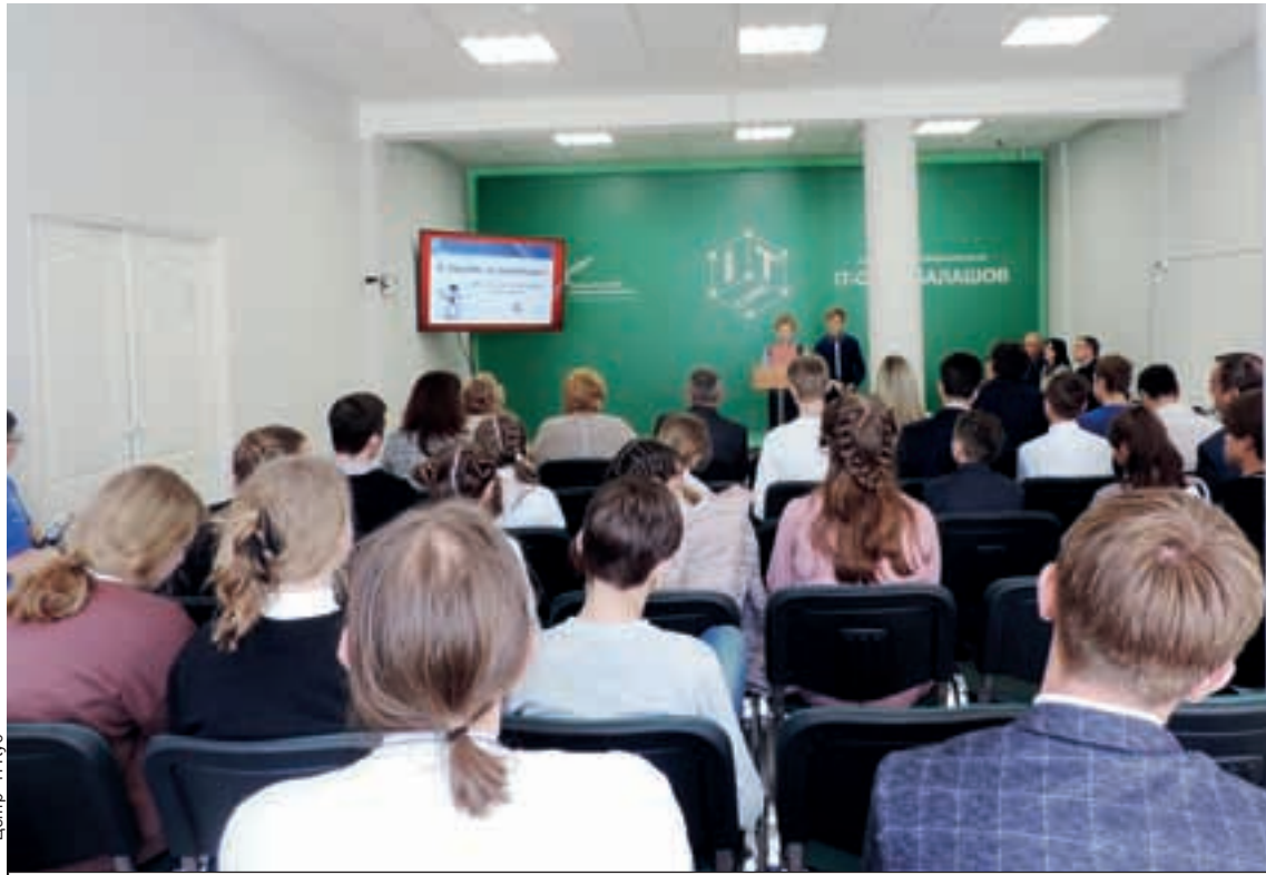
Разработка и защита проектов позволяют ребятам раскрывать свой потенциал.

териально-техническая база была обновлена в четырех организациях (ГБОУ СО «Школа-интернат АОП № 3 г. Саратова», ГБОУ СО «Школа-интернат АОП № 4 г. Саратова», ГБОУ СО «Школа-интернат АОП № 1 г. Энгельса», ГБОУ СО «Школа-интернат АОП № 1 г. Энгельса»). Реализация федерального проекта позволила создать инновационное практико-ориентированное образовательное пространство, способствующее формированию у обучающихся с ограниченными возможностями здоровья креативного, продуктивного мышления и практических навыков работы на высокотехнологичном оборудовании.