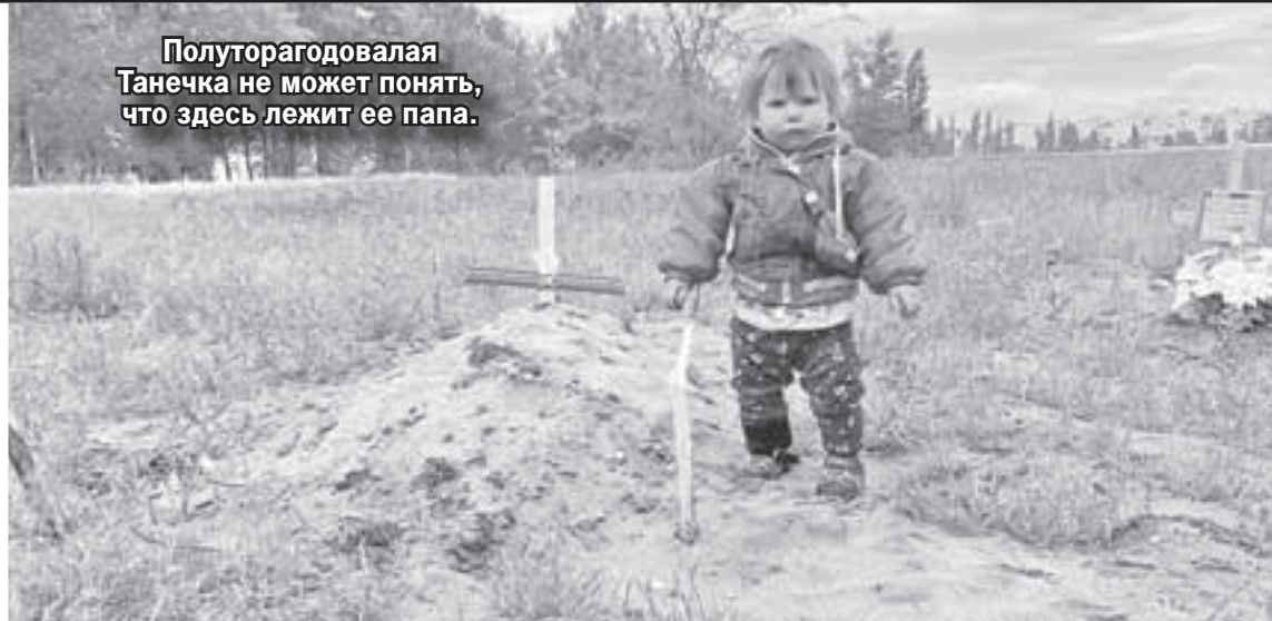
Александр КОЦ/КП - Москва