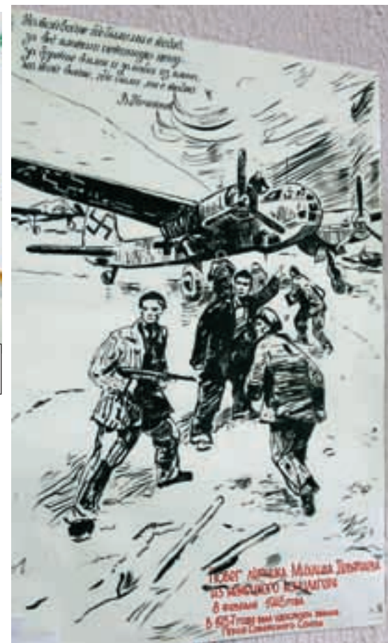
Работа на тему подвига летчика Девятаева.

После завершения конкурса работы будут переданы бойцам «за ленточку». По словам организаторов, подобные мероприятия очень важны не только для самих авторов, но и для наших солдат, что сейчас находятся в зоне боевых действий. Военные с удовольствием принимают подобные символические подарки, потому