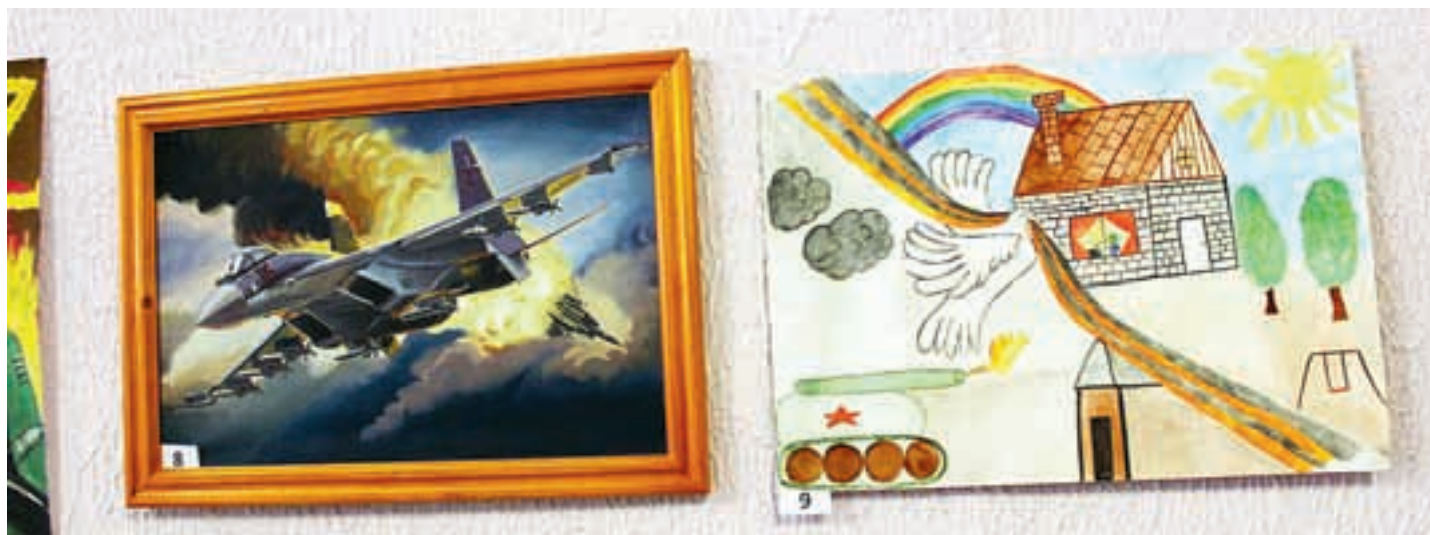
Некоторым художникам меньше 18 лет.