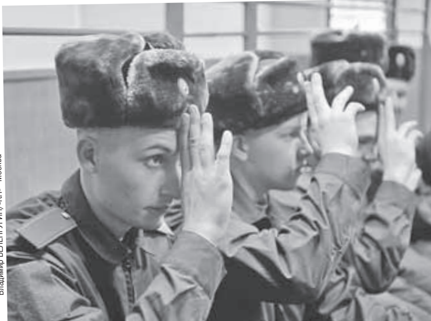
Эти призывники из Подмосквья уже получили военную форму, но не военные навыки, и, пока они служат срочную, в зону СВО отправлять их никто не собирается.