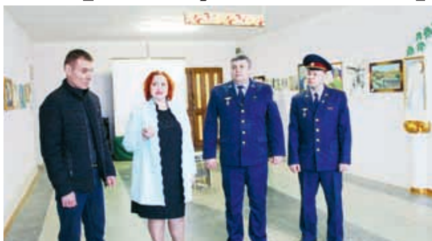
Организаторы выставки стараются привить заключенным патриотизм.

Работы были объединены общей темой, однако за каждой из них стоит своя история. Кого-то на творчество вдохновили «музыканты» из самого знаменитого в России оркестра, кого-то мощь русского оружия, а кого-то енот из херсонского зоопарка,