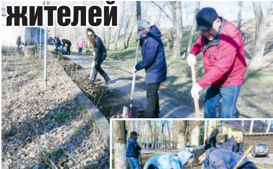
Собраны сотни мешков листьев, несколько тонн мусора растительного и промышленного происхождения.

В субботнике принимали участие служащие, активные жители, представители транспортных предприятий, обслуживающих маршруты общественного транспорта, Регоператора, РЖД. Уборка шла на прилегающих территориях предприятий торговли и потребительского рынка. Не стали исключением «Покровский рынок» и «Изобильный». Собранный мусор растительного и промышленного происхождения. Субботник продлился до вечера.