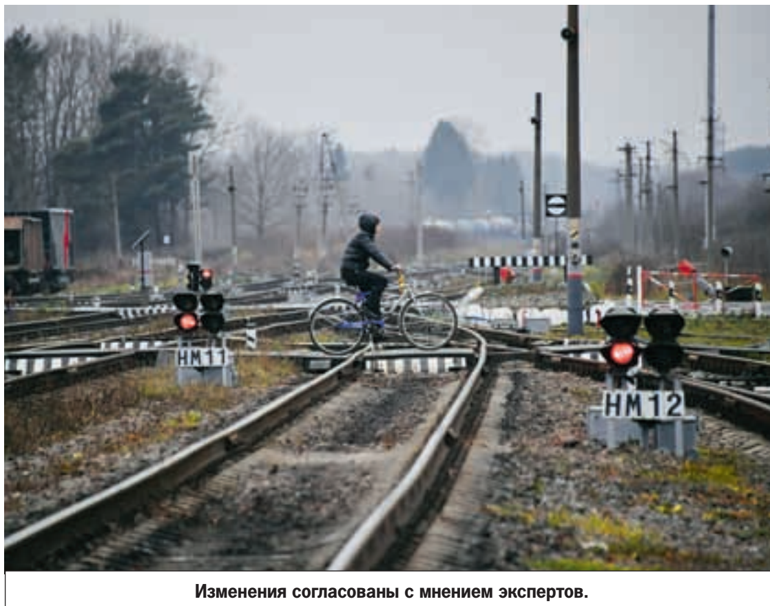
Изменения согласованы с мнением экспертов.

Вот только несколько участков, где, согласно пожеланиям горожан, необходимо