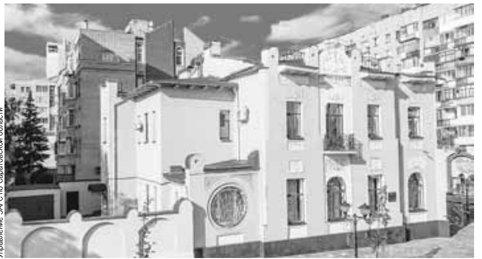
Управление ЗАГС по Саратовской области

Сотрудники специализированного отдела расскажут историю старинного особняка и легенды о нем, каким образом он стал Дворцом бракосочетаний. А также проведут шуточную церемонию регистрации брака. Гости смогут попробовать себя в роли молодоженов и свадебного регистратора.