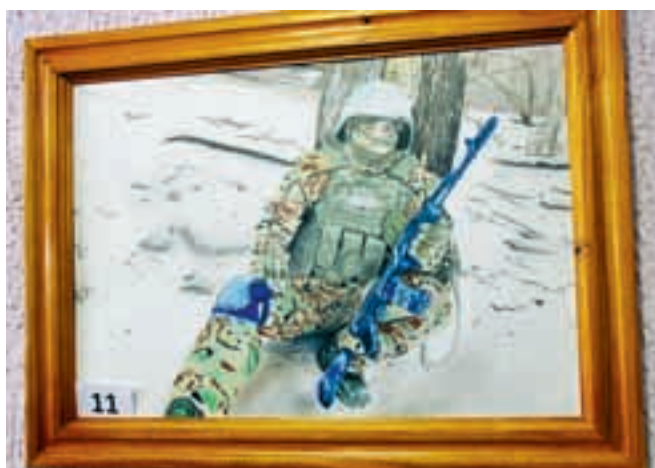
На картине запечатлен бывший заключенный, ушедший в зону СВО добровольцем.

Ассоциация помогает не только осужденным, но и их родственникам, а также людям, попавшим в трудную жизненную ситуацию. Обратиться в нее можно по номеру: +7 (964) 878-90-54 или прийти по адресу: Саратов, ул. Бахметьевская, д. 34/42, оф. 19.