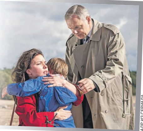
КАДР ИЗ СЕРИАЛА

Сериал «Любовь по приказу» на Первом канале активно обсуждают и рядовые зрители, и историки, и бывшие сотрудники спецслужб. И чаще всего осуждают. Избитый сюжет (сколько похожих лент было!) о «плохом» КГБ и красавице-артистке, попавшей в жернова госмашин. Историческая реальность лихо перекручена, ляпы буквально от первого до последнего кадра.