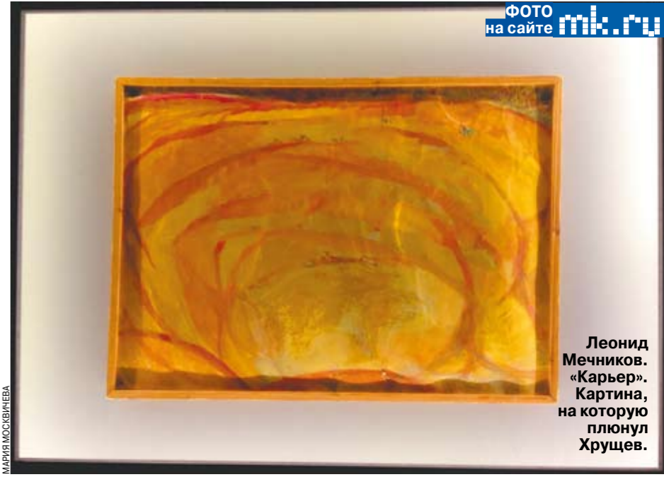
Леонид Меньшиков. «Карьера». Картина, на которую плюнул Хрущев.