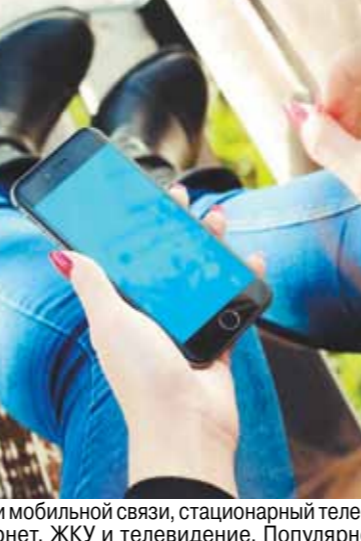
услуги мобильной связи, стационарный телефон, Интернет, ЖКУ и телевидение. Популярность данных операций обусловлена их бесплатностью,