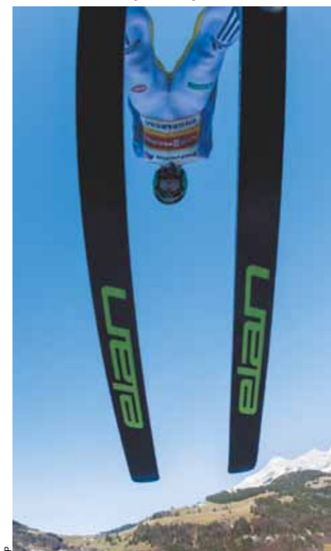
Прыгун с трамплина в полете.