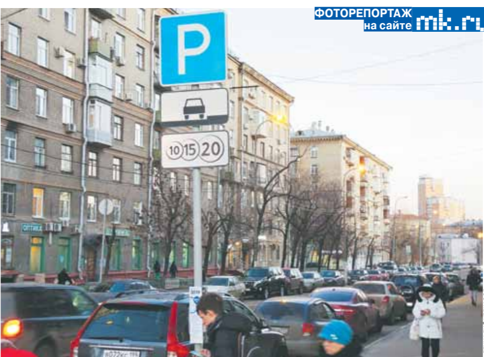
ФОТОРЕПОРТАЖ на сайте mk.ru