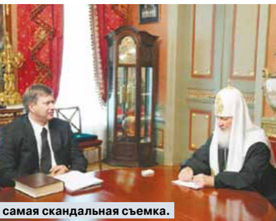
Та самая скандальная съемка.

Неожиданные формы принял праздник шологоликов «черная пятница»: на просторах российского Интернета появился сайт, предлагающий купить часы прямо как у патриарха Кирилла. Продаются хронометр элитного швейцарского бренда, который упоминался еще в романе «Евгений Онегин», почему-то за копейки, да еще и лично сопровождается фотографиями главы РПЦ. Атрикционному невиданной щедрости уже заинтересовался Федеральная антимонопольная служба.