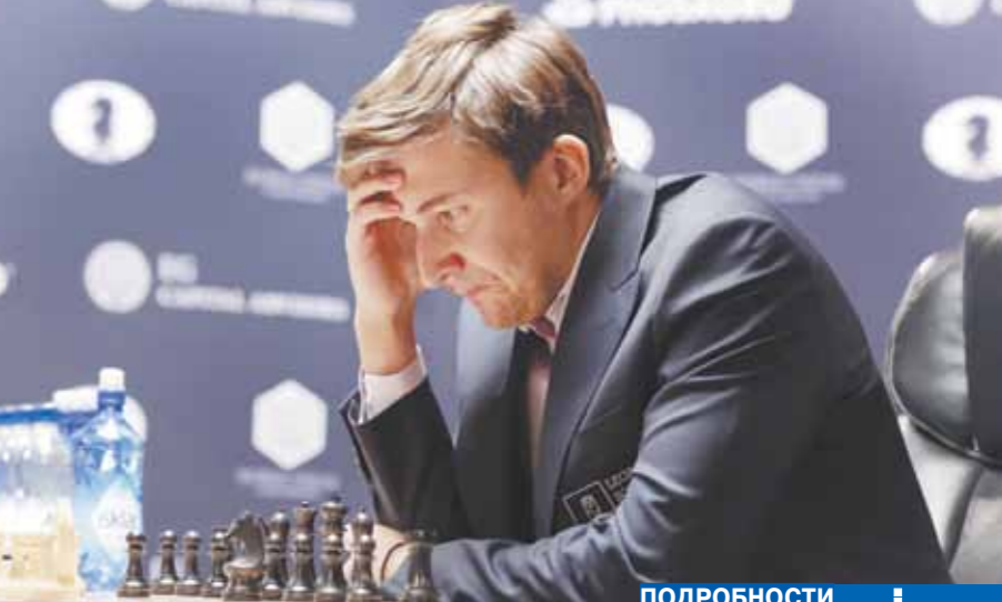
ПОДРОБНОСТИ на сайте mk.ru