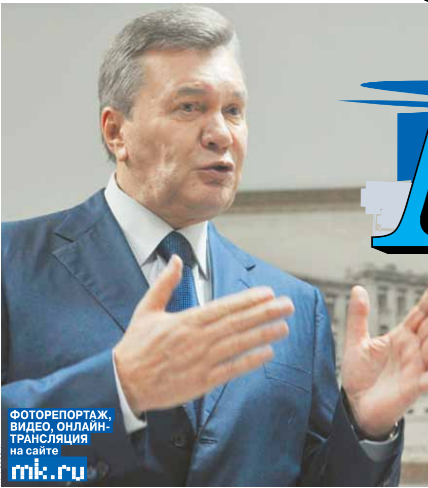
ФОТОРЕПОРТАЖ, ВИДЕО, ОНЛАЙН-ТРАНСЛЯЦИЯ на сайте mk.ru