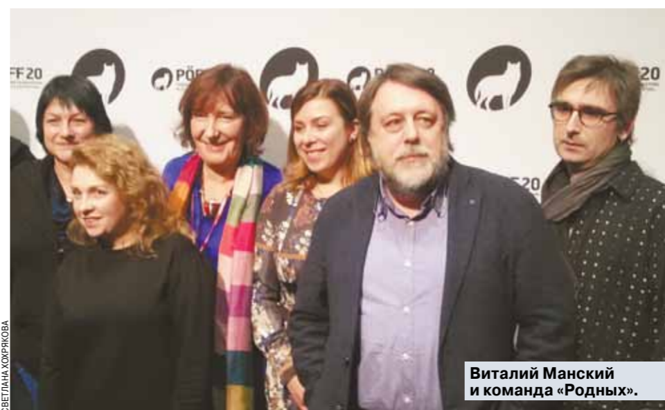
Виталий Манский и команда «Родных».

— Так в этом году все может повториться? — Теперь мы берем все риски на себя, полностью арендуем кинотеатр, а не работаем, как раньше, в партнерской программе.