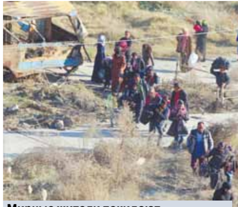
Мирные жители покидают охваченные боями районы Алеппо.

Однако 24 августа, когда турецкие вооруженные ступили на территорию Сирии при поддержке авиации и танков, Эрдоган уверял, что цель операции «Щит Евфрата» — «террористические организации, такие как ИГИЛ» (запрещена в России...)