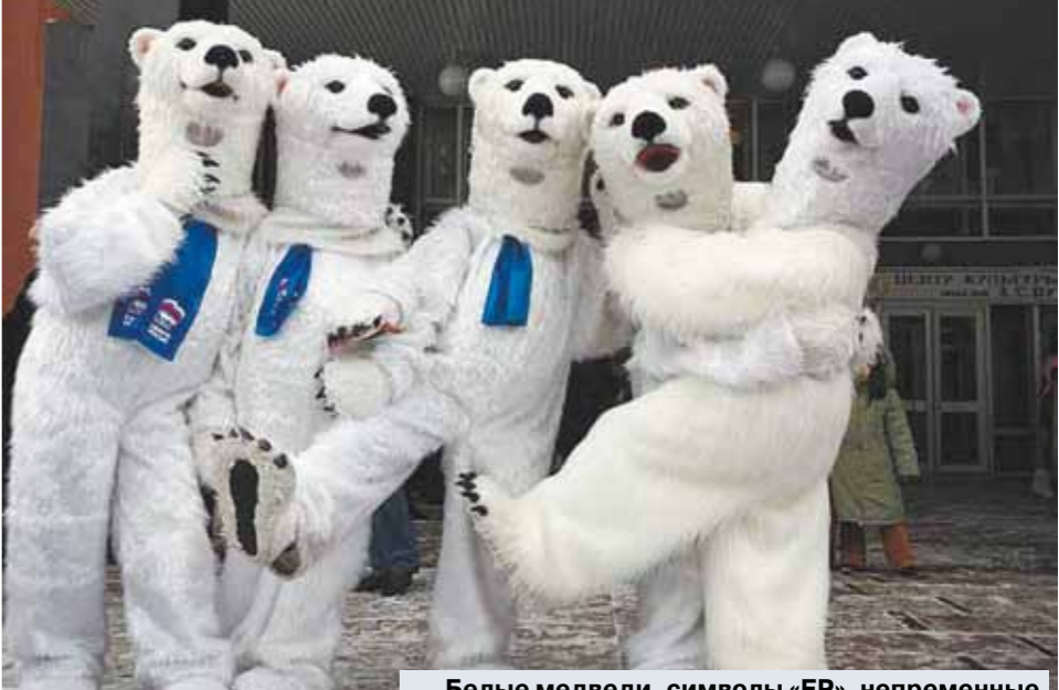
Белые медведи, символы «ЕР», неизменные участники всех партийных дней рождения.