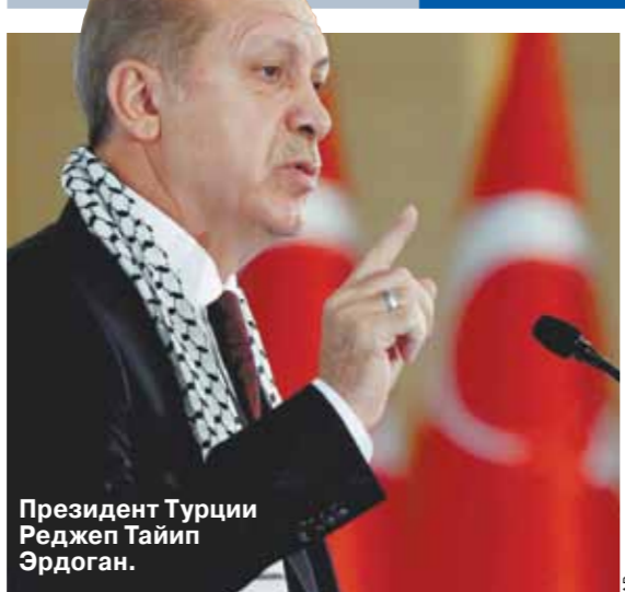
Президент Турции Реджеп Тайип Эрдоган.