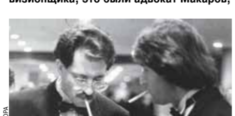
Влад Листьев и Леонид Ярмольник давали зрителям прикурить в их «L-клубе».

«Никас Сафронов: «Это была комета»» В судьбе самого экстравагантного отечественного живописца Владислава сыграл карьерообразующую роль отчаяние.