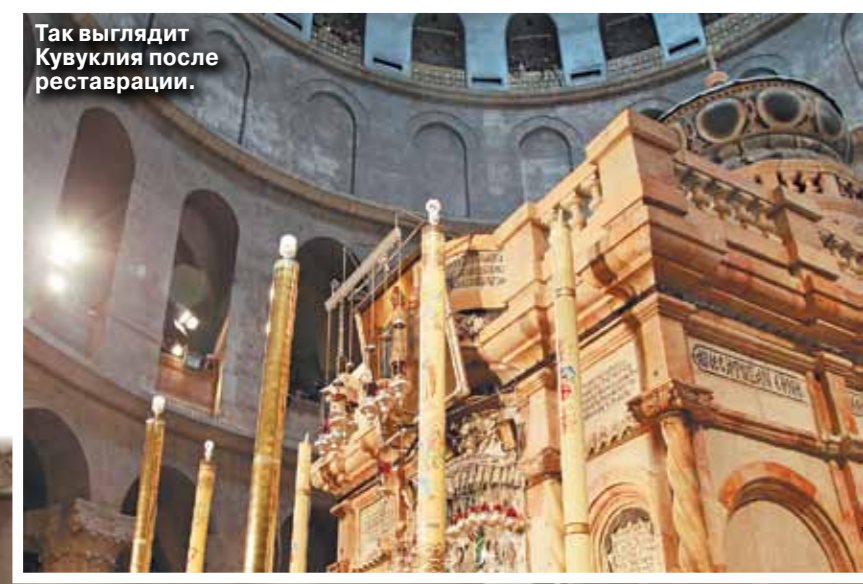
Так выглядят Кувуклия после реставрации.