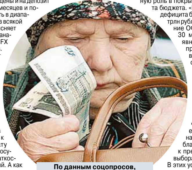
По данным соцопросов, о том, что такое облигации федерального займа, знают лишь 35% жителей нашей страны, и только около 7% россиян собираются их покупать.

В этих условиях, возможно, рациональнее было бы сократить бюджетные расходы, чем занимать, но вложить к этому не готова, потому что за большими расходами стоят ипотечные лоббисты».