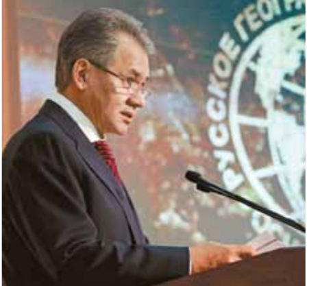
Читайте 6-ю стр.

26 лет назад, 17 апреля 1991 года, когда Сергей Шойгу возглавил Государственный комитет по делам гражданской обороны (ставший впоследствии МЧС), никто и не подозревал, что на долю 35-летнего сибиряка выпадет столько испытаний. Молодому строителю придется тушить вооруженные конфликты, ликвидировать последствия природных катаклизмов, спасать людей в районах гуманитарных катастроф, а с недавних пор руководить уникальными военными операциями за тысячи километров от России.