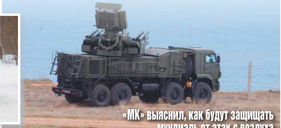
«МК» выяснил, как будут защищать мундиаль от атак с воздуха

В распоряжении оперативного штаба обеспечения безопасности Олимпийских игр в Сочи была не только истребительная авиация Южного военного округа. Противовоздушную оборону олимпийских объектов обеспечивали расчеты шести зенитных ракетно-пушечных комплексов «Панцирь-С1», которые прибыли в район Большого Сочи за несколько месяцев до начала Игр.