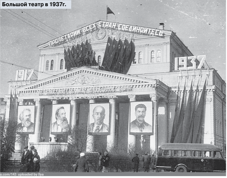
Большой театр в 1937г.

Соломон Волков раскрыл политическое закулисье главного театра страны