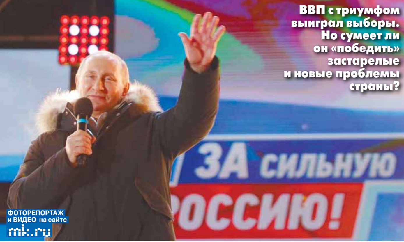
ФОТОРЕПОРТАЖ И ВИДЕО на сайте mk.ru

ВВП с триумфом выиграл выборы. Но сумеет ли он «победить» застарелые и новые проблемы страны?