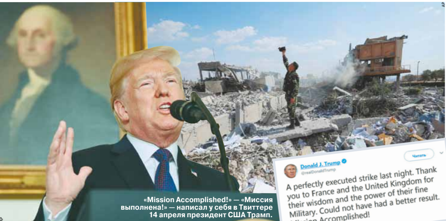
«Mission Accomplished!» — «Миссия выполнена!» — написал у себя в Твиттере 14 апреля президент США Трамп.