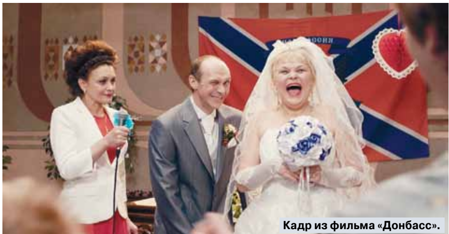
Кадр из фильма «Донбасс».