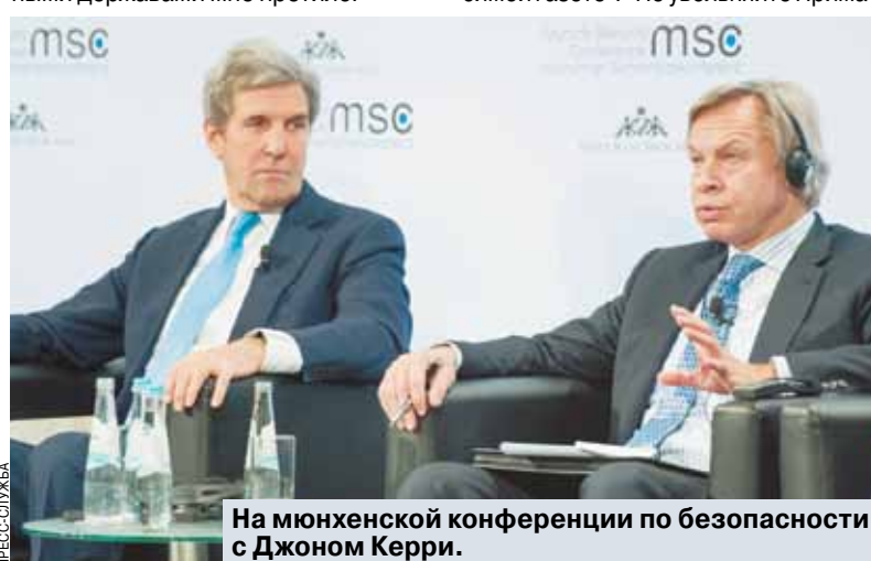
На мюнхенской конференции по безопасности с Джоном Керри.

нового руководства на внешнюю политику. Государственный аппарат тогда развивался по принципу: будем делать все не так, как в Советском Союзе. Я с этим был несогласен. Во внешнеполитической деятельности СССР далеко не все было неверным. Многие были правильными и связанными с отстаиванием геополитических интересов страны. Отторжение всего того, что делал Советский Союз на мировой арене, и слепое следование за западными державами мне претило.