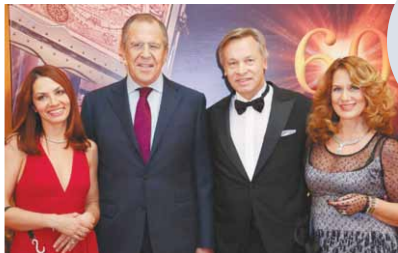
Министр иностранных дел Сергей Лавров и Алексей Пушков с женой и дочерью.

Известному тележурналисту исполняется 65 лет