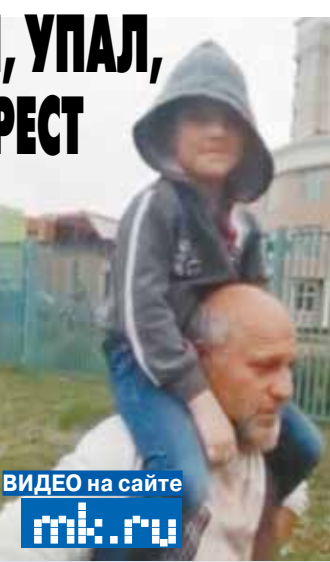
ВИДЕО на сайте mk.ru