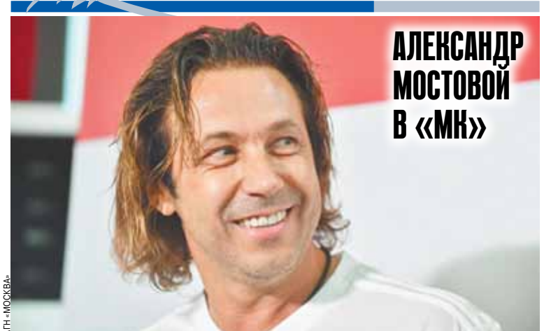
АЛЕКСАНДР МОСТОВОЙ В «МК»

В понедельник, 12 августа, в 14.00 в редакции газеты «Московский комсомолец» пройдет онлайн-конференция знаменитого экс-футболиста «Спартак» и сборной России Александра Мостового.