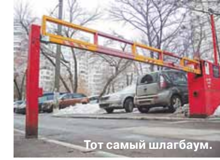
Тот самый шлагбаум.

Решение Мосгорсуда — в некотором смысле модельное для всего города. Хотя в России официально нет прецедентного права, при внесении решений по аналогичным делам районные суды вполне могут руководствоваться определениями вышестоящей судебной инстанции. Применительно к дворным шлагбаумам это значит, что во многих случаях их установку можно оспорить.