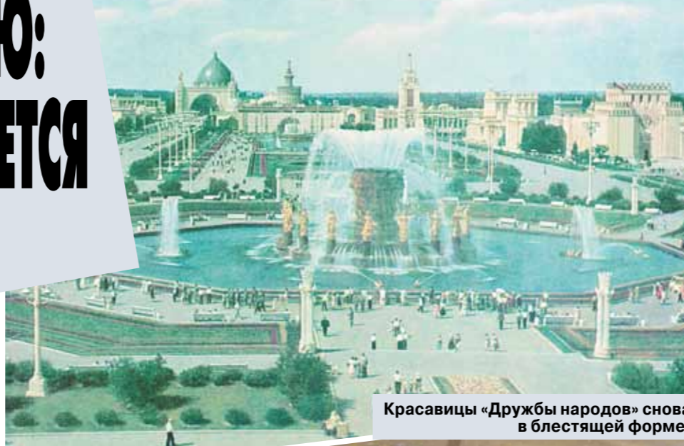
Красавицы «Дружбы народов» снова в блестящей форме.

— На нанесение позолоты на каждую скульптуру уходило около недели, — рассказал «МК» один из реставраторов. — Работал коллектив из 25 человек, за 4 месяца удалось восстановить все 16 фигур. Для того чтобы 4-метровые скульптуры вновь засияли под ярким летним солнцем, потребовалось порядка 5 кг сусального золота.