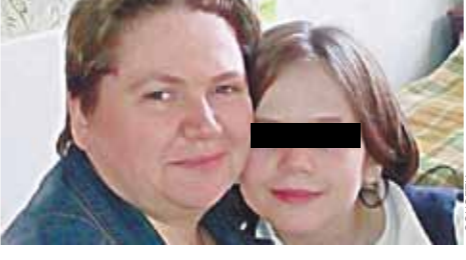
Мать девочки и ее мать.