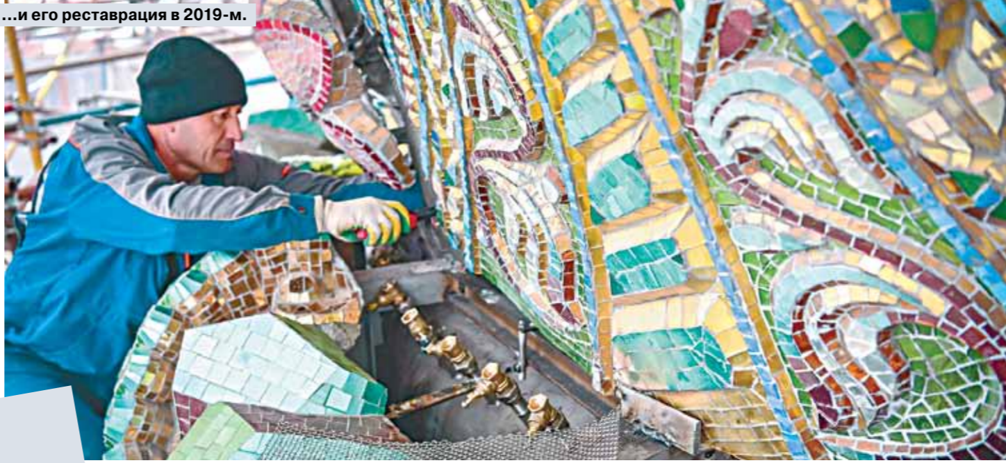
...и его реставрация в 2019-м.