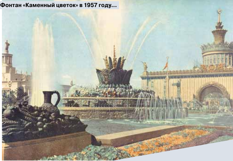
Фонтан «Каменный цветок» в 1957 году...