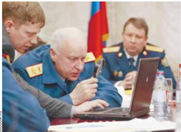
Иванович взглянет на сайт СК России. Там есть версия для слабовидящих.

Виртуозное владение компьютером продемонстрировал глава Следственного комитета России Александр Бастрыкин на одном из совещаний. Чтобы лучше разглядеть изображение на экране ноутбука, он отложил очки и воспользовался лупой. Не встроенным программным инструментом «Экранная лупа», а самой обычной. Никто из окружающих руководителя СК не рискнул подсказать ему, что разглядывать монитор через лупу занятие малоосмысленное и лучше просто увеличить изображение на экране. «МК» решил рискнуть: увеличить изображение в самом общем случае можно, нажав на клавиши «Ctrl» и «+». И еще, вдруг Александр