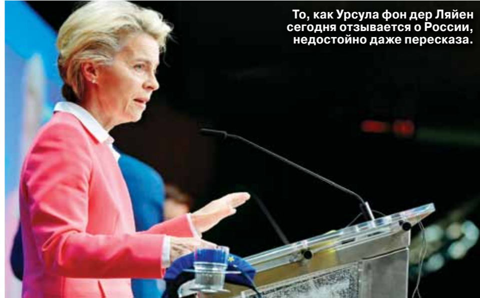
То, как Урсула фон дер Ляйен сегодня отзывается о России, недостойно даже пересказа.

Занимавшему в период правления Брежнев пост государственного секретаря США Генри Киссинджеру приписывают снисходительное изречение: «Кому я должен звонить, если я хочу поговорить с Европой?». Сделав это высказывание, гуру американской дипломатии дал понять, что, с его точки зрения, европейское интеграционное объединение — это некое эфемерное «облако в штанах». Но со времен активной фазы политической карьеры Киссинджера в Европе очень многое поменялось. И сегодня крайне сложно