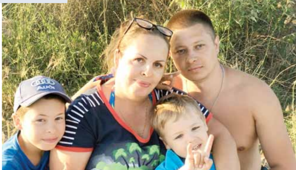
Ольга с семьей.

— При наличии высоких технологий эмбрионы могут храниться в пробирке годами и даже десятилетиями, и в будущем родители могут воспользоваться программой и у них будут дети. Я действительно родила ребенка, чей эмбрион был заморожен аж в 2013 году. — Предъявляют ли биологические родители какие-то особые требования к суррогатной маме, например, чтобы