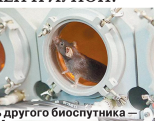
Модель другого биоспутника «Бион-М».

Новый вариант биоспутника, «Возврат МКА-Л», будет направлен в точку Лагранжа L1 системы Земля-Луна, где аппарат под воздействием гравитационных сил со стороны Земли и Луны может оставаться относительно их неподвижным. Однако в окрестностях этой точки