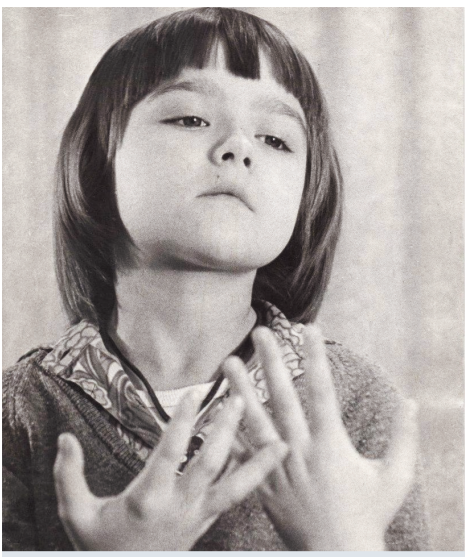
Ника Турбина — девочка-вундеркинд.