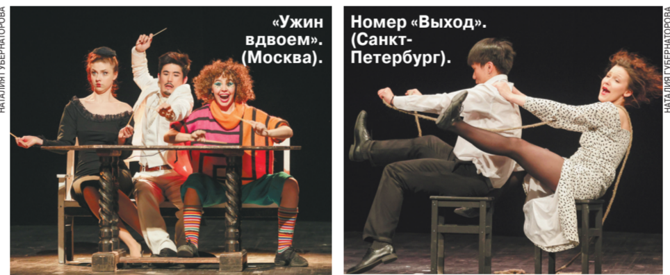
«Ужин вдвоем» (Москва). Номер «Выход» (Санкт-Петербург).

«Театр в движении» — так называется студенческий фестиваль по сценической пластике, который завершился в Шукке. Как у будущих артистов обстоит дело с движением, оценил обозреватель «МК», который входил в состав жюри фестиваля.