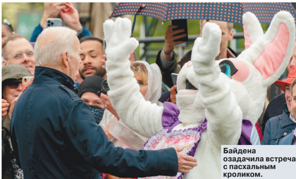
Байдена озадачила встреча с пасхальным кроликом.

По мнению Лейк, ближайшие полгода должны стать переломными в риторике