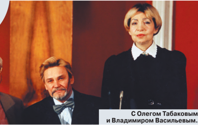
С Олегом Табаковым и Владимиром Васильевым.

Известная писательница дала интервью накануне своего 100-летия