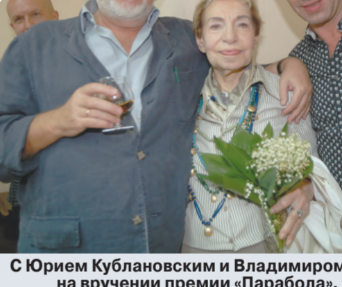
С Юрием Кублановским и Владимиром Машковым на вручении премии «Парабола», 2014 г.

— Юрием Кублановским и Владимиром Машковым на вручении премии «Парабола», 2014 г.