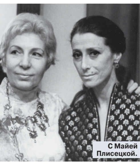
С Майей Плисецкой.

Мне кажется, что я знаю ее всю жизнь. Сначала за глаза, когда читала ее строгие критические статьи и восхищалась: как так ловко можно соединить несоединимое — рассудочность, железную логику и чувство. Как? А она могла. Потом я узнала ее тоже через глаза — но не свои, а Андрея Андреевича Вознесенского — поэта, гения головокружительной рифмы и парадокса образного мышления. Он приходил к нам в редакцию с новыми стихами и поэмами, сидел на верстке рядом с юным верстальщиком до тех пор, пока тот не доверялся его