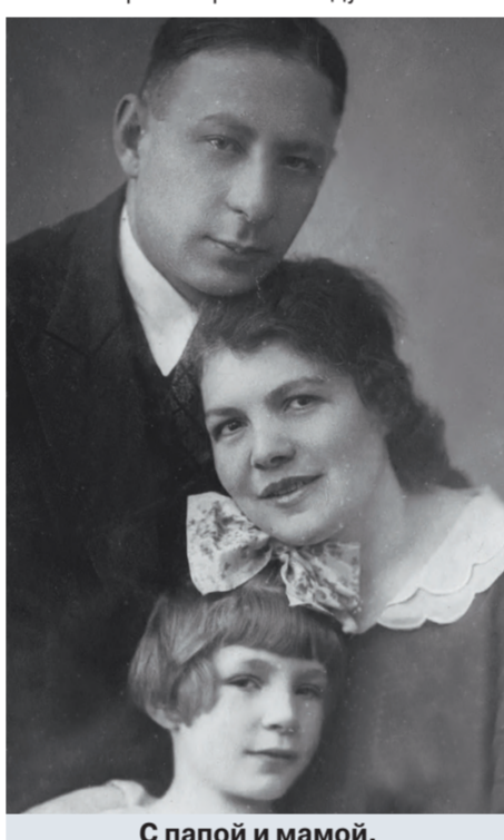
С папой и мамой.

Имена находят людей не случайно. И годы даруются тоже не просто так. Имя Зоя в переводе с древнерусского означает «жизнь». Эта самая жизнь подарила Зое 100 лет. Щедрость царская. Милость Божья — дожить. Сегодня Зое Богуславской — писателю, драматургу, общественному деятелю — исполняется 100 лет.