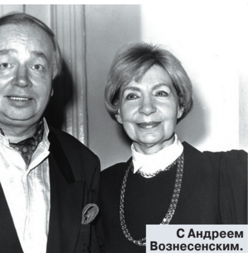
С Андреем Вознесенским.

Имена находят людей не случайно. И годы даруются тоже не просто так. Имя Зоя в переводе с древнерусского означает «жизнь». Эта самая жизнь подарила Зое 100 лет. Щедрость царская. Милость Божья — дожить. Сегодня Зое Богуславской — писателю, драматургу, общественному деятелю — исполняется 100 лет.