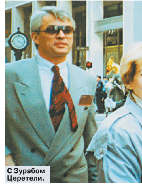
С Зурабом Церетели.