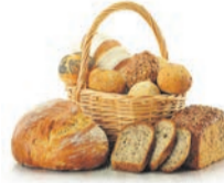
График работы: 5/2, 2/2. Достойная оплата труда, без задержек, 2 раза в месяц, премии по итогам работы. Всеволожский район, п. Щеглово, дом 1а.