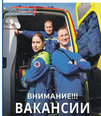
График работы сменный, возможно трудоустройство по совместительству.

Присоединяйтесь к нашей команде и получите бонус на медицинское обслуживание, в том числе ДМС.