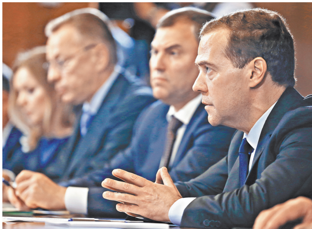
Дмитрий Медведев считает, что при формировании бюджета приоритет должен оставаться за социальной сферой.

Хотя впереди у законодателей летние каникулы, «Единая Россия», как и остальные политические силы, проведет эти два месяца в подготовке к региональным выборам. Они пройдут 13 сентября. В очередной Единый день голосования в 21 регионе выберут губернаторов, а в 11 — депутатов законодательных собраний.