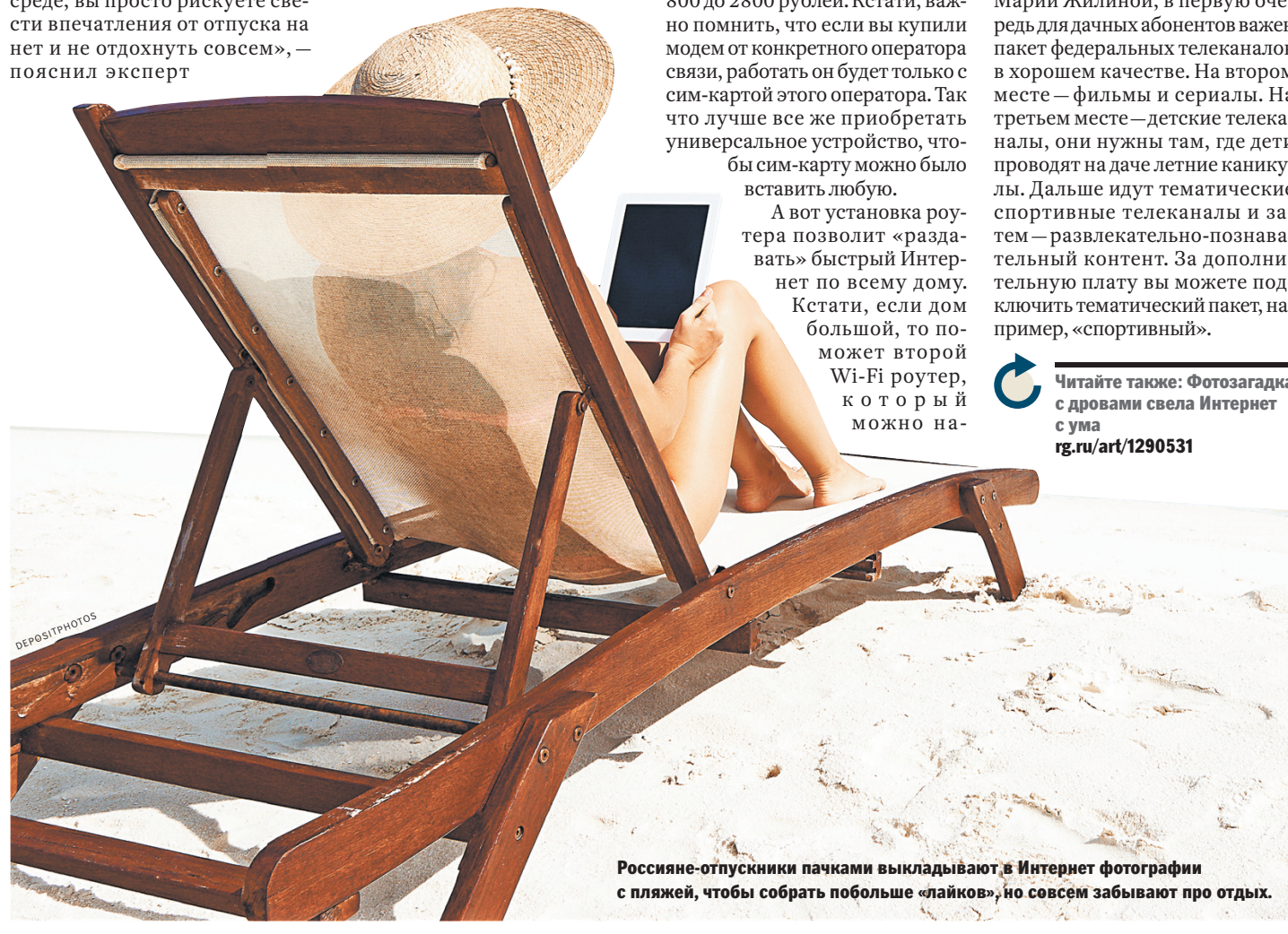
Россияне-отпускники пачками выкладывают в Интернет фотографии с пляжей, чтобы собрать побольше «лайков», но совсем забывают про отдых.

Читайте также: Фотогаджеты с дронами свела Интернет с ума rg.ru/art/1290531