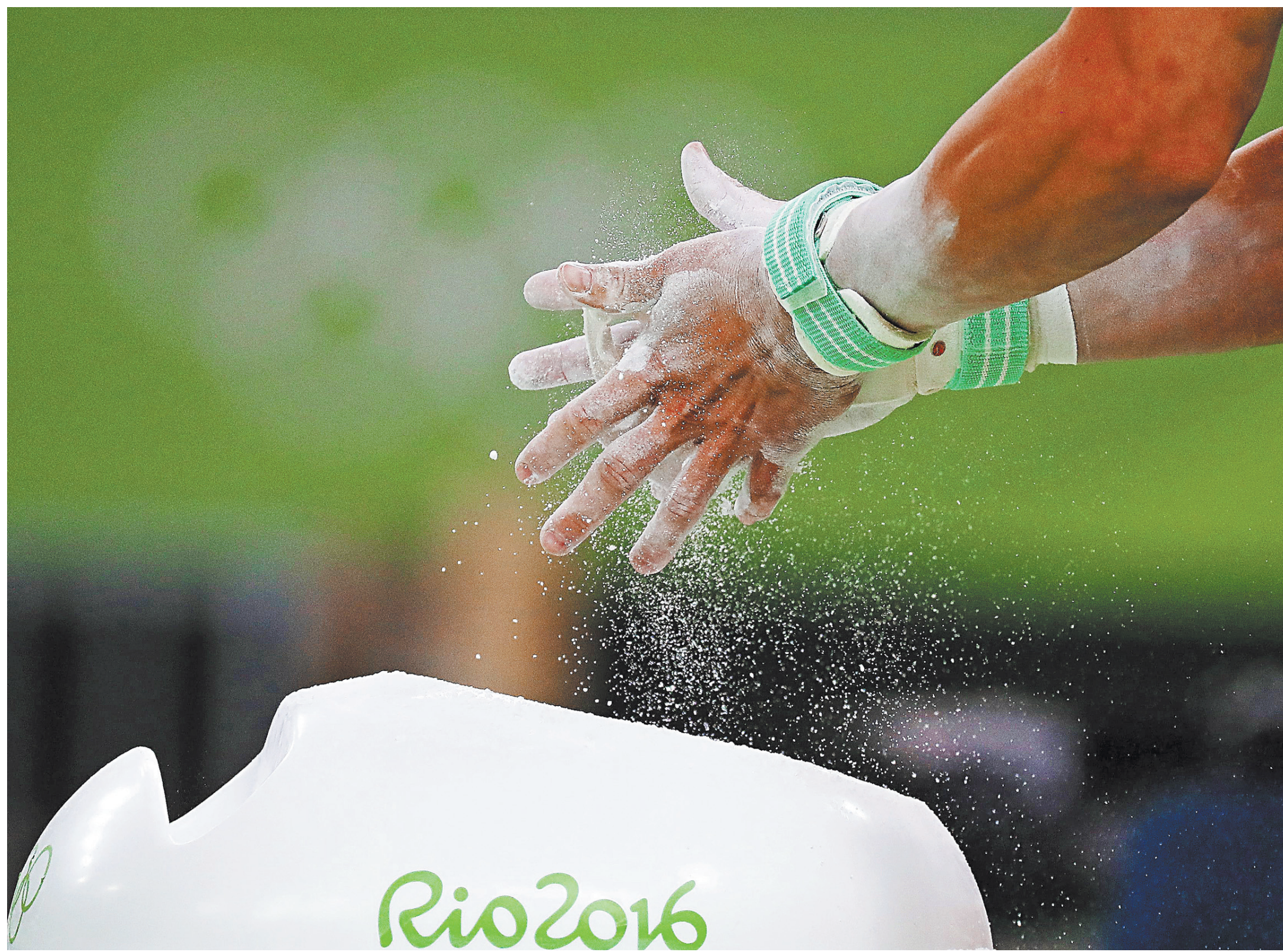
Некоторые западные спортивные функционеры до последнего надеялись, что российские олимпийцы уюют руки и откажутся от участия в Олимпиаде. Но наши спортсмены сохранили мужество и, надеемся, спортивную злость, чтобы порадовать страну своими победами.

1 → Но только на несколько часов. Потому что все еще только начина-