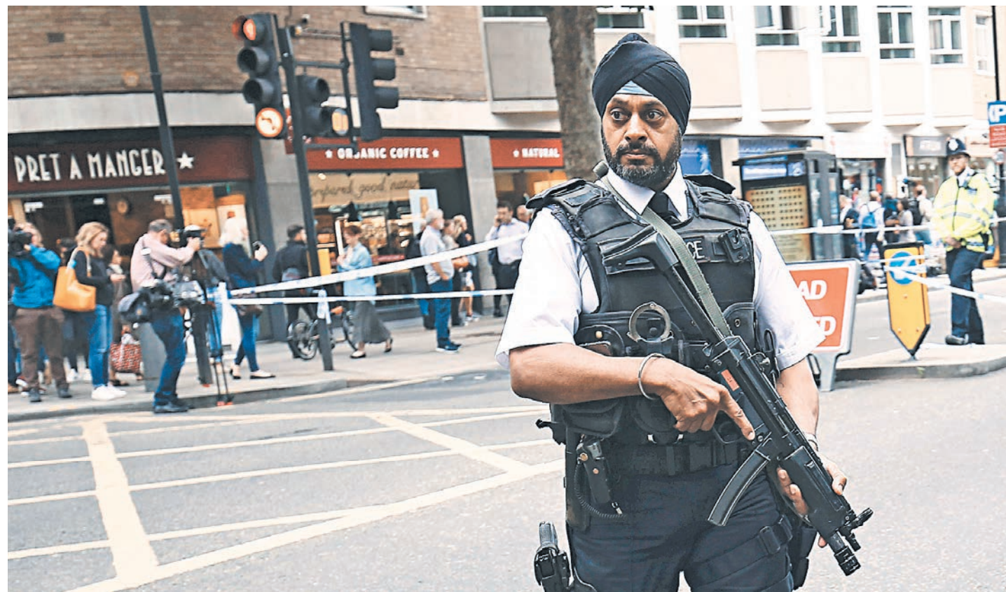
Полицейский охраняет подходы к месту теракта — следствие стремится установить все детали нападения.