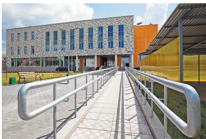
Новая школа в микрорайоне Захарьино оборудована пандусами и готова принять детей с ограниченными возможностями здоровья.

В первые классы столичных школ 1 сентября пойдут около ста тысяч детей, сообщила «РГ» в департаменте образования. За последние 20 лет Москва имеет в этот год такое количество первоклашек — первый раз была в прошлом году.