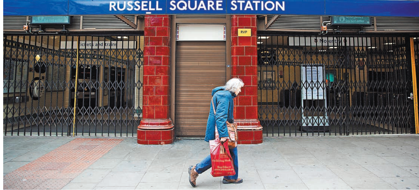
Станция лондонского метро «Рассел-сквер» после теракта была на время закрыта.

Конечно, можно предположить невероятное: сразу в трех странах — Франции, Германии и Британии — врачи ошиблись и не распознали в своих пациентах потенциальных убийц. Однако у этой версии есть существенный изъян: в прежние годы так часто всплеска насилия со стороны душевно нездоровых людей с таким количеством жертв никогда не случалось. А значит, попытки Берлина, Парижа, а теперь и Лондона все объяснить просчетами медиков выглядят несостоятельными. Причем, что удивительно, психические откло-