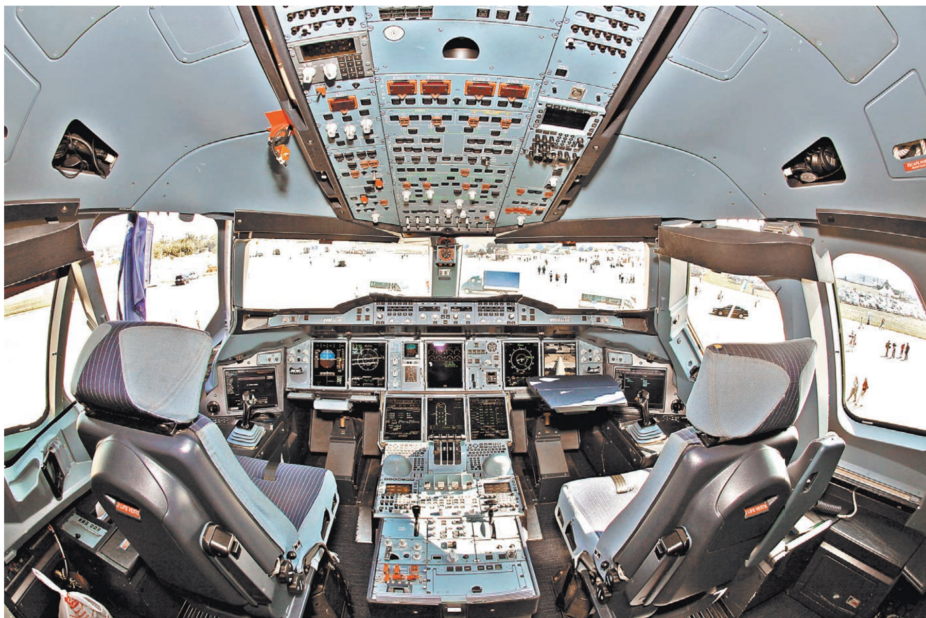
Вычислительная система «летающего компьютера» включает не меньше 80 бортовых мини-ЭВМ.

При расследовании авиационных катастроф, увы, не всегда известно главное — где ошибки летчика, а где «ошибки» бортового компьютера. То есть система безопасности полетов полностью не наблюдаема: отсутствуют описания алгоритмов и программ принятия бортовым компьютером решений по управлению самолетом. По неполной информации, следуя гипотезе абсолютно корректного программного обеспечения бортовых компьютеров, эксперты делают заключение о развитии ситуации на борту воздушного судна. И, конечно, при известном алгоритме контроля систем самолета техническая неисправность оборудования вынуждает экспертов сделать вывод об ошибках экипажа. Вместе с тем опыт эксплуатации воздушных судов показал: в программном обеспечении бортовых компью-