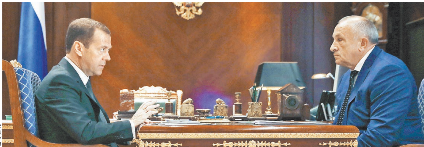
Премьер в беседе с главой Удмуртии подчеркнул, что правительство продолжит софинансирование строительства школ в регионах, средства на 2017 год уже зарезервированы.

— Цифра в целом неплохая, но надо, конечно, стремиться к тому, чтобы выйти на сплошное подключение к МФЦ, — сказал Медведев. — Мы приняли программу, чтобы уйти вообще от бумажной волокиты и чтобы самые разные виды государственных услуг можно было получить именно в МФЦ. Естественно, это мы будем делать по мере готовности регионов, но в целом такая программа есть и прошу вас тоже этим заниматься.