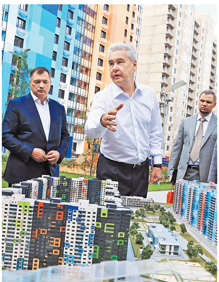
Мэру столицы рассказали о преимуществах нового типа жилых домов.