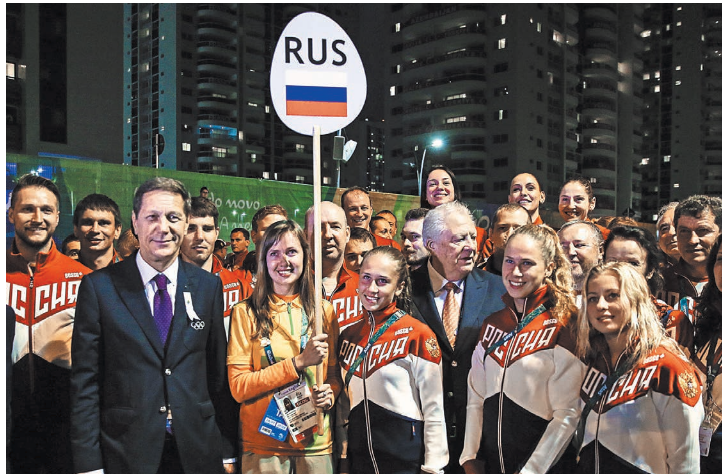
В Олимпийской деревне прошла церемония поднятия российского флага. При этом присутствовала большая часть российских спортсменов, уже поселившихся в деревне, а также официальные лица делегации во главе с руководителем ОКР Александром Жуковым и почетным членом МОК Виталием Смирновым.