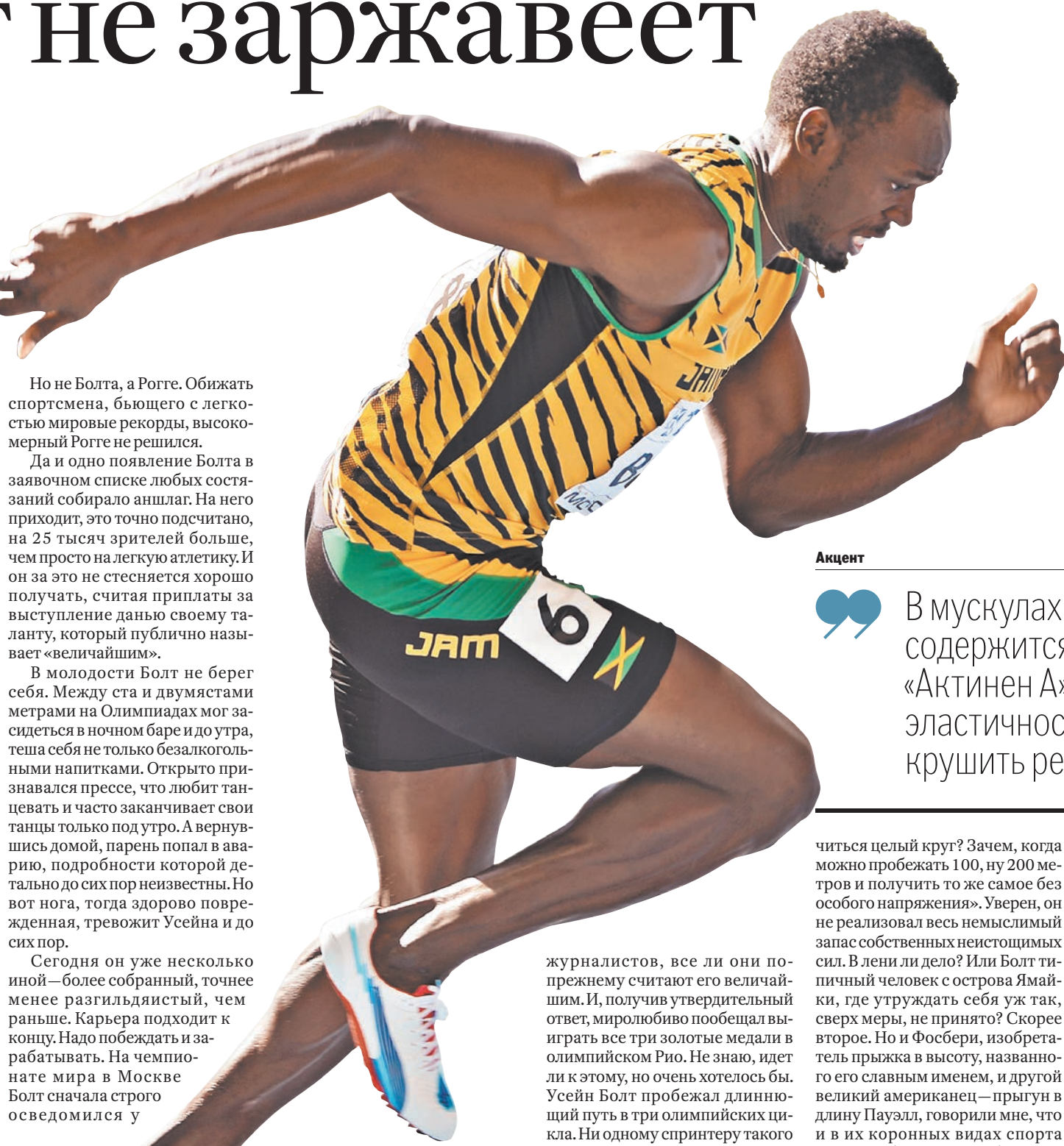
Останется ли Болт самым быстрым человеком на планете, узнаем скоро.

Однако в 2008-м в Пекине действительно сбилось. Когда он натягивал лук, дразня публику и приковывая внимание, президент МОК Рорге пожурил его за этот жест. На мой вопрос, как относятся к критике главы мирового спорта, Болт невинно переспросил: «А Рорге — это кто?». И вскоре последовали извинения.