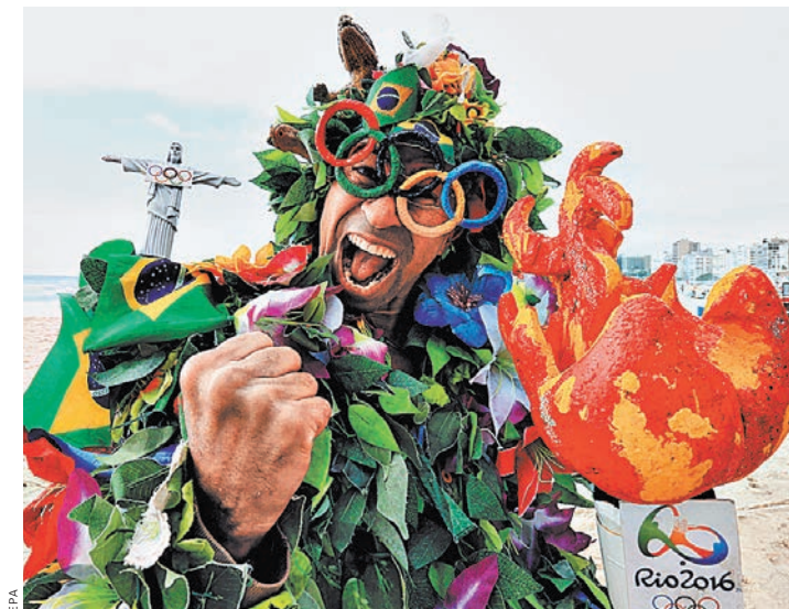
Для бразильцев Олимпиада — это продолжение знаменитого на весь мир карнавала в Рио.

В Барре нет океана и шикарных отелей. И хотя публика в этом районе достаточно обеспеченная, архитектура местных кондоминиумов не производит впечатления из-за своей одноплотности. Каждое 15–20-этажное здание огорожено сплош-