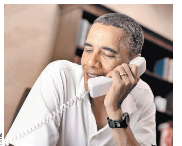
На этот раз юбилейная дата стала для Барака Обамы обычным рабочим днем.

Восточном 55-й день рождения президента США стал обычным рабочим днем. В соответствии с графиком, в четверг он провел закрытое совещание Совета по национальной безопасности, после чего пообщался с журналистами на пресс-конференции. А уже сегодня у Барака Обамы начнется двухдневный отпуск. По уже сложившейся традиции президент вместе с семьей отправится на живописный остров Маргас-Виньярд в штате Массачусетс, где семейство бывает практически каждое лето.