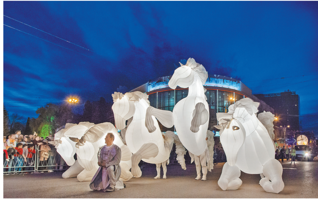
На Платоновском фестивале публика увидела одну мировую и десятков российских премьер.

Открылся фестиваль оперой «Родина электричества» — первой в мире попыткой поставить Платонова в музыкальном театре. Сочинение Лебея Седельникова, первоначально названное «Лампочкой Ильича», жалю своего часа почти сорок лет. Известный режиссер Борис Покровский поставил его не успев, другие не брались прежде всего из-за сложной партии хора, которому отведена главная роль. На авангардную музыку здесь положен «корявый» платоновский текст: «Электрификация есть такая же революция в технике, как Октябрь семнадцатого года, с ее введением изменяется характер и самая сущность людей...»