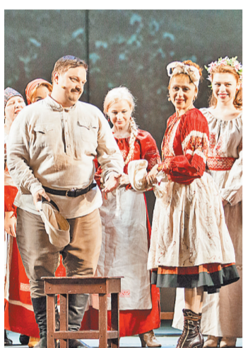
Марафон оперетты откроется в Гатчине «Свадьбой в Малиновке» Бориса Александрова.

Спектакль будет поставлен в Музкомедии впервые за последние 56 лет и показан всего один раз.