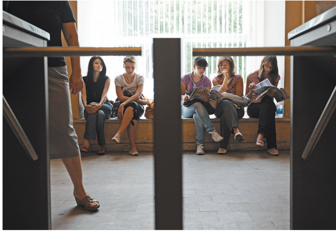
Запрет приема никак не ограничивает работу вуза с теми студентами, которые уже учатся.

вуз—Московская академия экономики и права—лишен госаккредитации по двум специальностям: экономика и юриспруденция.