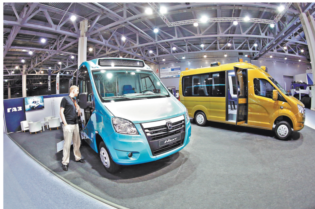
Группа компаний ГАЗ представила свои беспилотные автобусы, сделанные на базе «Газель Next».

Компания Hyundai официально показала новый Santa Fe четвертого поколения для России. Большой кроссвер будет поставяться на рынок с двумя вариантами двигателей: бензиновым 2,4-литровым мотором мощностью 188 л.с. с 6-ступенчатой автоматической трансмиссией и 2,2-литровым дизельным двигателем мощностью 200 л.с. в сочетании с новой 8-ступенчатой АКПП.