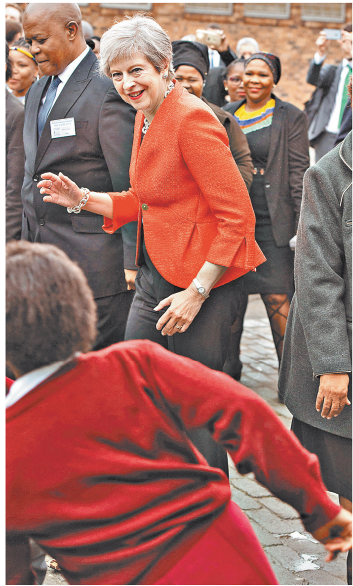
Во время визита в ЮАР британский премьер Тереза Мэй станцевала со школьниками Кейптауна местный национальный танец.

ния в должность Никола Юло объявил о планах закрытия до 17 французских ядерных реакторов по исполнению закона о реформировании энергетики. Он предусматривает снижение до 50 процентов доли атомной энергии в общем объеме производства электроэнергии во Франции. Атомщики встретили эту инициативу в штатки и фактически ушли от диалога с Юло. Обратились напрямую к Макрону, попросив его отложить реформу отрасли до 2029 года. Более того, в Елисейском дворце, по некоторым данным, согласились с предложением атомщиков заменить устаревшие установки на новые. Министр в ответ даже написал статью в газете «Либерасьон» на эту тему в начале августа, о его рекомендации в Париже так и не выняли. Юло в радиозоне назвал эти планы «безумством в экономическом и технологическом плане», а следом объявил об отставке. Он просто устал быть в одиночестве.