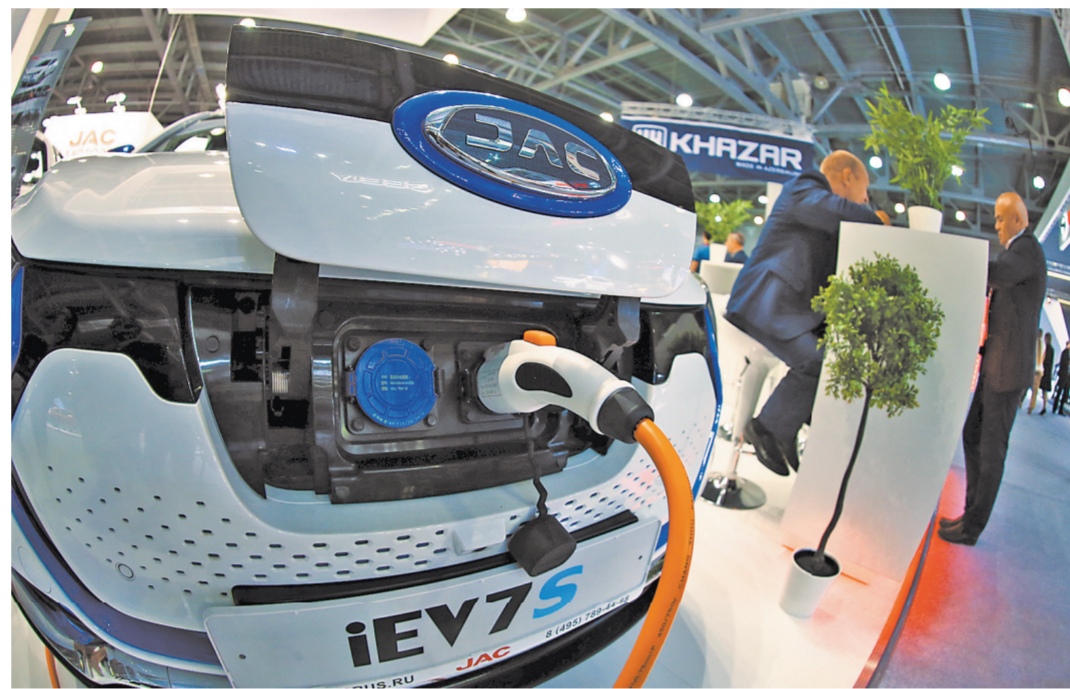
Новичок на российском рынке компания JAC решила поразить россиян своим электрокаром.