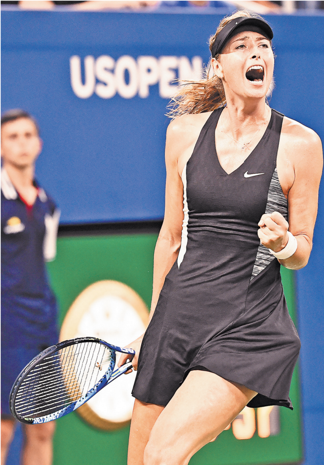
Мария Шарапова победила на Открытом чемпионате США в 2006 году.