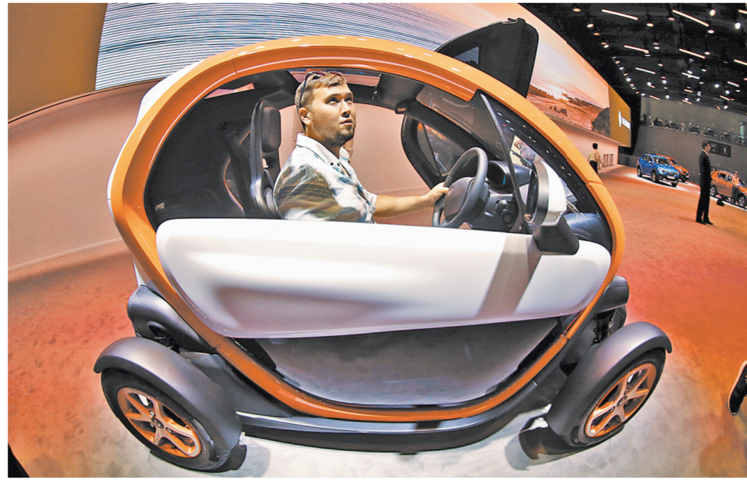
На стэнде Renault можно поехать и в маленьком двухместном электрическом Twizy.

1 Год назад Федеральная служба по надзору в сфере образования и науки опубликовала скандальную статистику. Доля медалистов среди выпускников школ Карачаево-Черкессии — примерно 20 процентов (то есть каждый пятый), в Адыгее — 17,7, Кабардино-Балкарии — 17,3, Мордовии и Ставропольском крае — по 16, Краснодарском крае — 15,6, в Ростовской области — 14,7 процента. При этом в Москве медали получили менее 9 процентов выпускников, в Петербурге — немногим более 7, а в среднем по России — примерно 10 процентов. После этого в субъектах началась