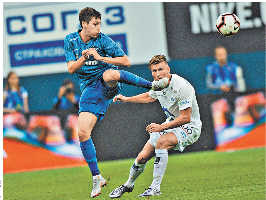
Первый матч «Зенита» и «Мельде» завершился волевой победой российского клуба со счетом 3:1.

«Зенит» сейчас на ходу, о чем говорят не только победы в еврокубках. Шикарный старт — пять побед в пяти турах чемпионата — вывел «сине-бело-голубых» в главные фавориты российской Премьер-лиги. Артем Дзюба так и вовсе в сумасшедшей форме — любимец публики забивает в каждом матче. Так что все, что нуж-