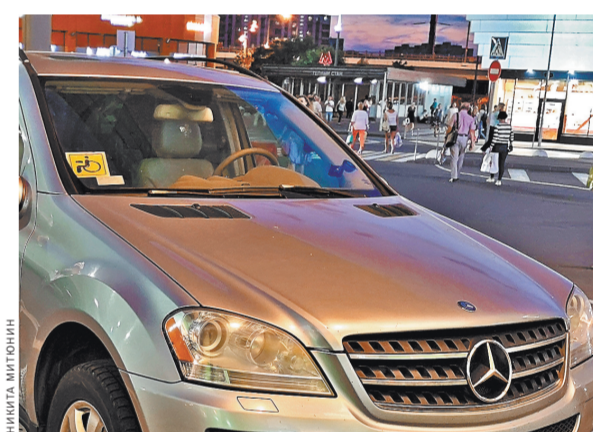
Наличие знака «Инвалид» будет подтверждать право на бесплатную парковку.